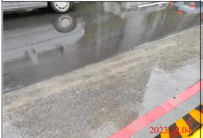
巡查日期地點：112.12.04/ Y23車站 照片說明：路面龜裂狀況