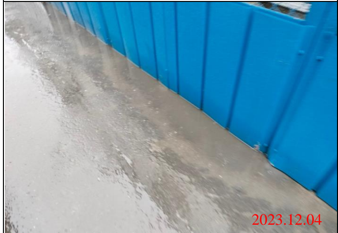
巡查日期地點：112.12.04/ Y23車站 照片說明：路面龜裂狀況