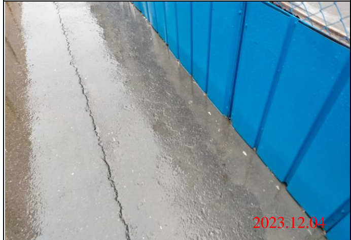
巡查日期地點：112.12.04/ Y23車站 照片說明：路面龜裂狀況