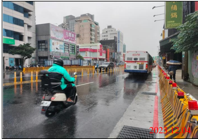
巡查日期地點：112.12.04/ Y21車站 照片說明：路面狀況