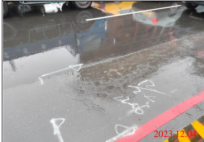
巡查日期地點：112.12.04/ Y23車站 照片說明：路面龜裂狀況