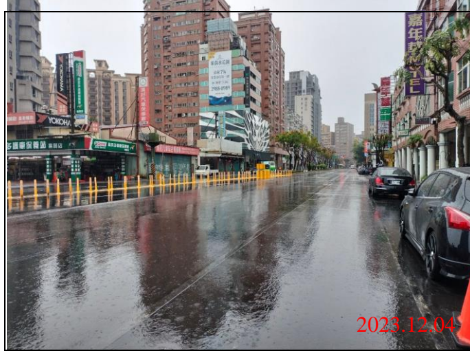
巡查日期地點：112.12.04/ Y21車站 照片說明：路面狀況