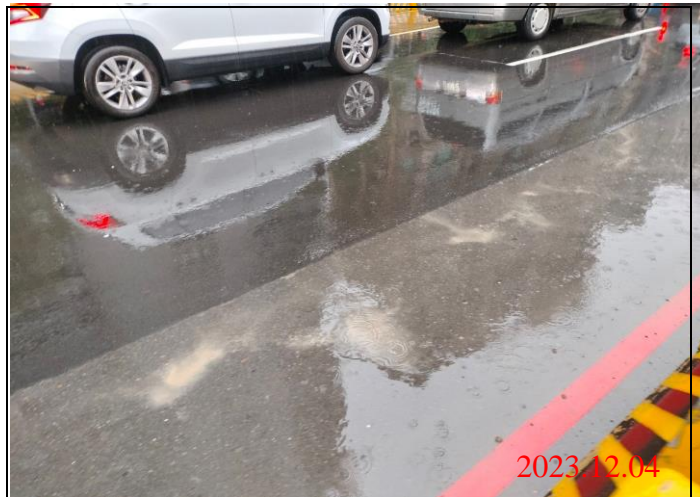
巡查日期地點：112.12.04/ Y23車站 照片說明：路面龜裂狀況