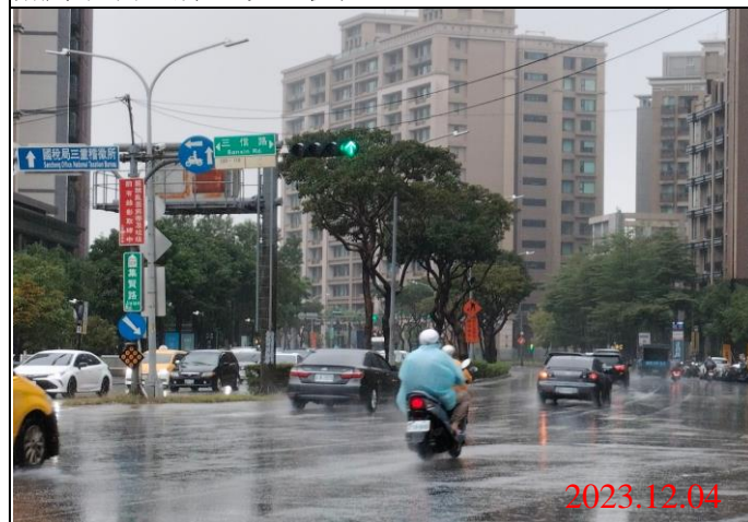
巡查日期地點：112.12.04/ Y23車站 照片說明：牌面設置狀況