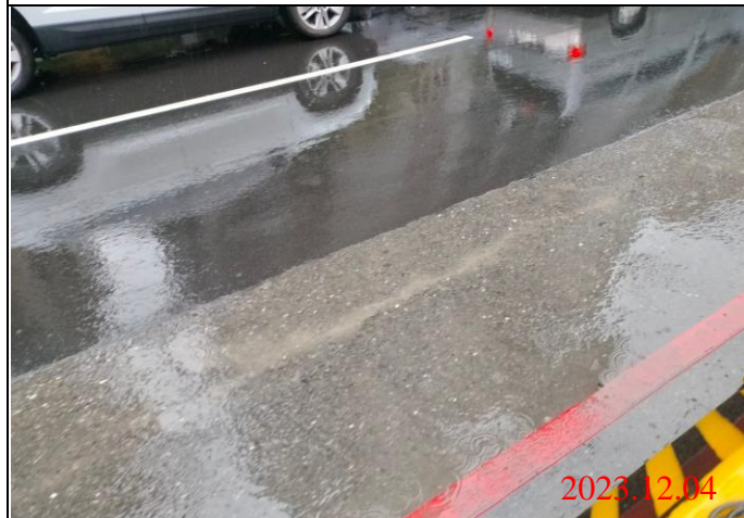
巡查日期地點：112.12.04/ Y23車站 照片說明：路面龜裂狀況