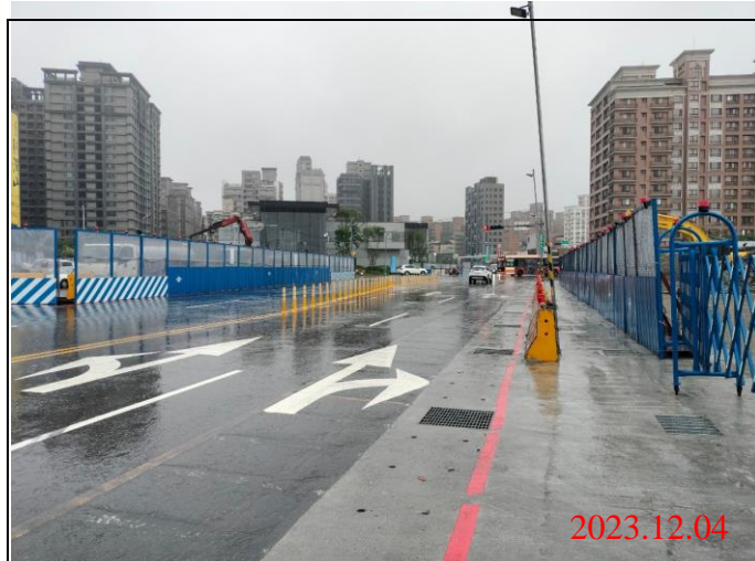
巡查日期地點：112.12.04/ Y22車站 照片說明：路面狀況