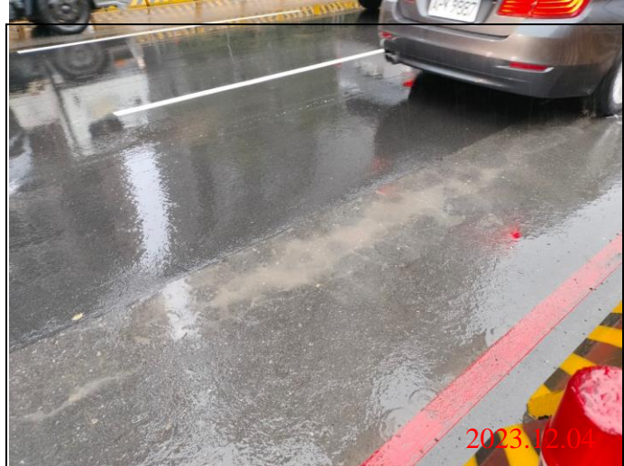
巡查日期地點：112.12.04/ Y23車站 照片說明：路面龜裂狀況