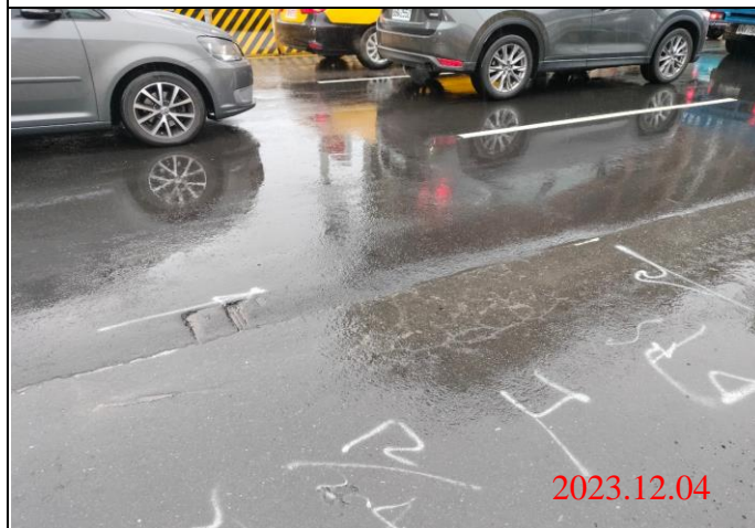
巡查日期地點：112.12.04/ Y23車站 照片說明：路面龜裂狀況