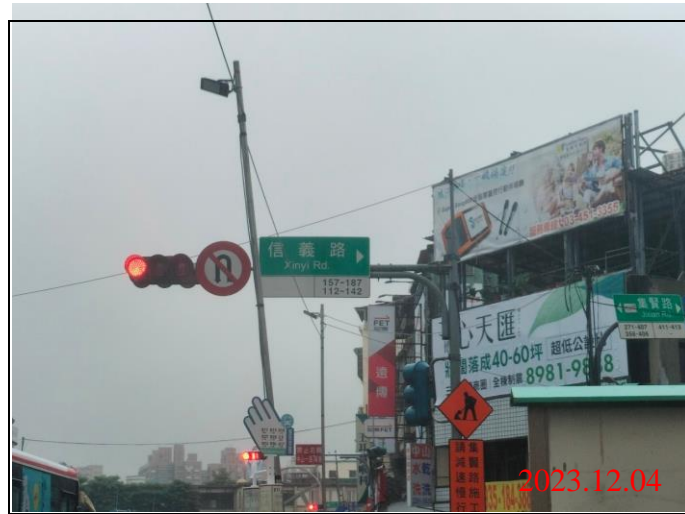
巡查日期地點：112.12.04/ Y21車站 照片說明：牌面設置狀況