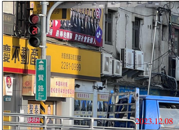
巡查日期地點：112.12.08/ Y21車站 照片說明：牌面設置狀況