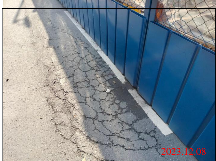
巡查日期地點：112.12.08/ Y23車站 照片說明：路面龜裂狀況