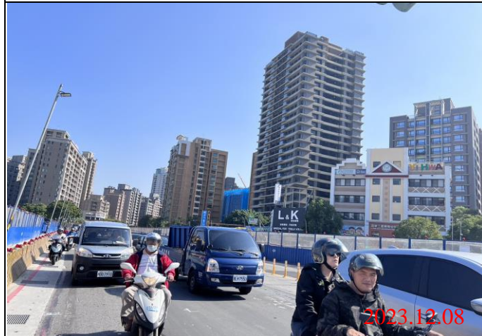
巡查日期地點：112.12.08/ Y22車站 照片說明：路面狀況