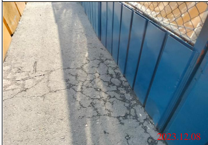
巡查日期地點：112.12.08/ Y23車站 照片說明：路面龜裂狀況