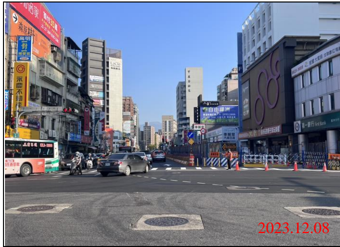
巡查日期地點：112.12.08/ Y21車站 照片說明：路面狀況