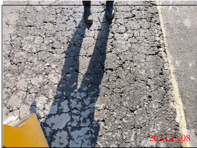
巡查日期地點：112.12.08/ Y23車站 照片說明：路面龜裂狀況