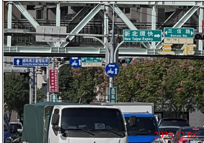
巡查日期地點：112.12.08/ Y23車站 照片說明：牌面設置狀況