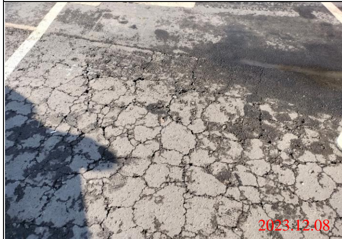
巡查日期地點：112.12.08/ Y23車站 照片說明：路面龜裂狀況