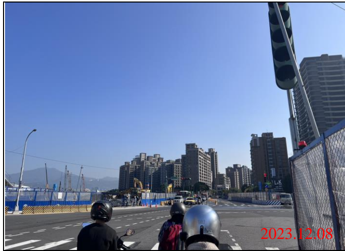
巡查日期地點：112.12.08/ Y22車站 照片說明：路面狀況