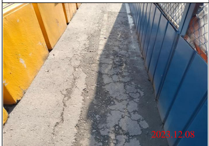
巡查日期地點：112.12.08/ Y23車站 照片說明：路面龜裂狀況