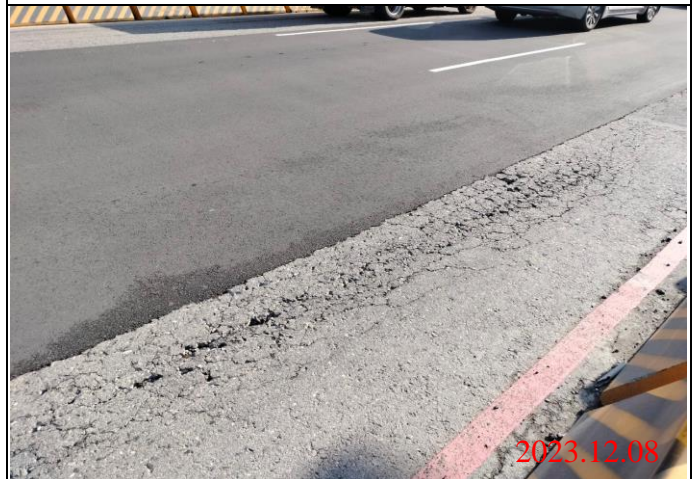
巡查日期地點：112.12.08/ Y23車站 照片說明：路面龜裂狀況