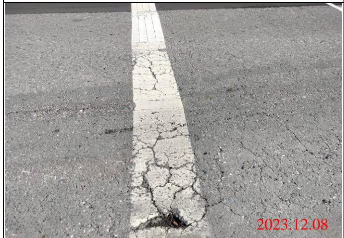
巡查日期地點：112.12.08/ Y23車站 照片說明：路面龜裂狀況