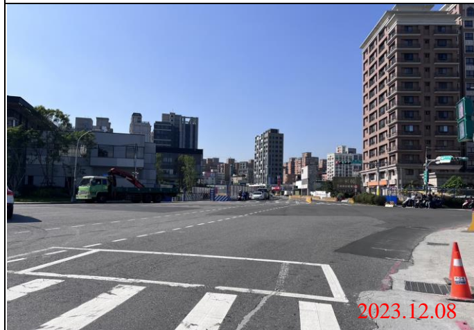
巡查日期地點：112.12.08/ Y22車站 照片說明：路面狀況