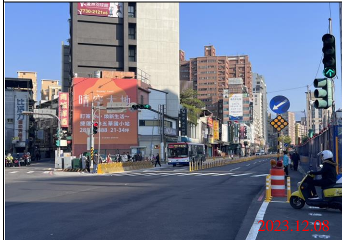
巡查日期地點：112.12.08/ Y21車站 照片說明：路面狀況