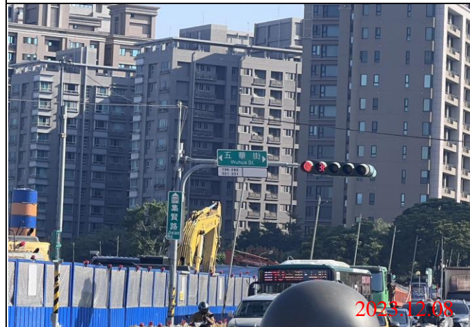
巡查日期地點：112.12.08/ Y22車站 照片說明：牌面設置狀況