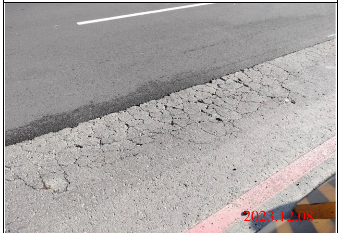
巡查日期地點：112.12.08/ Y23車站 照片說明：路面龜裂狀況