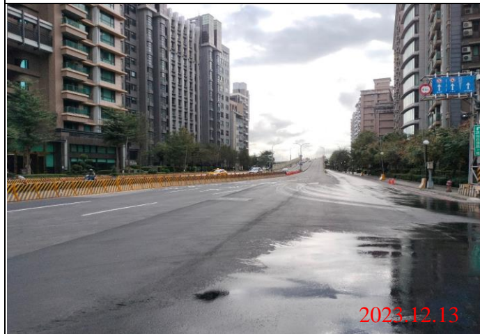
巡查日期地點：112.12.13/ Y23車站 照片說明：路面狀況