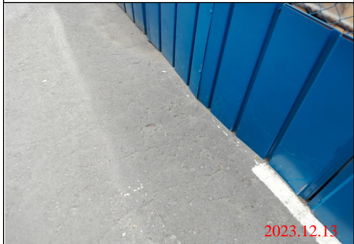
巡查日期地點：112.12.13/ Y23車站 照片說明：路面龜裂狀況