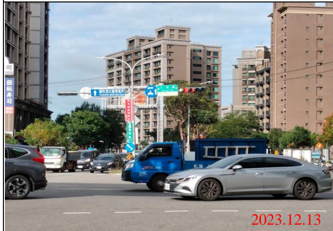
巡查日期地點：112.12.13/ Y23車站 照片說明：牌面設置狀況