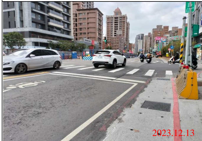
巡查日期地點：112.12.13/ Y22車站 照片說明：路面狀況