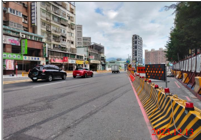
巡查日期地點：112.12.13/ Y22車站 照片說明：路面狀況