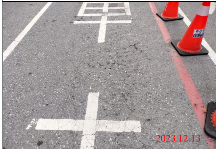
巡查日期地點：112.12.13/ Y23車站 照片說明：路面龜裂狀況