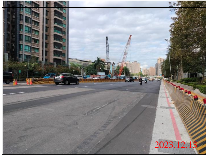
巡查日期地點：112.12.13/ Y23車站 照片說明：路面狀況