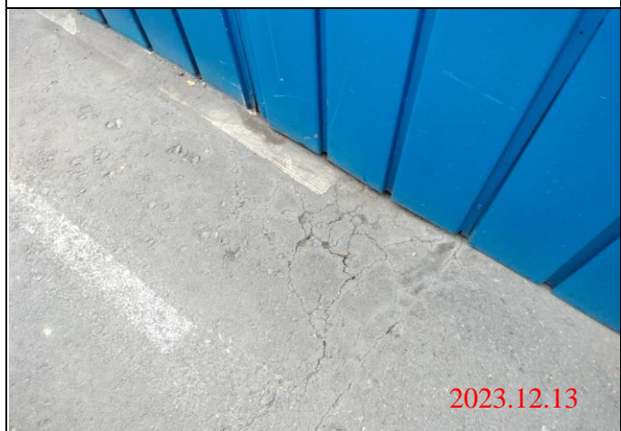
巡查日期地點：112.12.13/ Y23車站 照片說明：路面龜裂狀況