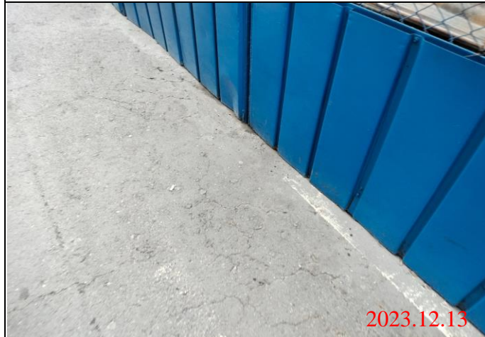
巡查日期地點：112.12.13/ Y23車站 照片說明：路面龜裂狀況