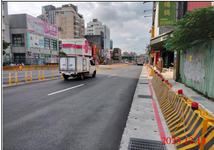
巡查日期地點：112.12.13/ Y21車站 照片說明：路面狀況