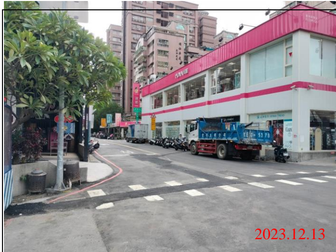
巡查日期地點：112.12.13/ Y21車站 照片說明：路面狀況