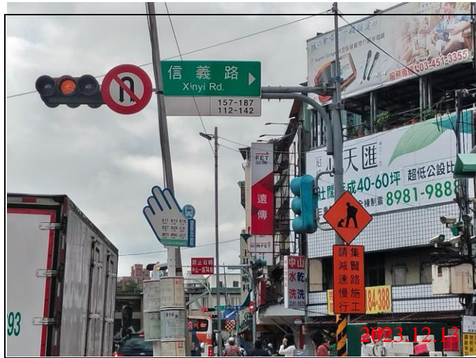
巡查日期地點：112.12.13/ Y21車站 照片說明：牌面設置狀況