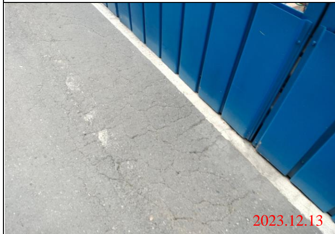
巡查日期地點：112.12.13/ Y23車站 照片說明：路面龜裂狀況