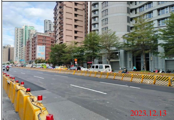
巡查日期地點：112.12.13/ Y23車站 照片說明：路面狀況