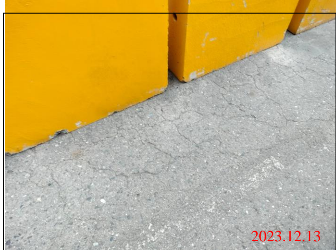
巡查日期地點：112.12.13/ Y23車站 照片說明：路面龜裂狀況