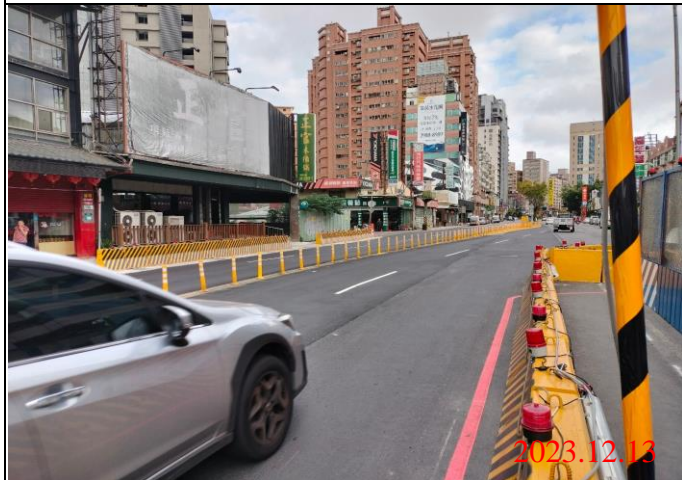
巡查日期地點：112.12.13/ Y21車站 照片說明：路面狀況