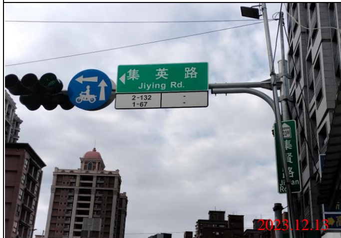
巡查日期地點：112.12.13/ Y22車站 照片說明：牌面設置狀況