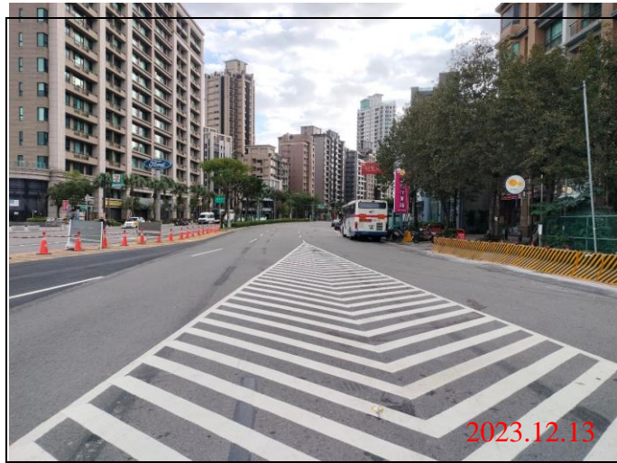
巡查日期地點：112.12.13/ Y22車站 照片說明：路面狀況