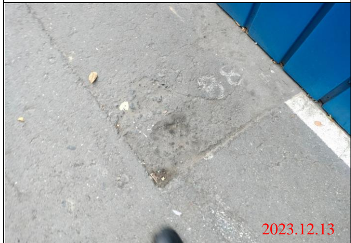
巡查日期地點：112.12.13/ Y23車站 照片說明：路面龜裂狀況