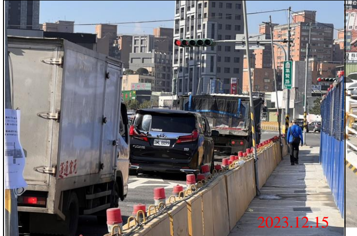
巡查日期地點：112.12.15/ Y22車站 照片說明：路面狀況