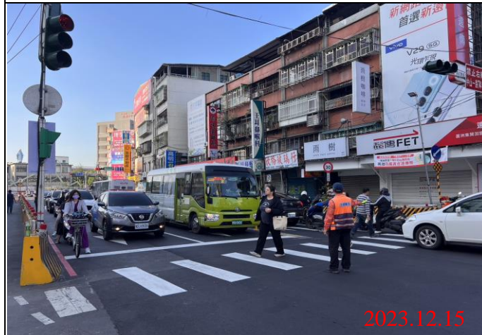
巡查日期地點：112.12.15/ Y21車站 照片說明：路面狀況