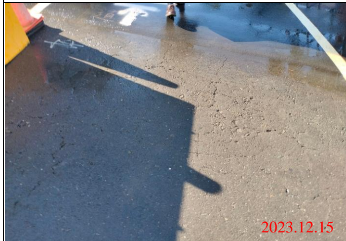
巡查日期地點：112.12.15/ Y23車站 照片說明：路面龜裂狀況