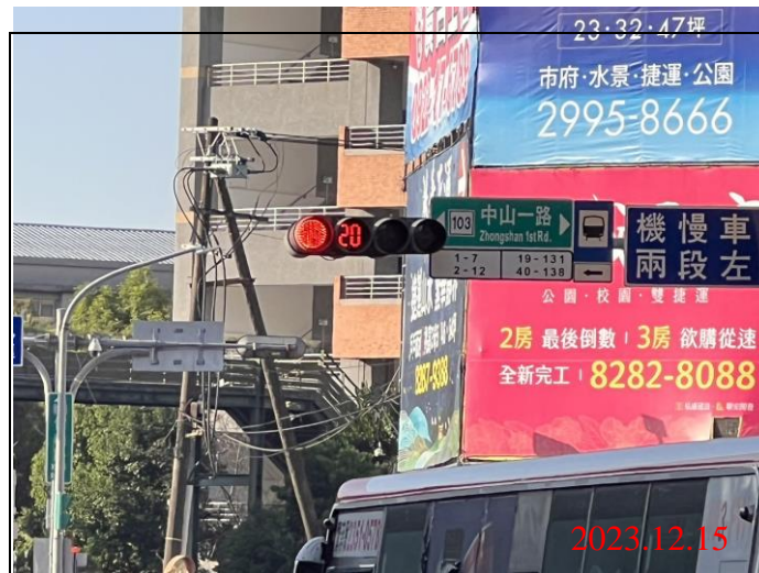
巡查日期地點：112.12.15/ Y21車站 照片說明：牌面設置狀況