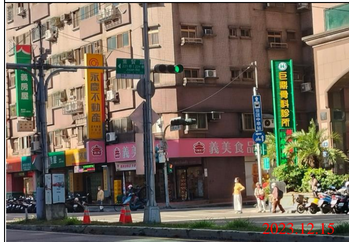
巡查日期地點：112.12.15/ Y22車站 照片說明：牌面設置狀況