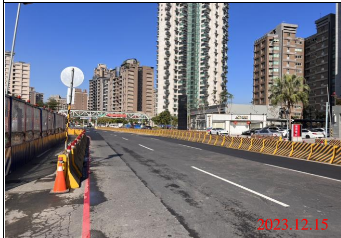
巡查日期地點：112.12.15/ Y23車站 照片說明：路面狀況