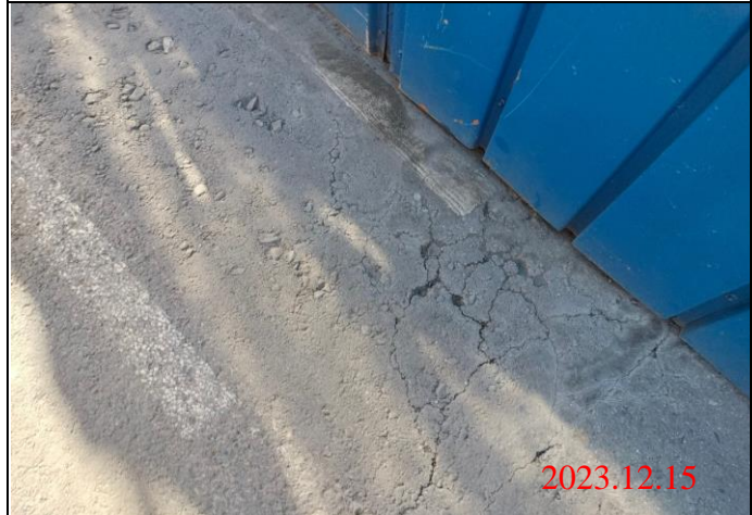
巡查日期地點：112.12.15/ Y23車站 照片說明：路面龜裂狀況