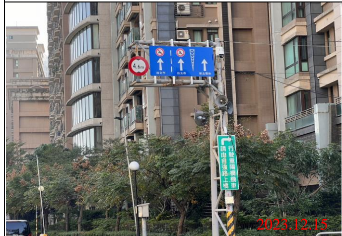
巡查日期地點：112.12.15/ Y23車站 照片說明：牌面設置狀況