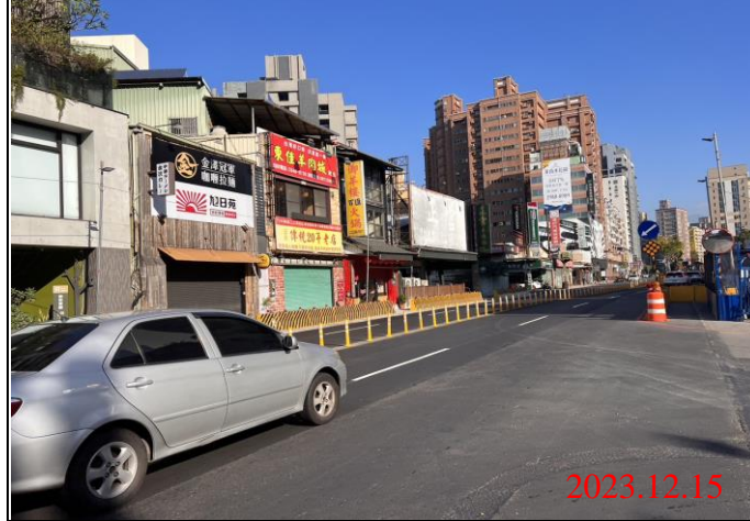
巡查日期地點：112.12.15/ Y21車站 照片說明：路面狀況