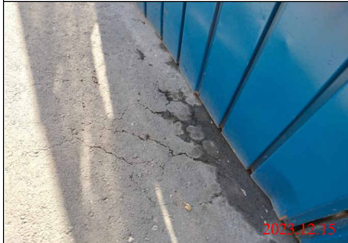
巡查日期地點：112.12.15/ Y23車站 照片說明：路面龜裂狀況