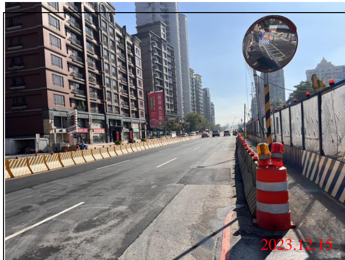
巡查日期地點：112.12.15/ Y23車站 照片說明：路面狀況