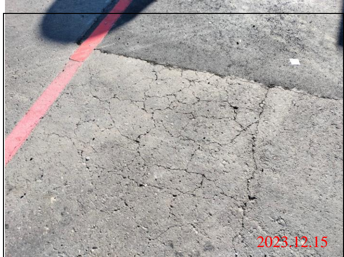
巡查日期地點：112.12.15/ Y23車站 照片說明：路面龜裂狀況