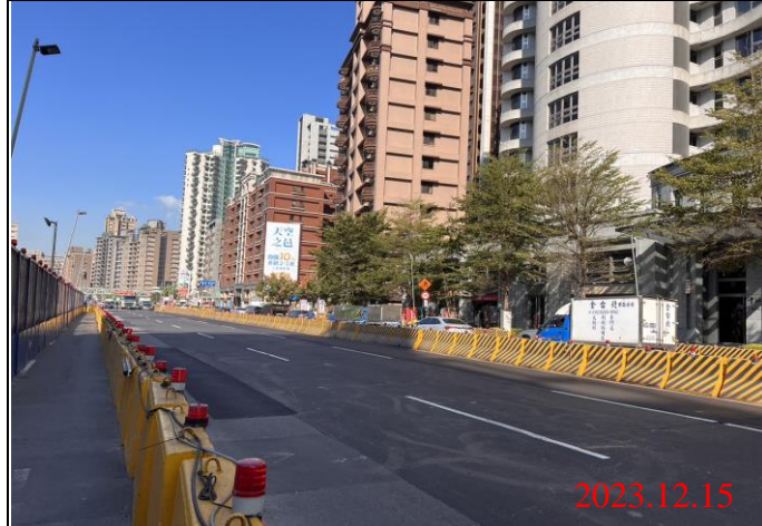
巡查日期地點：112.12.15/ Y23車站 照片說明：路面狀況