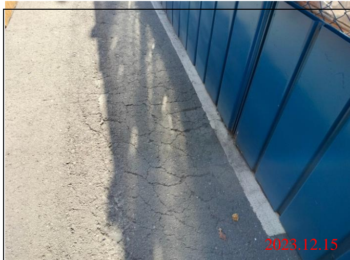
巡查日期地點：112.12.15/ Y23車站 照片說明：路面龜裂狀況