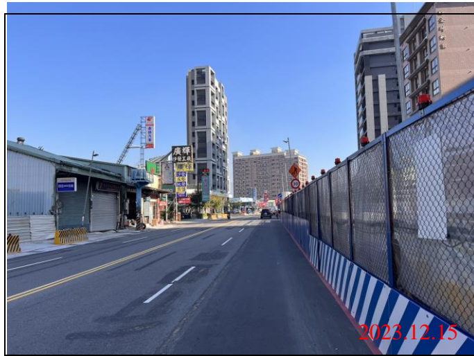
巡查日期地點：112.12.15/ Y22車站 照片說明：路面狀況