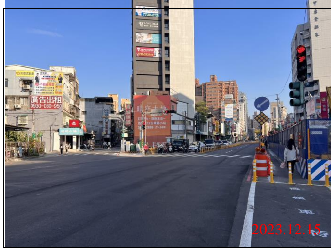
巡查日期地點：112.12.15/ Y21車站 照片說明：路面狀況