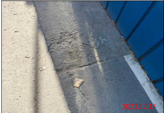
巡查日期地點：112.12.15/ Y23車站 照片說明：路面龜裂狀況