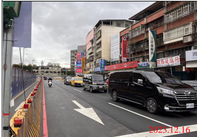
巡查日期地點：112.12.16/ Y21車站 照片說明：路面狀況