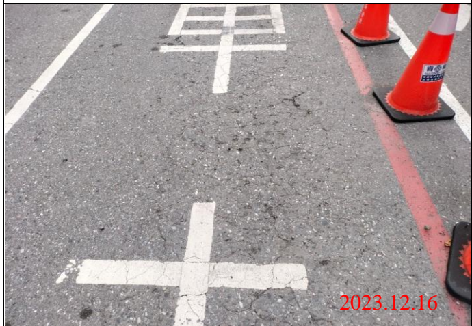
巡查日期地點：112.12.16/ Y23車站 照片說明：路面龜裂狀況