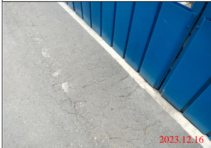
巡查日期地點：112.12.16/ Y23車站 照片說明：路面龜裂狀況