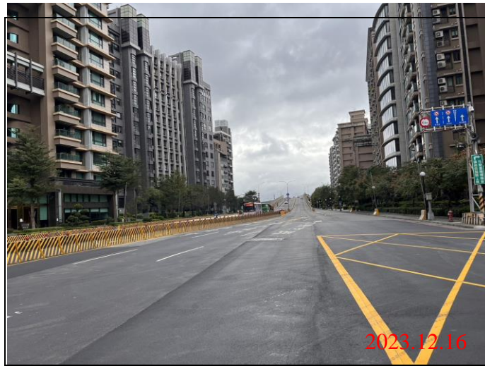
巡查日期地點：112.12.16/ Y23車站 照片說明：路面狀況