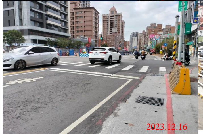
巡查日期地點：112.12.16/ Y22車站 照片說明：路面狀況