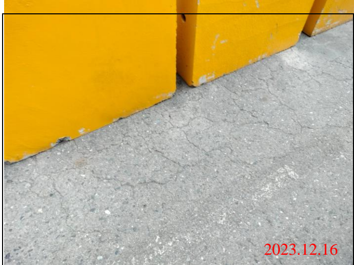
巡查日期地點：112.12.16/ Y23車站 照片說明：路面龜裂狀況