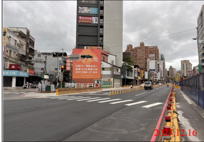
巡查日期地點：112.12.16/ Y21車站 照片說明：路面狀況