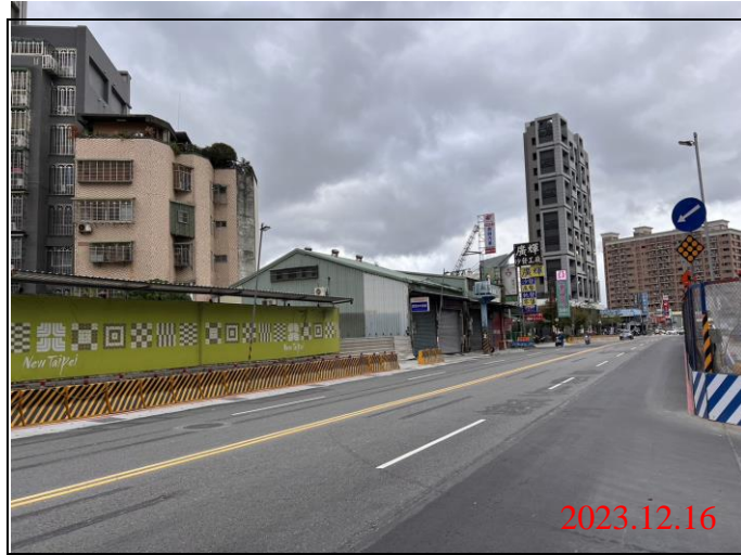
巡查日期地點：112.12.16/ Y22車站 照片說明：路面狀況