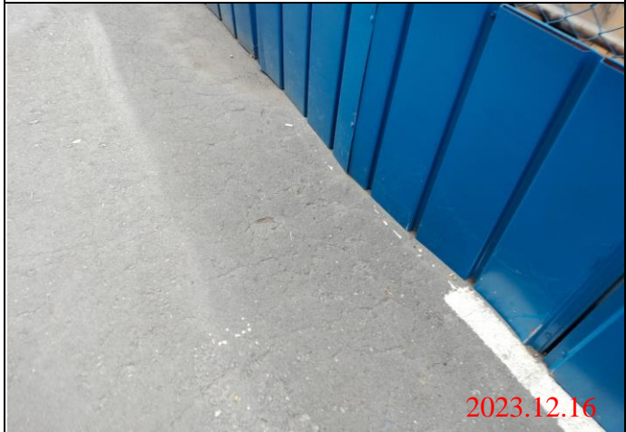
巡查日期地點：112.12.16/ Y23車站 照片說明：路面龜裂狀況