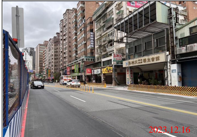
巡查日期地點：112.12.16/ Y22車站 照片說明：路面狀況