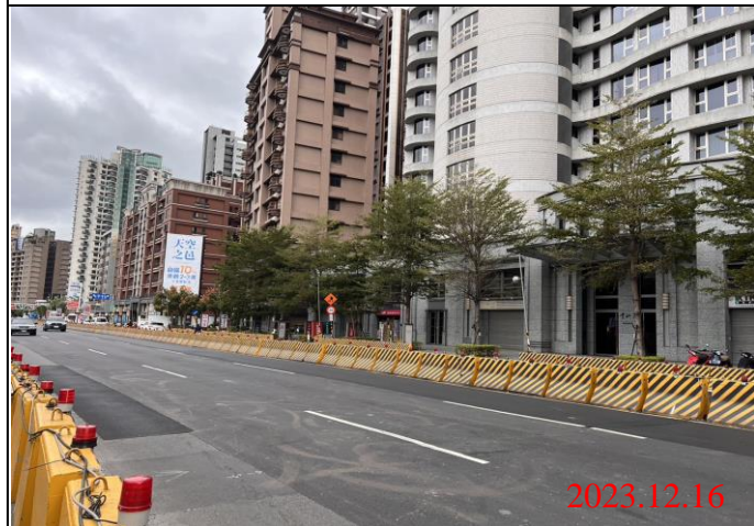
巡查日期地點：112.12.16/ Y23車站 照片說明：路面狀況