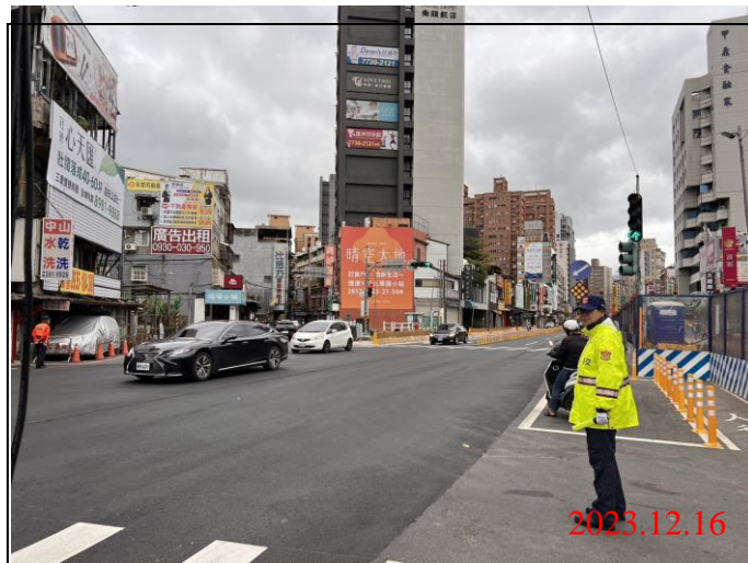
巡查日期地點：112.12.16/ Y21車站 照片說明：路面狀況