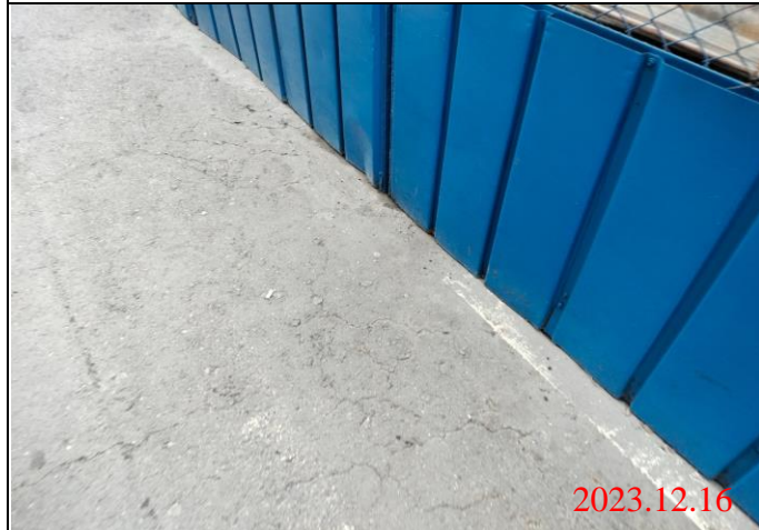
巡查日期地點：112.12.16/ Y23車站 照片說明：路面龜裂狀況