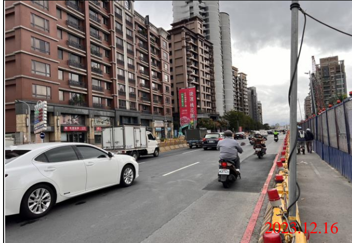
巡查日期地點：112.12.16/ Y23車站 照片說明：路面狀況