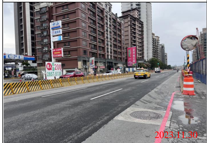
巡查日期地點：112.11.30/ Y23車站 照片說明：路面狀況