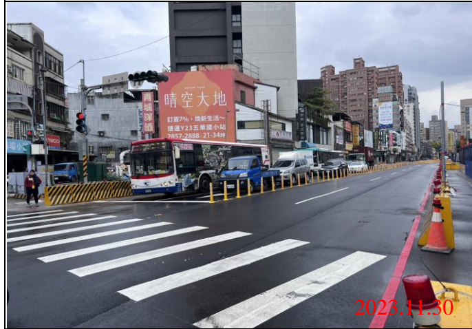
巡查日期地點：112.11.30/ Y21車站 照片說明：路面狀況