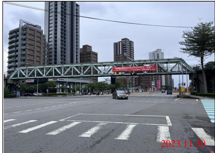
巡查日期地點：112.11.30/ Y23車站 照片說明：路面狀況