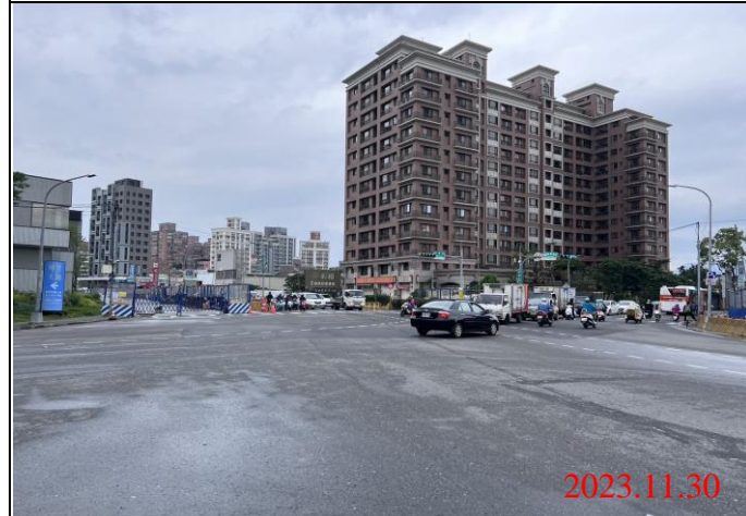
巡查日期地點：112.11.30/ Y22車站 照片說明：路面狀況