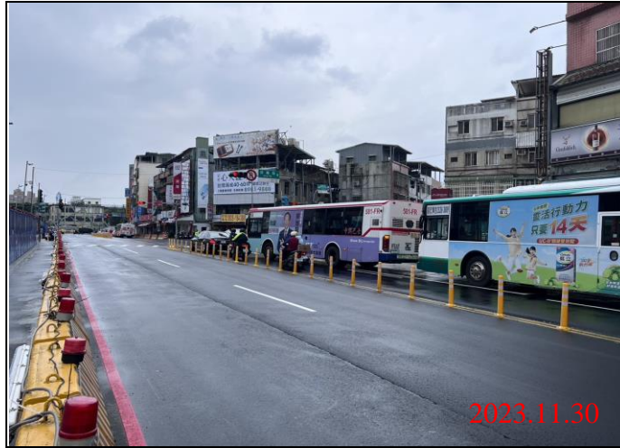
巡查日期地點：112.11.30/ Y21車站 照片說明：路面狀況