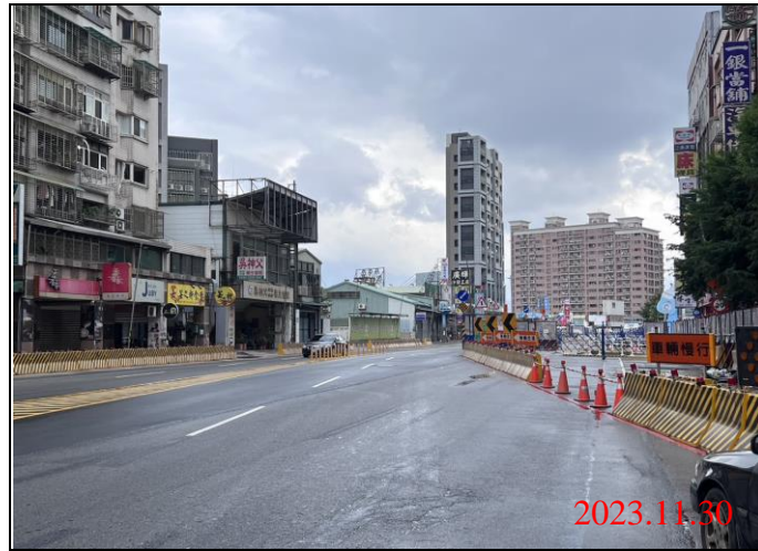
巡查日期地點：112.11.30/ Y22車站 照片說明：路面狀況