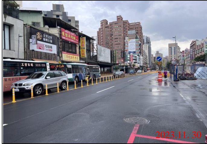
巡查日期地點：112.11.30/ Y21車站 照片說明：路面狀況