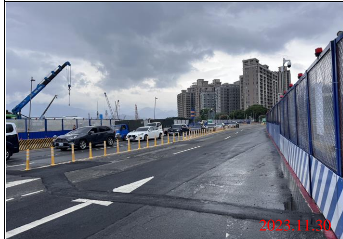
巡查日期地點：112.11.30/ Y22車站 照片說明：路面狀況