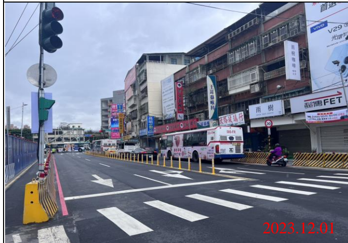
巡查日期地點：112.12.01/ Y21車站 照片說明：路面狀況