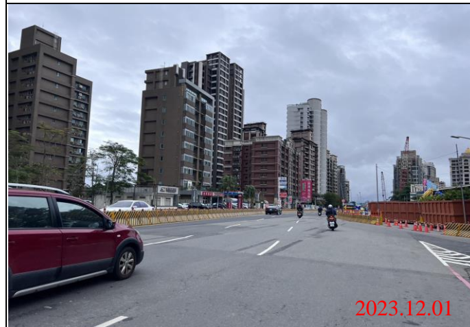
巡查日期地點：112.12.01/ Y23車站 照片說明：路面狀況