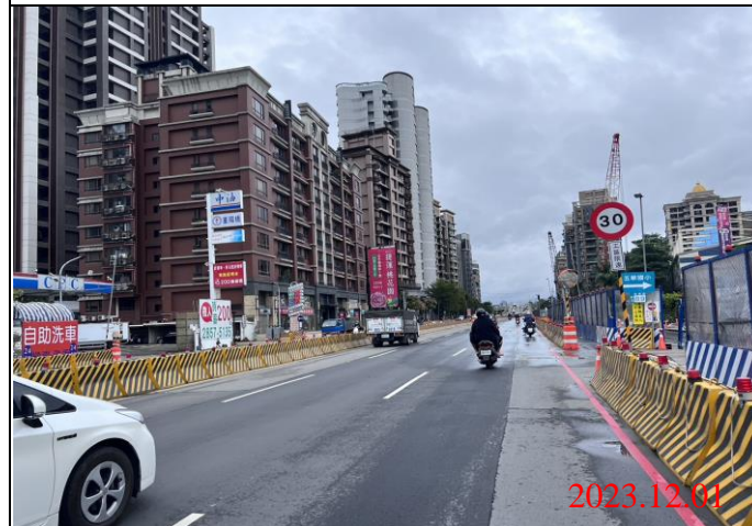
巡查日期地點：112.12.01/ Y23車站 照片說明：路面狀況