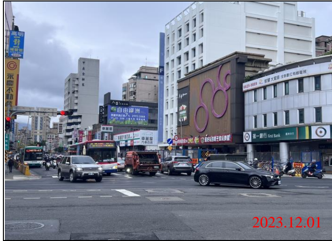
巡查日期地點：112.12.01/ Y21車站 照片說明：路面狀況