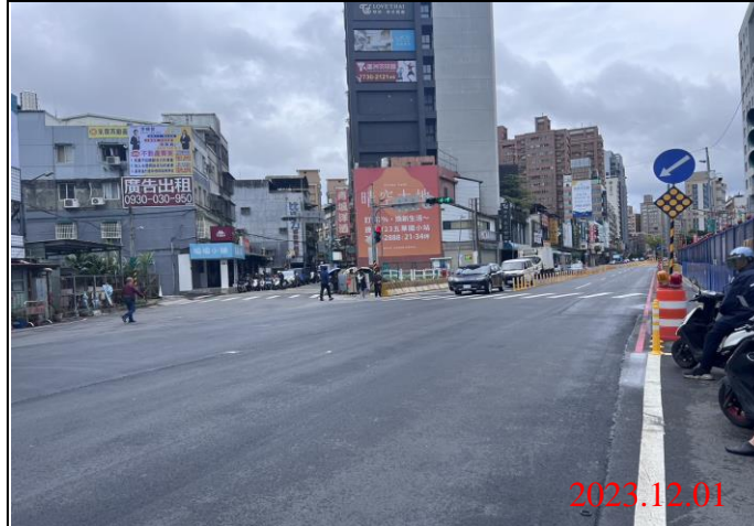
巡查日期地點：112.12.01/ Y21車站 照片說明：路面狀況