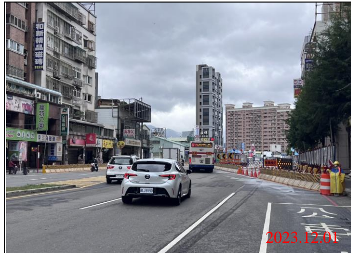
巡查日期地點：112.12.01/ Y22車站 照片說明：路面狀況