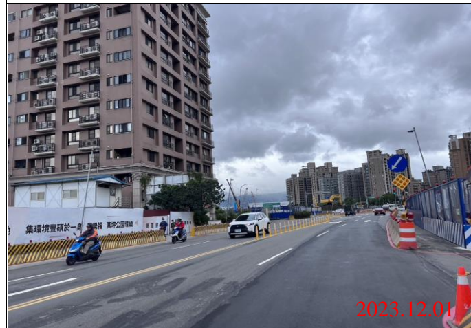
巡查日期地點：112.12.01/ Y22車站 照片說明：路面狀況