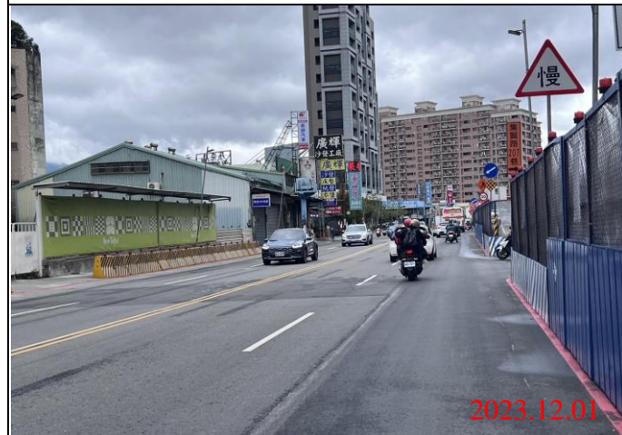
巡查日期地點：112.12.01/ Y22車站 照片說明：路面狀況