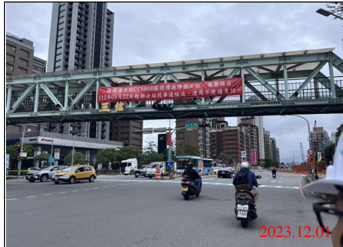
巡查日期地點：112.12.01/ Y23車站 照片說明：路面狀況