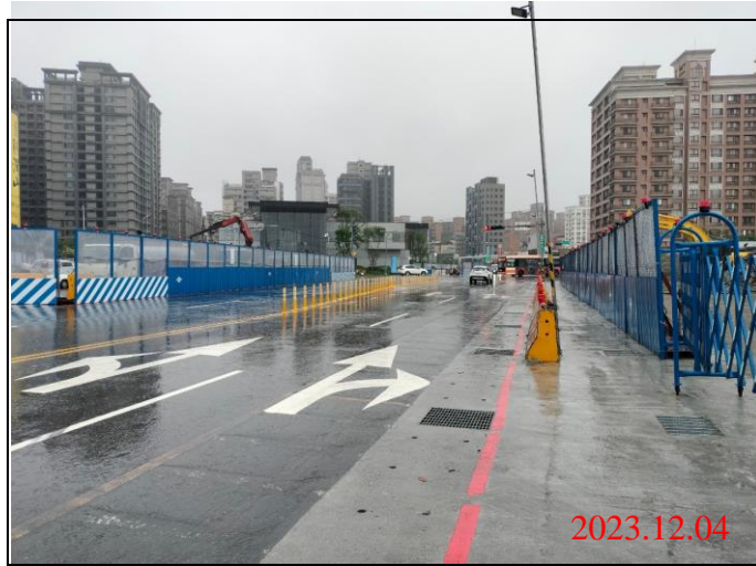
巡查日期地點：112.12.04/ Y22車站 照片說明：路面狀況