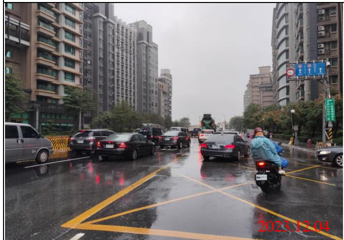
巡查日期地點：112.12.04/ Y23車站 照片說明：路面狀況