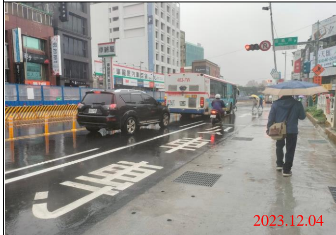
巡查日期地點：112.12.04/ Y21車站 照片說明：路面狀況