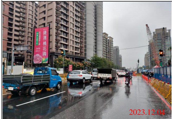
巡查日期地點：112.12.04/ Y23車站 照片說明：路面狀況