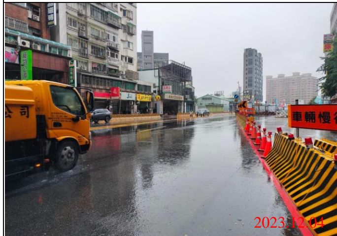
巡查日期地點：112.12.04/ Y22車站 照片說明：路面狀況