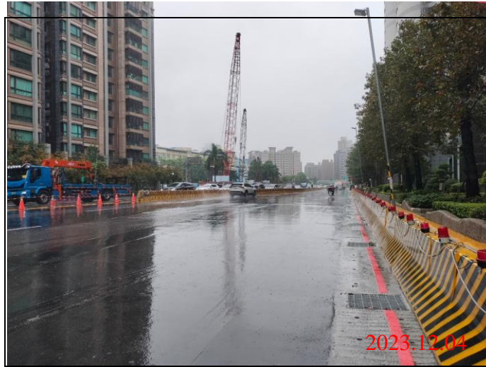
巡查日期地點：112.12.04/ Y23車站 照片說明：路面狀況