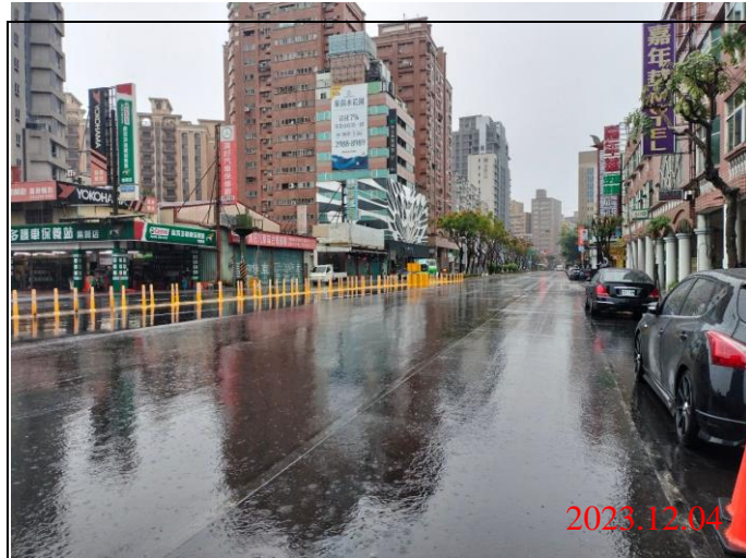
巡查日期地點：112.12.04/ Y21車站 照片說明：路面狀況