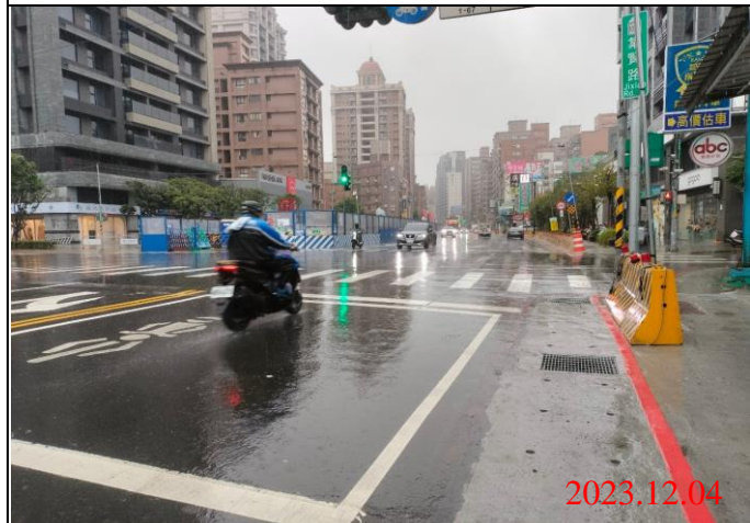
巡查日期地點：112.12.04/ Y22車站 照片說明：路面狀況