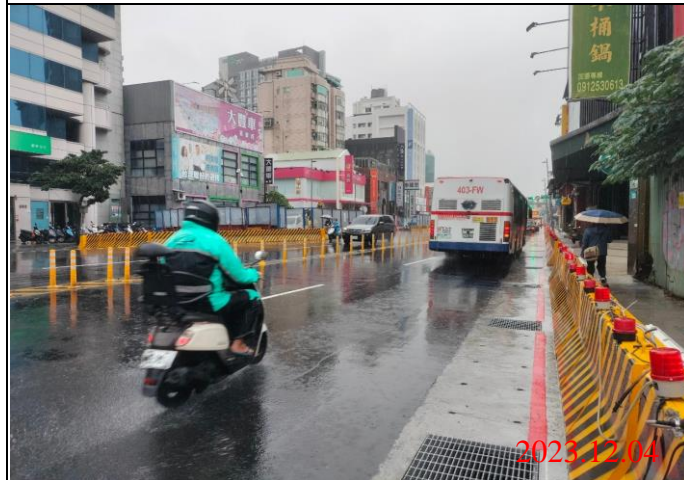
巡查日期地點：112.12.04/ Y21車站 照片說明：路面狀況