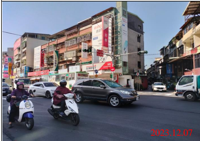
巡查日期地點：112.12.07/ Y21車站 照片說明：路面狀況