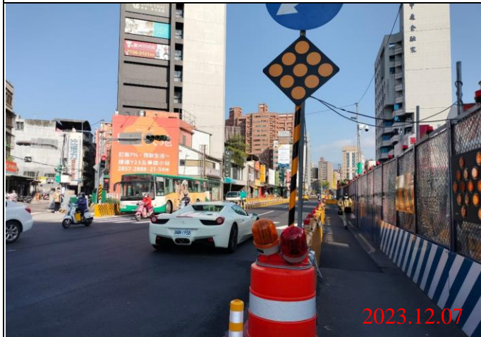
巡查日期地點：112.12.07/ Y21車站 照片說明：路面狀況