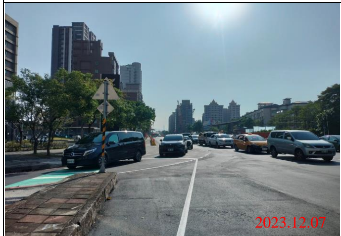
巡查日期地點：112.12.07/ Y23車站 照片說明：路面狀況