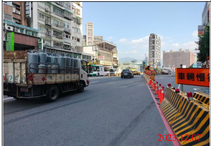
巡查日期地點：112.12.07/ Y22車站 照片說明：路面狀況