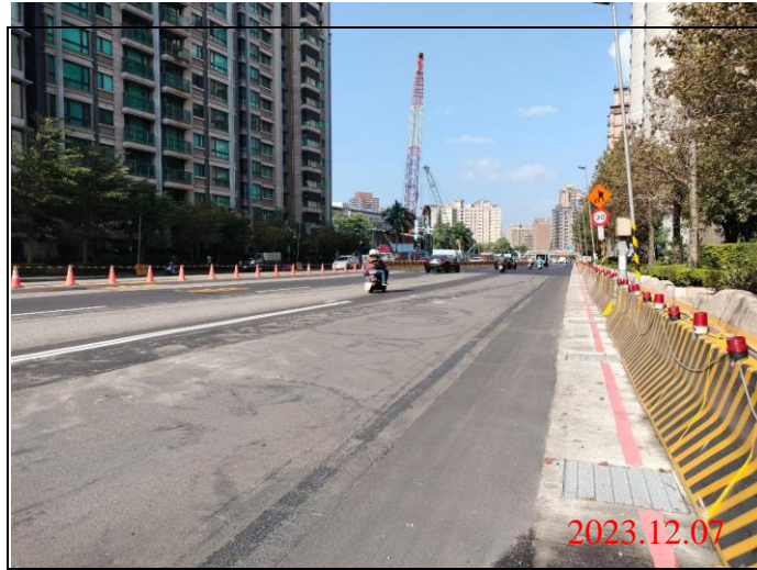
巡查日期地點：112.12.07/ Y23車站 照片說明：路面狀況