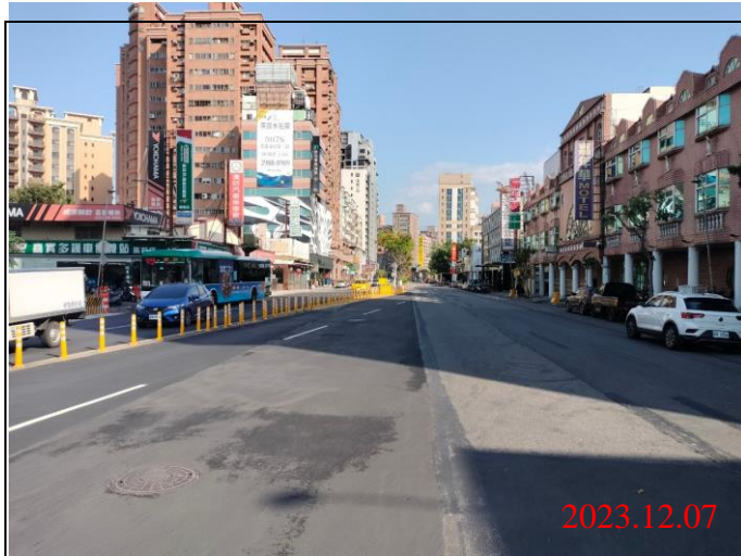
巡查日期地點：112.12.07/ Y21車站 照片說明：路面狀況