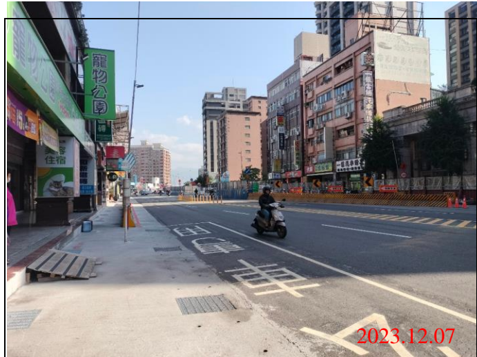
巡查日期地點：112.12.07/ Y22車站 照片說明：路面狀況