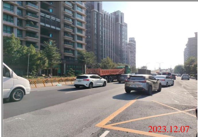
巡查日期地點：112.12.07/ Y23車站 照片說明：路面狀況