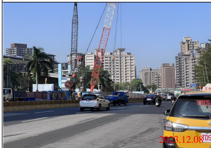
巡查日期地點：112.12.08/ Y23車站 照片說明：路面狀況