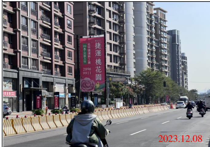
巡查日期地點：112.12.08/ Y23車站 照片說明：路面狀況