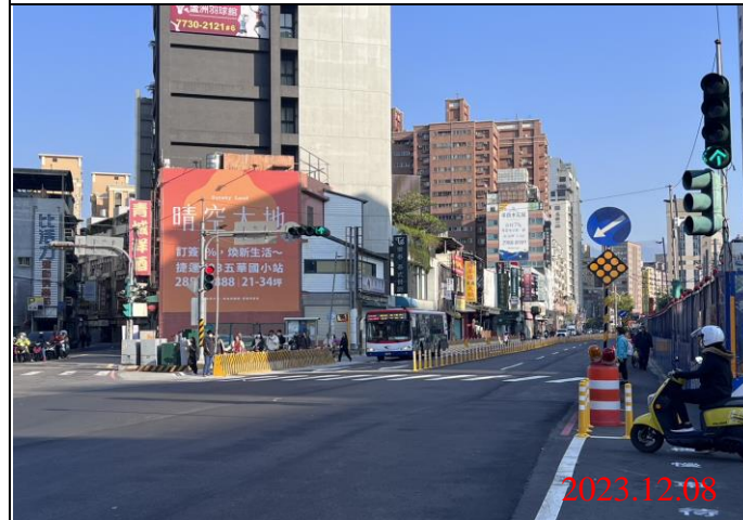
巡查日期地點：112.12.08/ Y21車站 照片說明：路面狀況