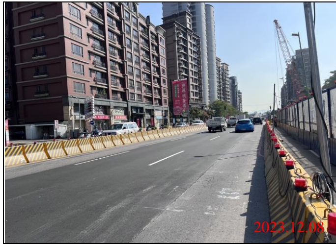
巡查日期地點：112.12.08/ Y23車站 照片說明：路面狀況