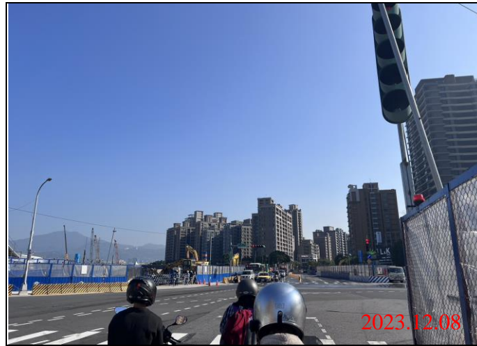
巡查日期地點：112.12.08/ Y22車站 照片說明：路面狀況