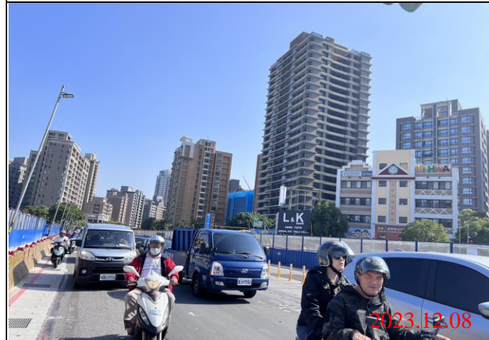
巡查日期地點：112.12.08/ Y22車站 照片說明：路面狀況