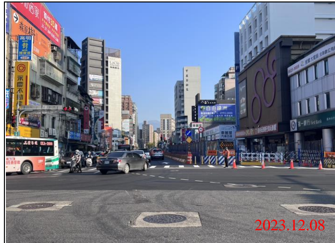
巡查日期地點：112.12.08/ Y21車站 照片說明：路面狀況