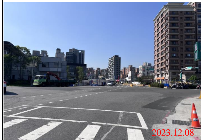
巡查日期地點：112.12.08/ Y22車站 照片說明：路面狀況