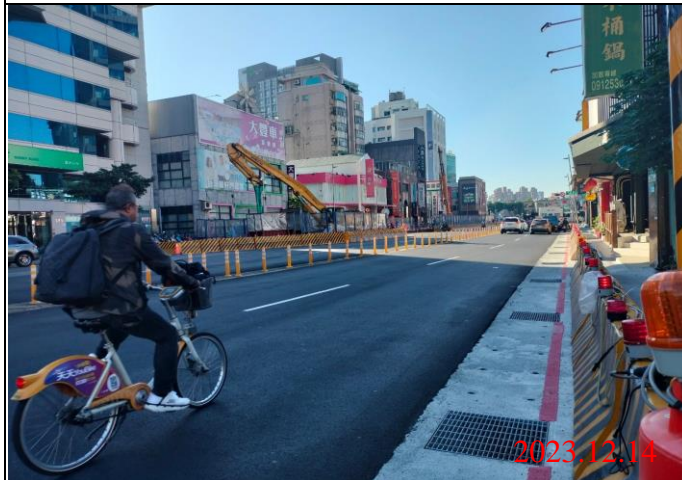
巡查日期地點：112.12.14/ Y21車站 照片說明：路面狀況