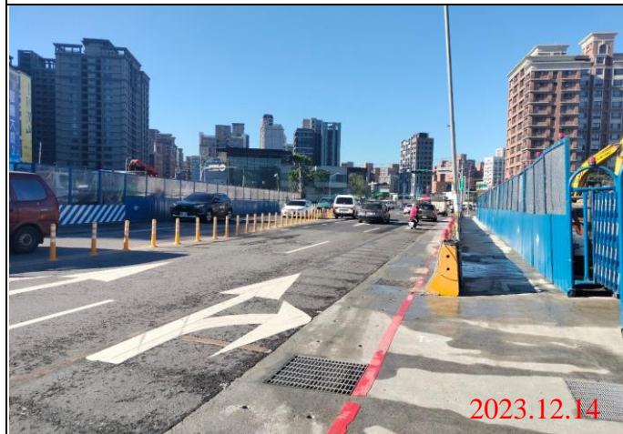
巡查日期地點：112.12.14/ Y22車站 照片說明：路面狀況