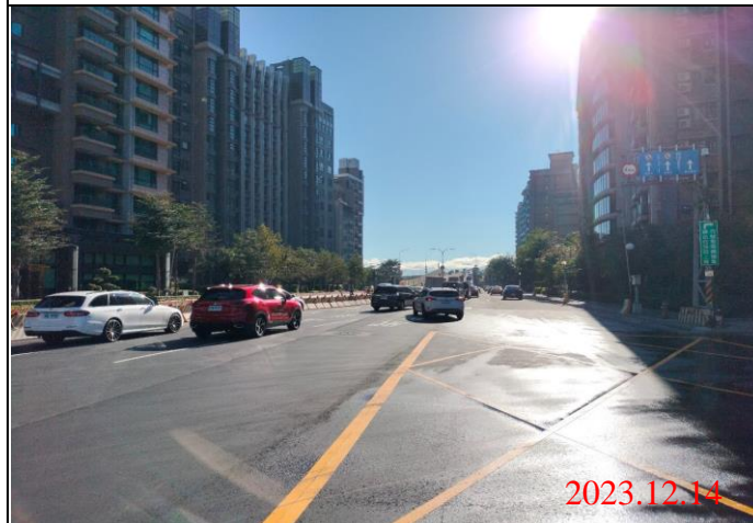
巡查日期地點：112.12.14/ Y23車站 照片說明：路面狀況