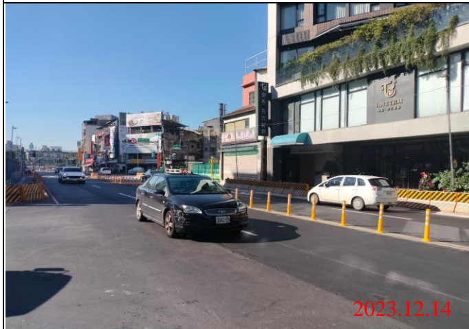
巡查日期地點：112.12.14/ Y21車站 照片說明：路面狀況