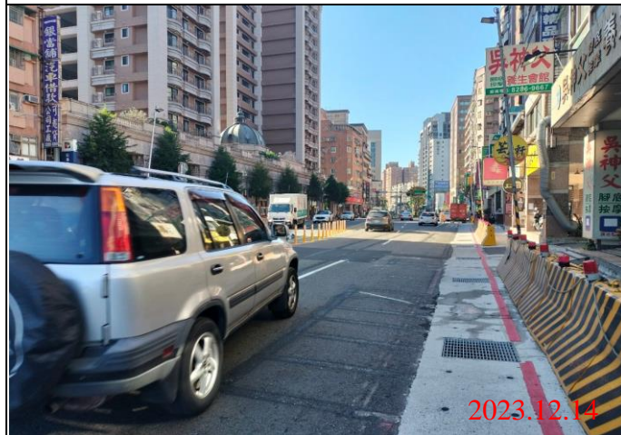
巡查日期地點：112.12.14/ Y22車站 照片說明：路面狀況