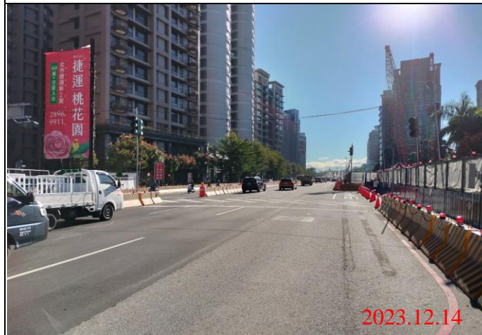
巡查日期地點：112.12.14/ Y23車站 照片說明：路面狀況