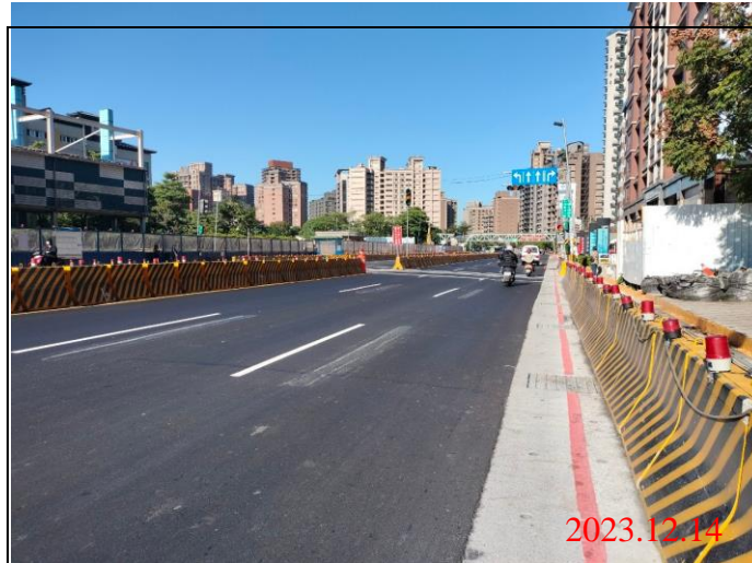
巡查日期地點：112.12.14/ Y23車站 照片說明：路面狀況