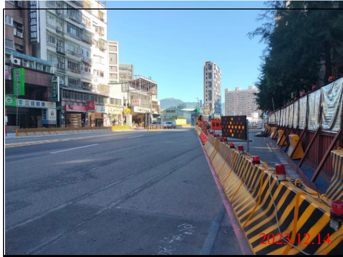
巡查日期地點：112.12.14/ Y22車站 照片說明：路面狀況