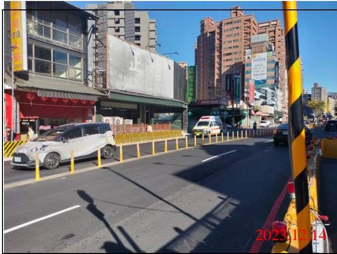
巡查日期地點：112.12.14/ Y21車站 照片說明：路面狀況