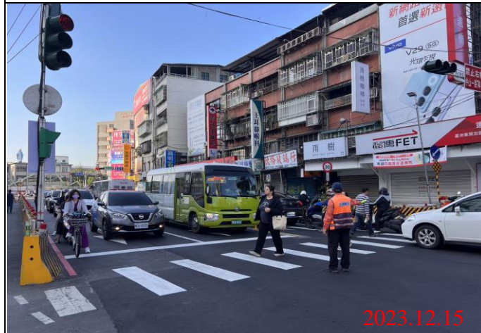
巡查日期地點：112.12.15/ Y21車站 照片說明：路面狀況