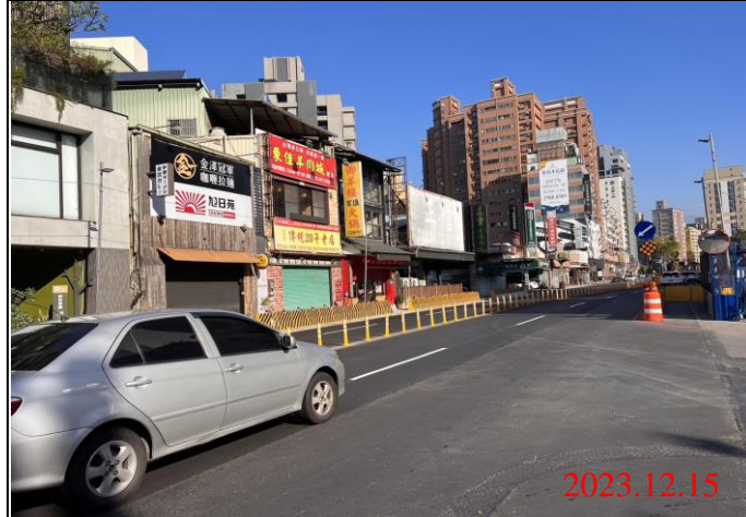
巡查日期地點：112.12.15/ Y21車站 照片說明：路面狀況