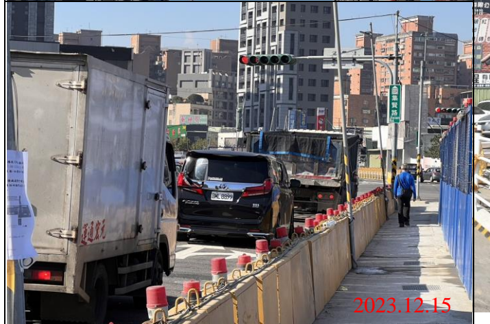
巡查日期地點：112.12.15/ Y22車站 照片說明：路面狀況