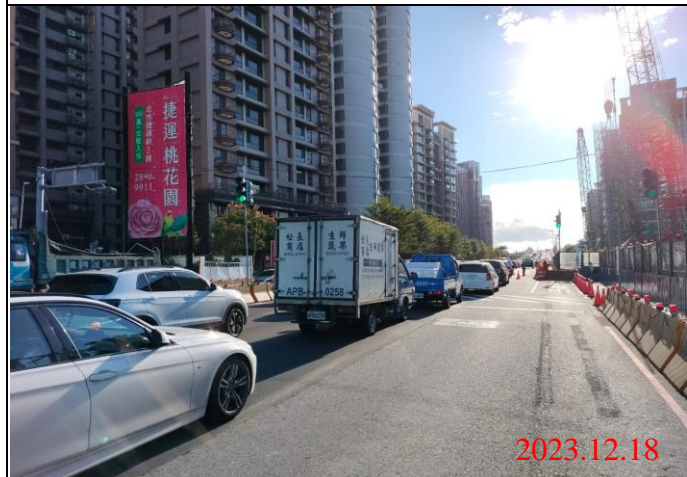
巡查日期地點：112.12.18/ Y23車站 照片說明：路面狀況