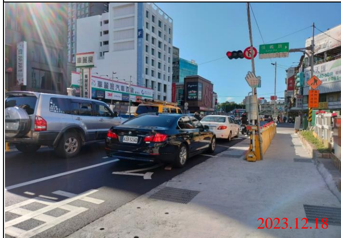
巡查日期地點：112.12.18/ Y21車站 照片說明：路面狀況