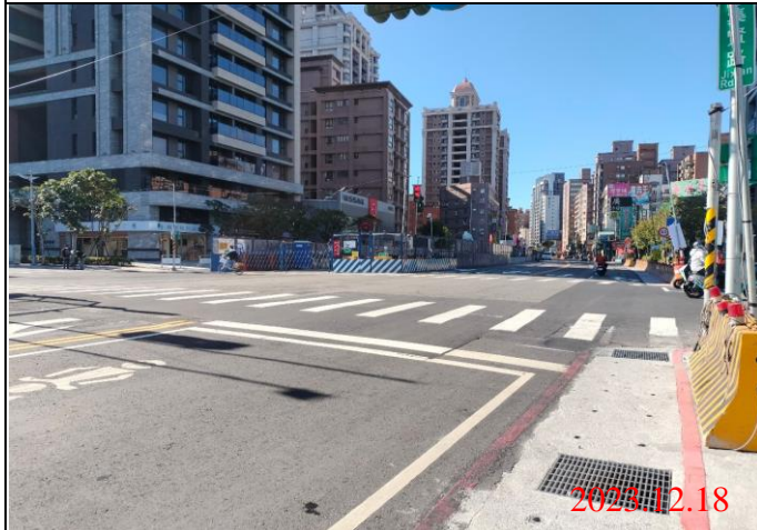
巡查日期地點：112.12.18/ Y22車站 照片說明：路面狀況