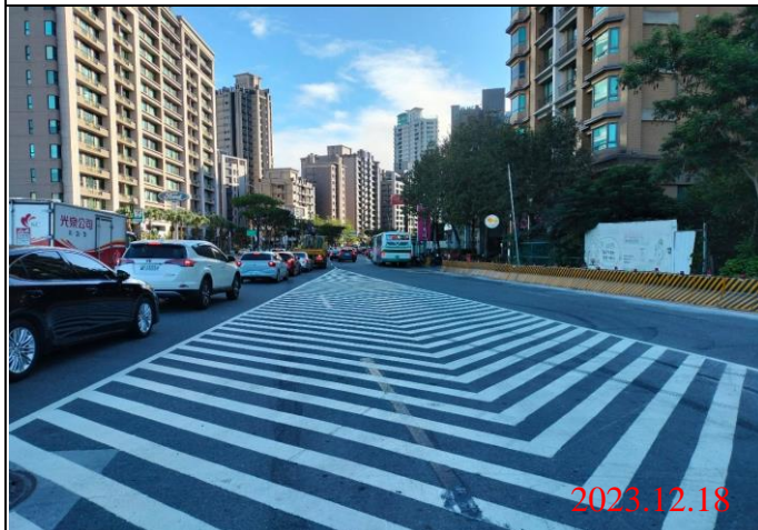
巡查日期地點：112.12.18/ Y22車站 照片說明：路面狀況