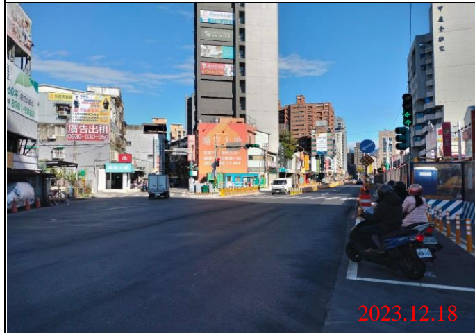
巡查日期地點：112.12.18/ Y21車站 照片說明：路面狀況