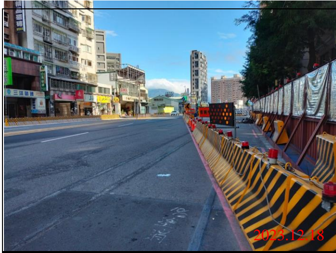
巡查日期地點：112.12.18/ Y22車站 照片說明：路面狀況