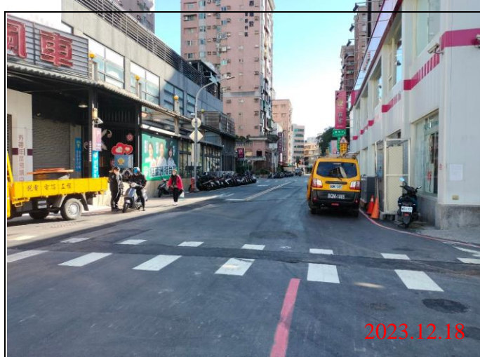
巡查日期地點：112.12.18/ Y21車站 照片說明：路面狀況