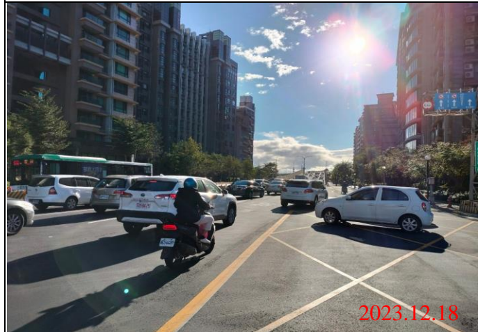
巡查日期地點：112.12.18/ Y23車站 照片說明：路面狀況