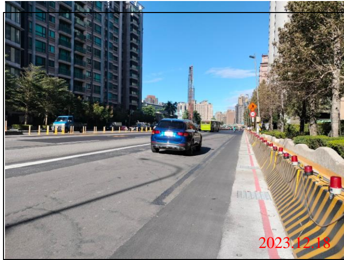
巡查日期地點：112.12.18/ Y23車站 照片說明：路面狀況