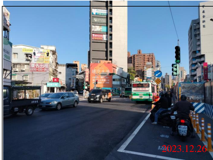
巡查日期地點：112.12.26/ Y21車站 照片說明：路面狀況