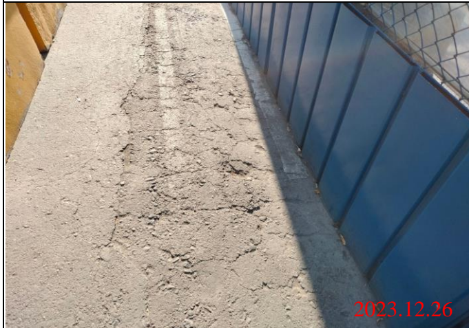
巡查日期地點：112.12.26/ Y23車站 照片說明：路面龜裂狀況