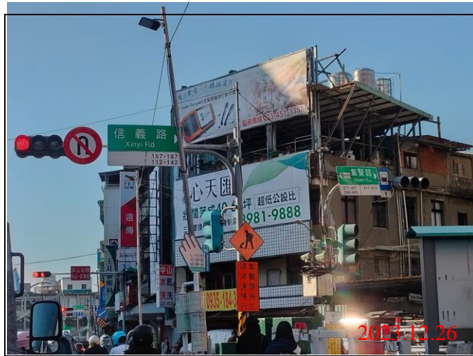
巡查日期地點：112.12.26/ Y21車站 照片說明：牌面設置狀況