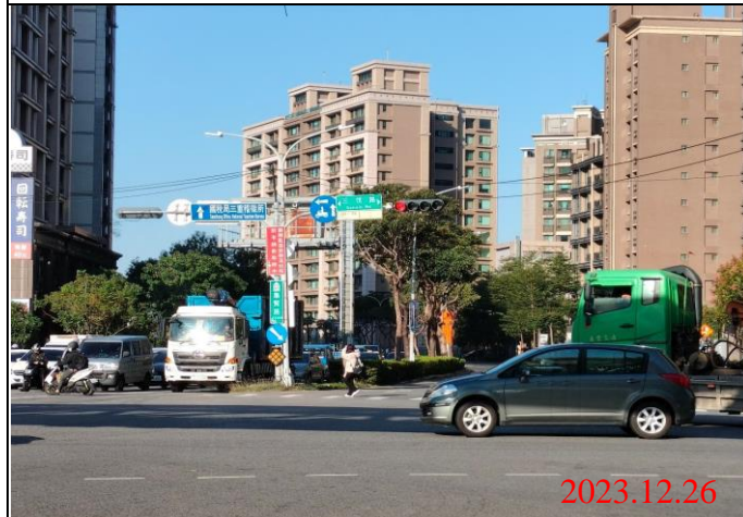
巡查日期地點：112.12.26/ Y23車站 照片說明：牌面設置狀況