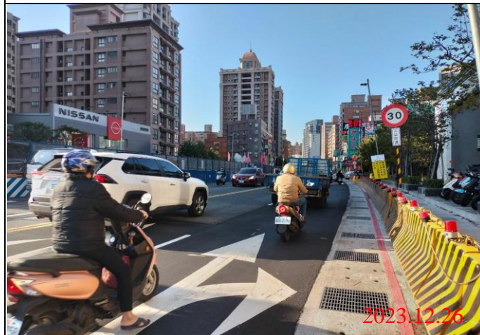
巡查日期地點：112.12.26/ Y22車站 照片說明：路面狀況