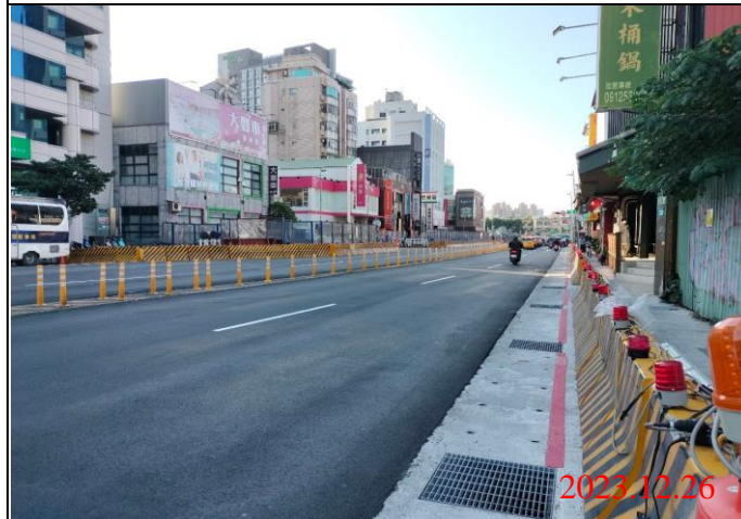
巡查日期地點：112.12.26/ Y21車站 照片說明：路面狀況