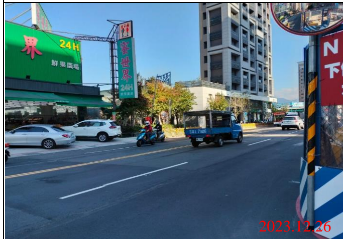
巡查日期地點：112.12.26/ Y22車站 照片說明：路面狀況