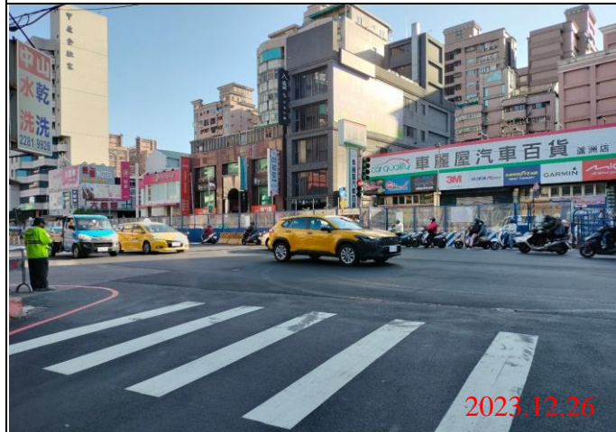
巡查日期地點：112.12.26/ Y21車站 照片說明：路面狀況