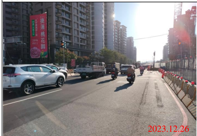
巡查日期地點：112.12.26/ Y23車站 照片說明：路面狀況