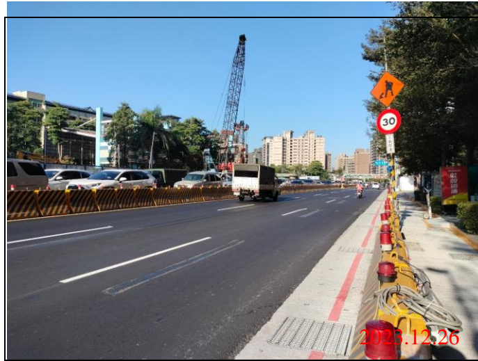
巡查日期地點：112.12.26/ Y23車站 照片說明：路面狀況