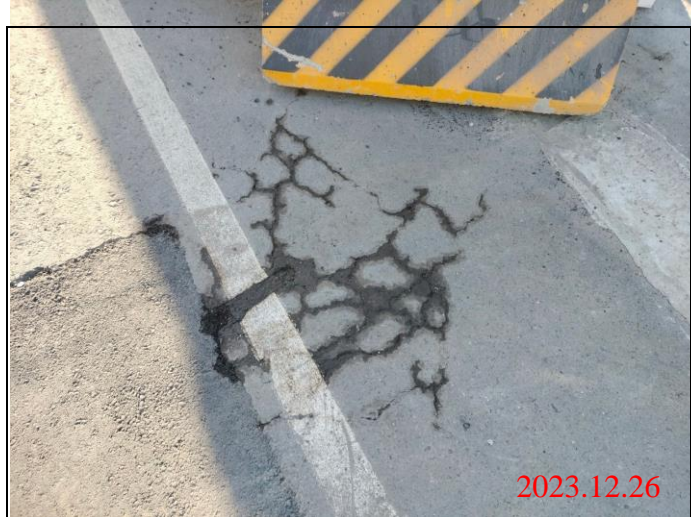
巡查日期地點：112.12.26/ Y23車站 照片說明：路面龜裂狀況