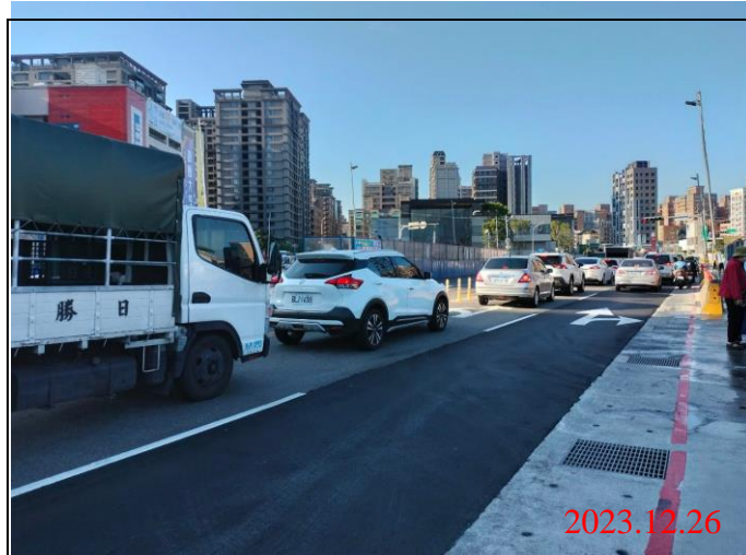
巡查日期地點：112.12.26/ Y22車站 照片說明：路面狀況