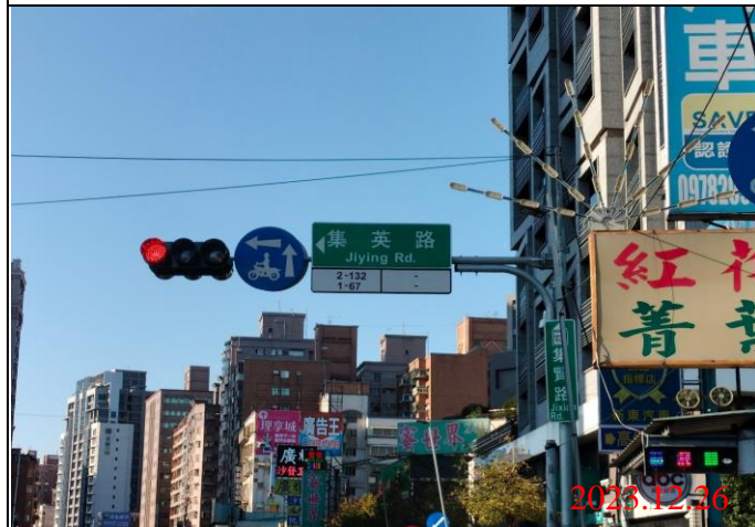
巡查日期地點：112.12.26/ Y22車站 照片說明：牌面設置狀況