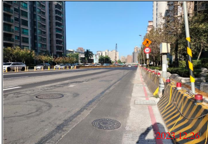
巡查日期地點：112.12.26/ Y23車站 照片說明：路面狀況