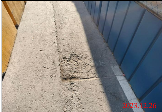
巡查日期地點：112.12.26/ Y23車站 照片說明：路面龜裂狀況