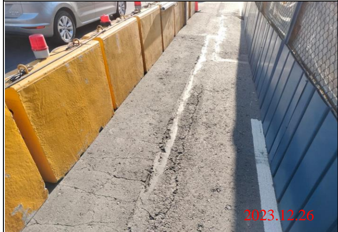
巡查日期地點：112.12.26/ Y23車站 照片說明：路面龜裂狀況