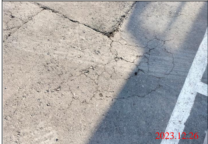
巡查日期地點：112.12.26/ Y23車站 照片說明：路面龜裂狀況