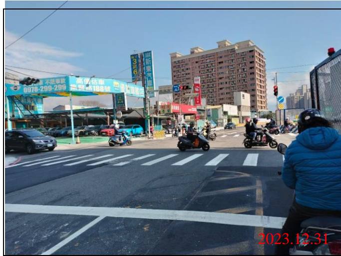
巡查日期地點：112.12.31/ Y22車站 照片說明：路面狀況