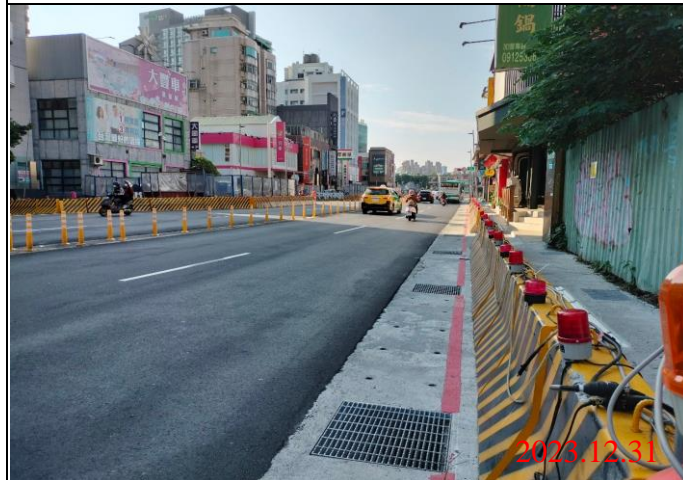
巡查日期地點：112.12.31/ Y21車站 照片說明：路面狀況