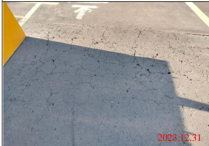
巡查日期地點：112.12.31/ Y23車站 照片說明：路面龜裂狀況