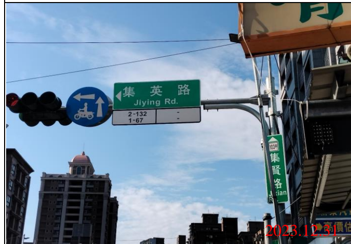
巡查日期地點：112.12.31/ Y22車站 照片說明：牌面設置狀況