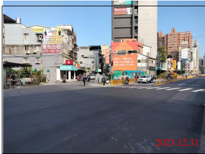
巡查日期地點：112.12.31/ Y21車站 照片說明：路面狀況