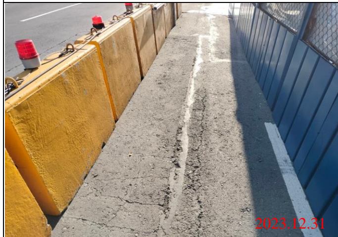
巡查日期地點：112.12.31/ Y23車站 照片說明：路面龜裂狀況