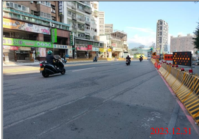
巡查日期地點：112.12.31/ Y22車站 照片說明：路面狀況