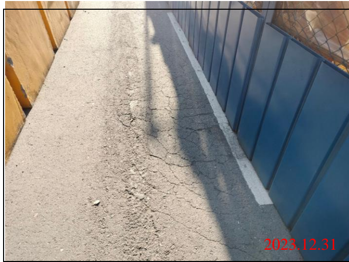
巡查日期地點：112.12.31/ Y23車站 照片說明：路面龜裂狀況