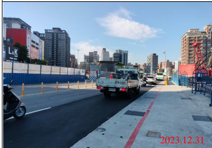
巡查日期地點：112.12.31/ Y22車站 照片說明：路面狀況