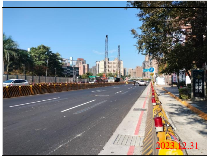
巡查日期地點：112.12.31/ Y23車站 照片說明：路面狀況