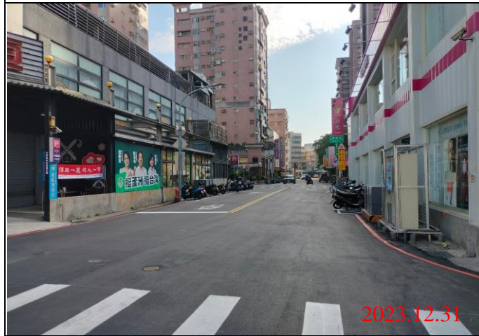
巡查日期地點：112.12.31/ Y21車站 照片說明：路面狀況