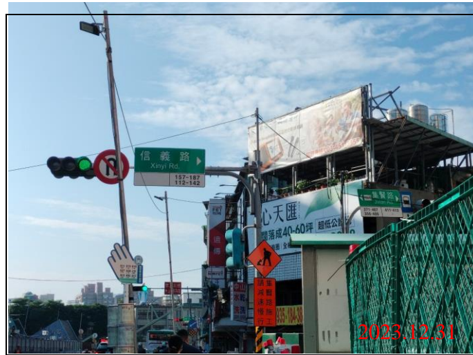
巡查日期地點：112.12.31/ Y21車站 照片說明：牌面設置狀況