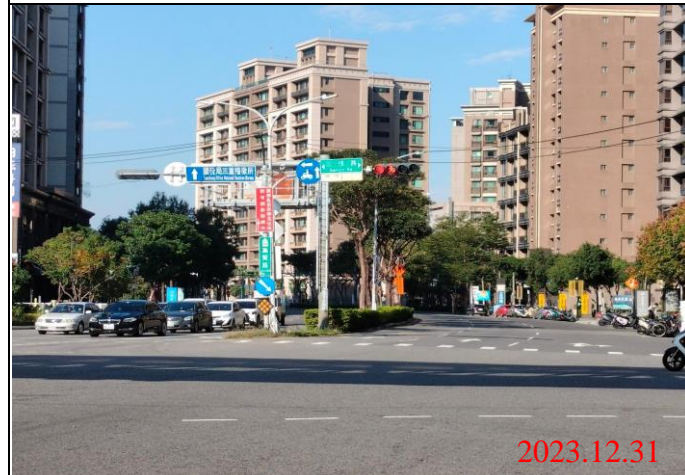
巡查日期地點：112.12.31/ Y23車站 照片說明：牌面設置狀況