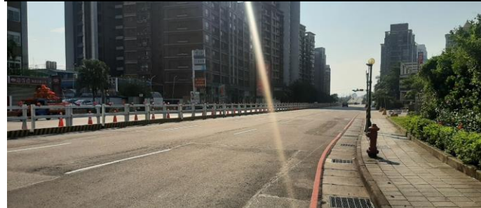
巡查日期地點：113.01.03/ Y23車站 照片說明：路面狀況