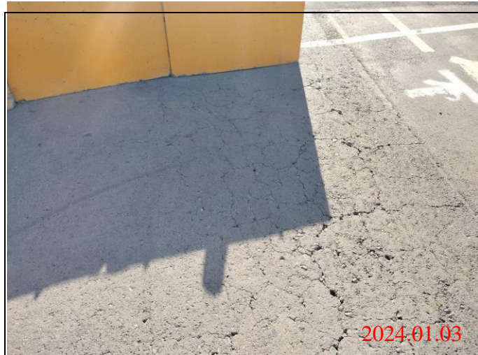
巡查日期地點：113.01.03/ Y23車站 照片說明：路面龜裂狀況