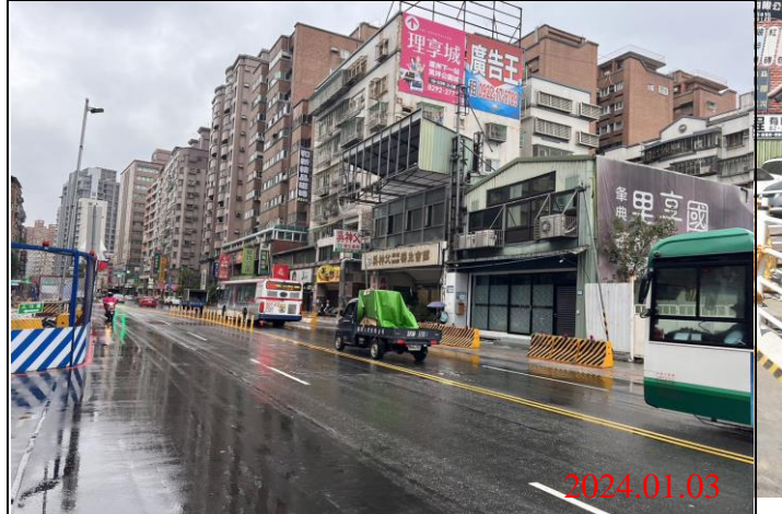
巡查日期地點：113.01.03/ Y22車站 照片說明：路面狀況