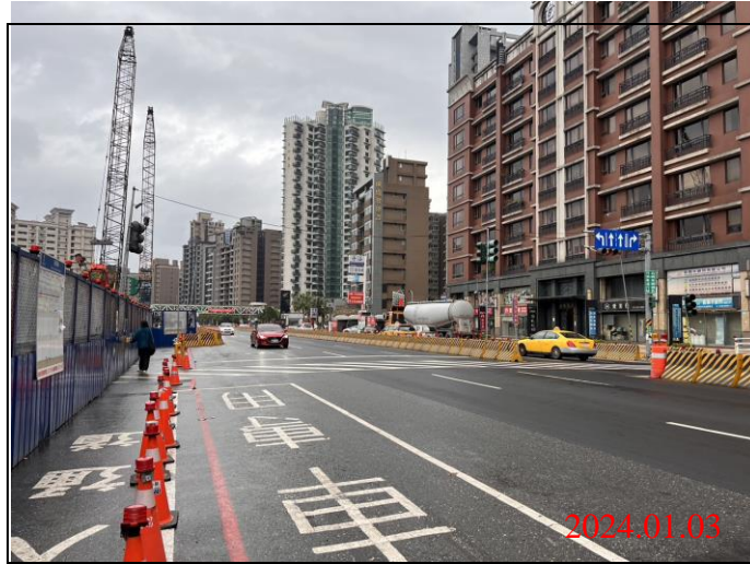
巡查日期地點：113.01.03/ Y23車站 照片說明：路面狀況