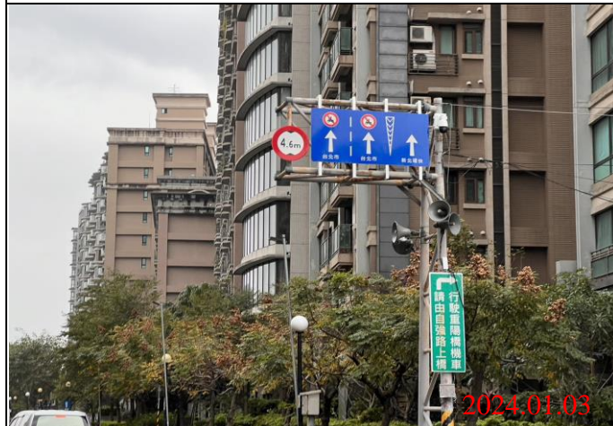
巡查日期地點：113.01.03/ Y23車站 照片說明：牌面設置狀況