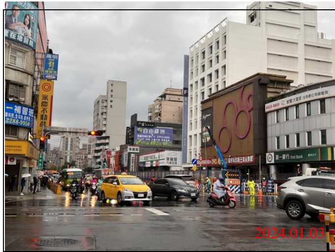
巡查日期地點：113.01.03/ Y21車站 照片說明：路面狀況