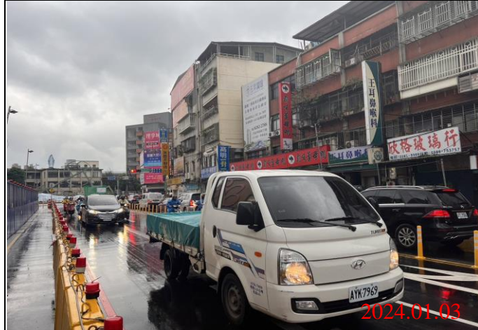
巡查日期地點：113.01.03/ Y21車站 照片說明：路面狀況