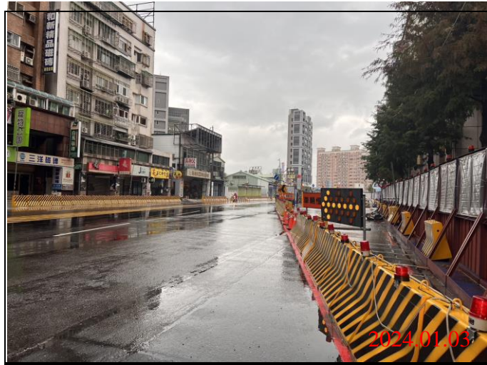
巡查日期地點：113.01.03/ Y22車站 照片說明：路面狀況