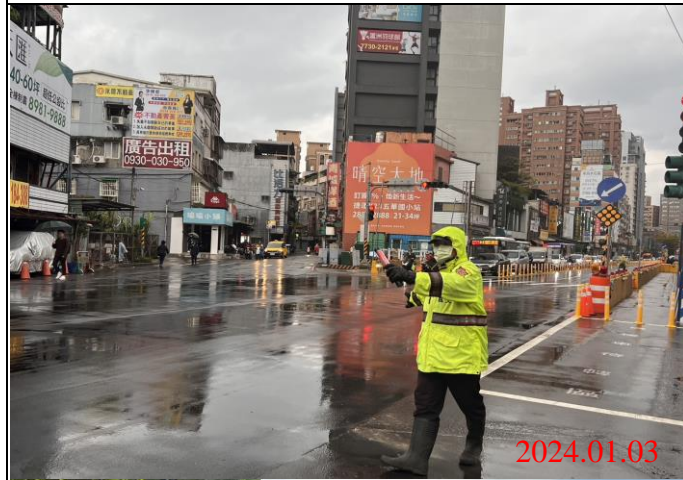
巡查日期地點：113.01.03/ Y21車站 照片說明：路面狀況