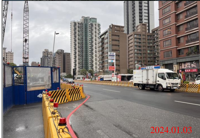
巡查日期地點：113.01.03/ Y23車站 照片說明：路面狀況