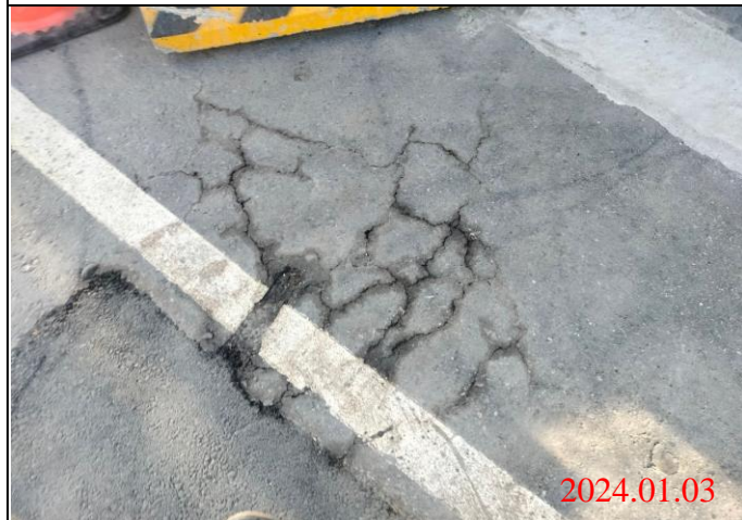
巡查日期地點：113.01.03/ Y23車站 照片說明：路面龜裂狀況