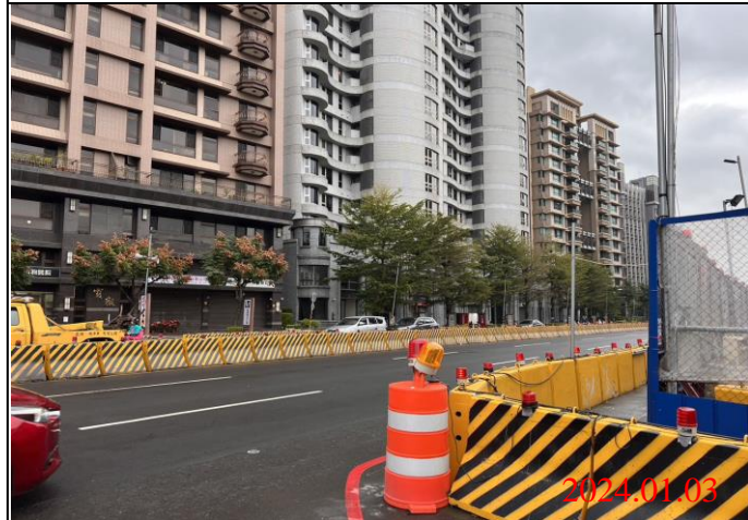
巡查日期地點：113.01.03/ Y23車站 照片說明：路面狀況