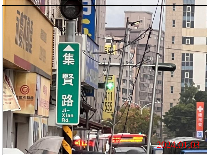
巡查日期地點：113.01.03/ Y21車站 照片說明：牌面設置狀況