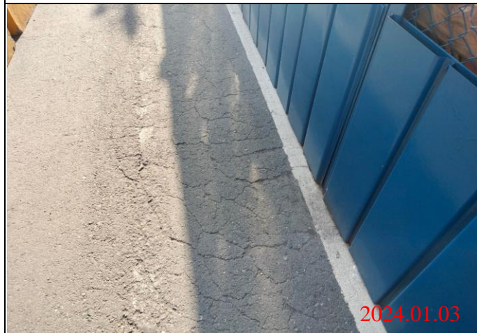
巡查日期地點：113.01.03/ Y23車站 照片說明：路面龜裂狀況