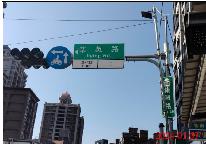
巡查日期地點：113.01.03/ Y22車站 照片說明：牌面設置狀況