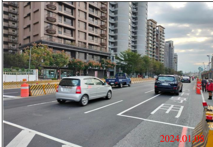
巡查日期地點：113.01.08/ Y23車站 照片說明：路面狀況