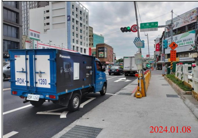
巡查日期地點：113.01.08/ Y21車站 照片說明：路面狀況