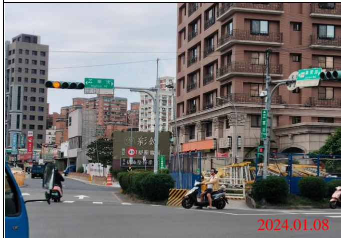
巡查日期地點：113.01.08/ Y22車站 照片說明：牌面設置狀況