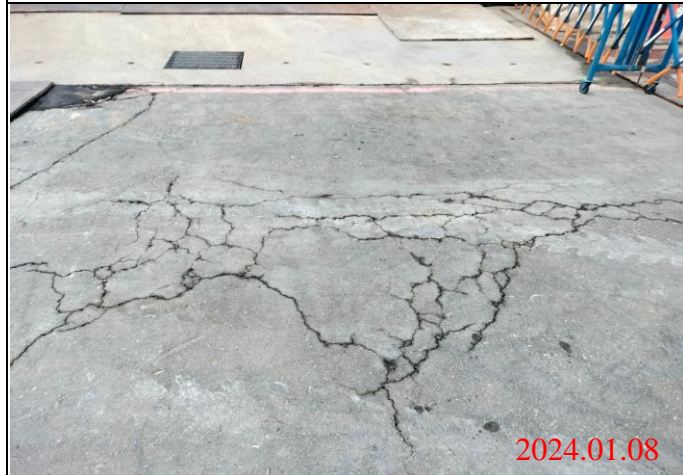
巡查日期地點：113.01.08/ Y23車站 照片說明：路面龜裂狀況