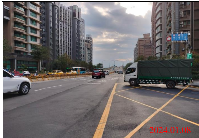
巡查日期地點：113.01.08/ Y23車站 照片說明：路面狀況