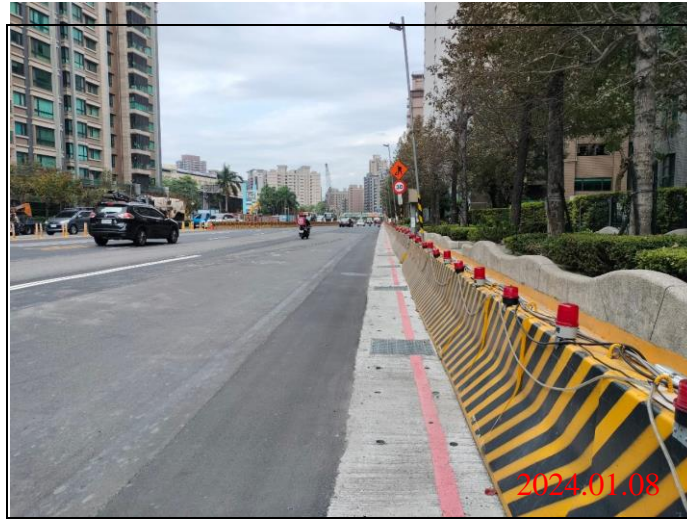
巡查日期地點：113.01.08/ Y23車站 照片說明：路面狀況