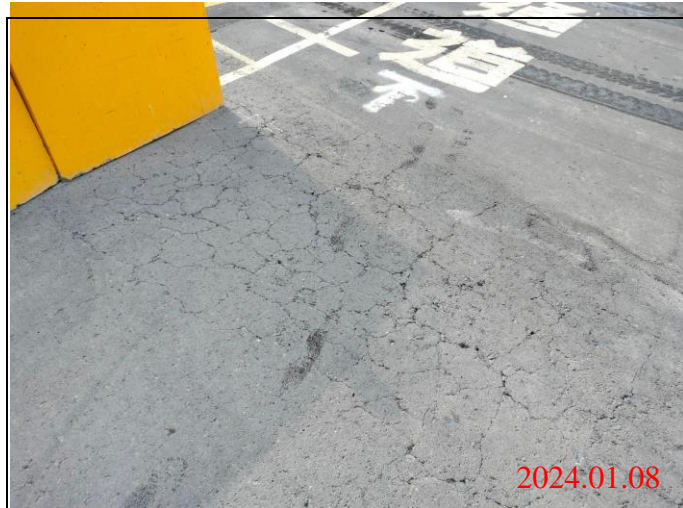
巡查日期地點：113.01.08/ Y23車站 照片說明：路面龜裂狀況