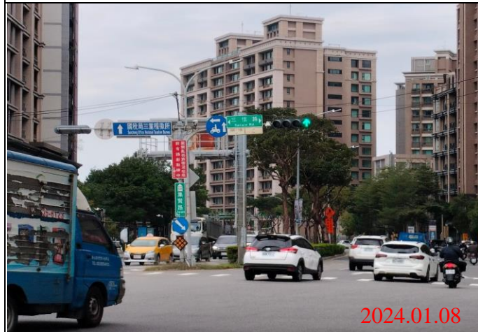
巡查日期地點：113.01.08/ Y23車站 照片說明：牌面設置狀況