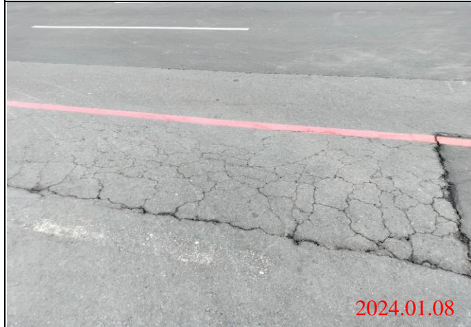
巡查日期地點：113.01.08/ Y23車站 照片說明：路面龜裂狀況