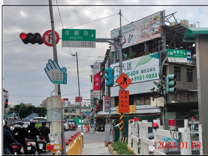
巡查日期地點：113.01.08/ Y21車站 照片說明：牌面設置狀況