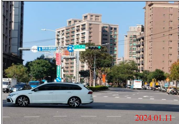
巡查日期地點：113.01.11/ Y23車站 照片說明：牌面設置狀況