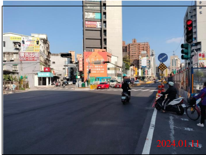
巡查日期地點：113.01.11/ Y21車站 照片說明：路面狀況