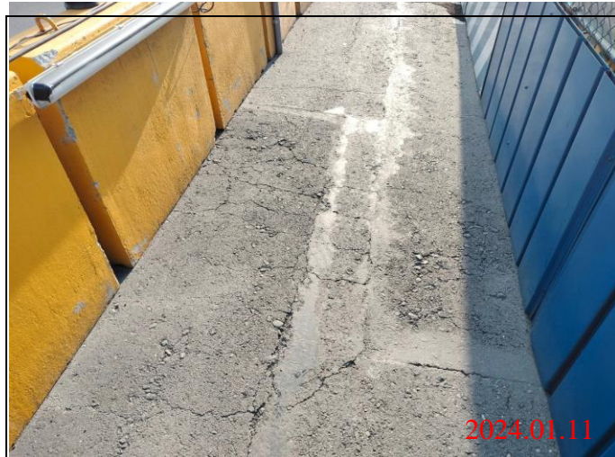
巡查日期地點：113.01.11/ Y23車站 照片說明：路面龜裂狀況