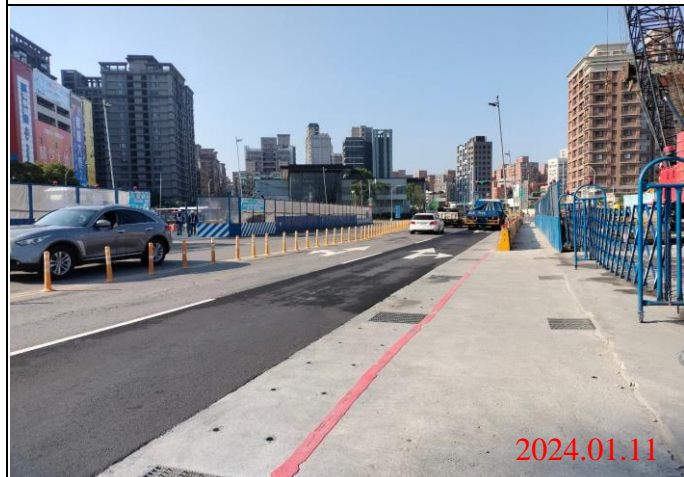
巡查日期地點：113.01.11/ Y22車站 照片說明：路面狀況