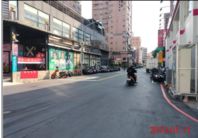
巡查日期地點：113.01.11/ Y21車站 照片說明：路面狀況