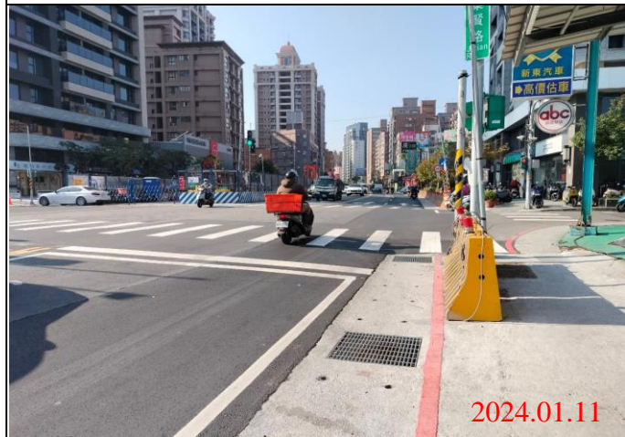
巡查日期地點：113.01.11/ Y22車站 照片說明：路面狀況