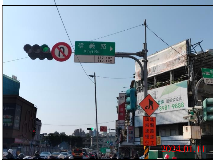
巡查日期地點：113.01.11/ Y21車站 照片說明：牌面設置狀況