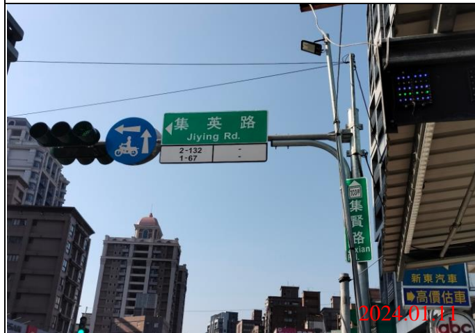
巡查日期地點：113.01.11/ Y22車站 照片說明：牌面設置狀況