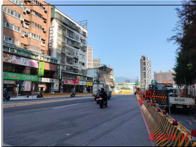
巡查日期地點：113.01.11/ Y22車站 照片說明：路面狀況