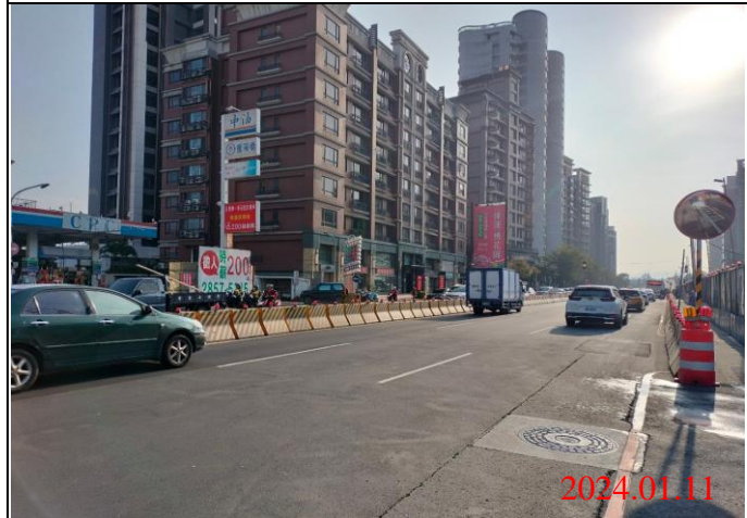
巡查日期地點：113.01.11/ Y23車站 照片說明：路面狀況