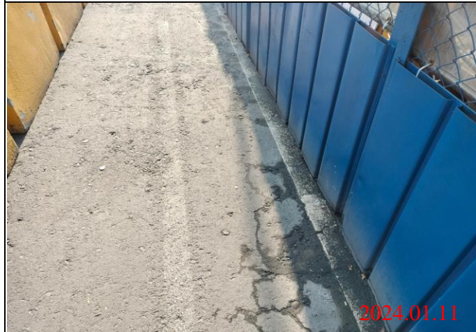
巡查日期地點：113.01.11/ Y23車站 照片說明：路面龜裂狀況