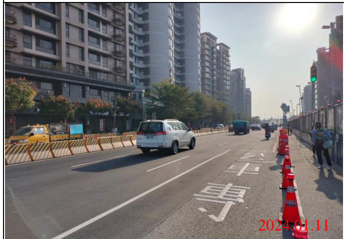
巡查日期地點：113.01.11/ Y23車站 照片說明：路面狀況