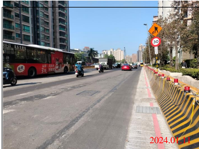
巡查日期地點：113.01.11/ Y23車站 照片說明：路面狀況