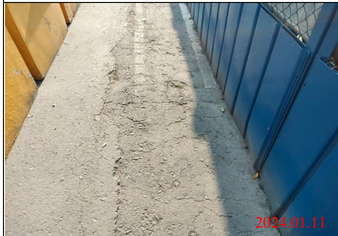
巡查日期地點：113.01.11/ Y23車站 照片說明：路面龜裂狀況