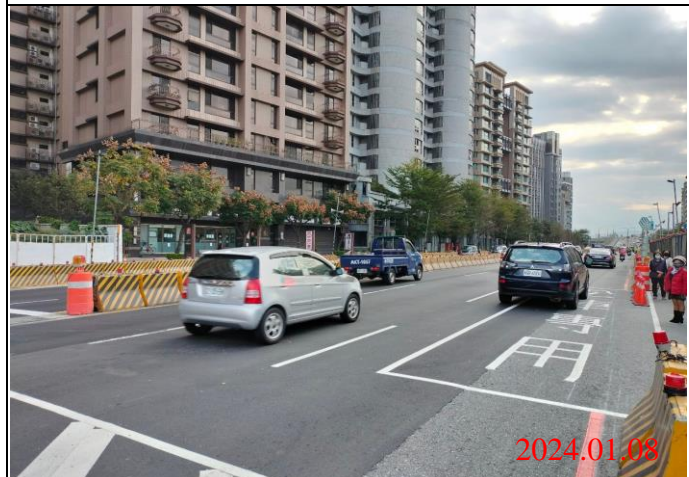
巡查日期地點：113.01.08/ Y23車站 照片說明：路面狀況