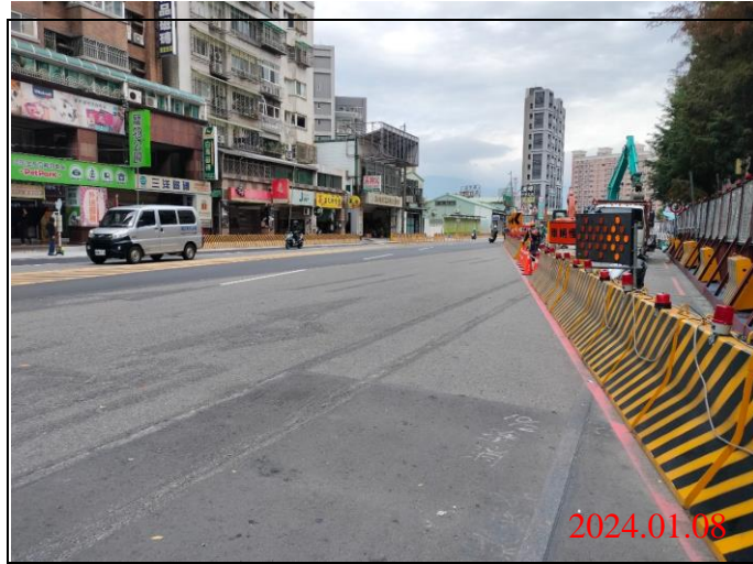
巡查日期地點：113.01.08/ Y22車站 照片說明：路面狀況