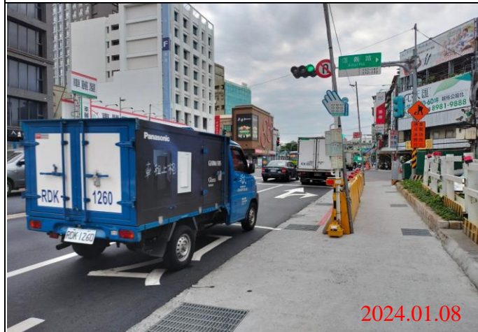
巡查日期地點：113.01.08/ Y21車站 照片說明：路面狀況