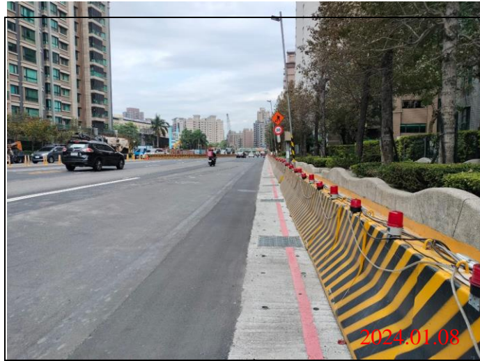
巡查日期地點：113.01.08/ Y23車站 照片說明：路面狀況