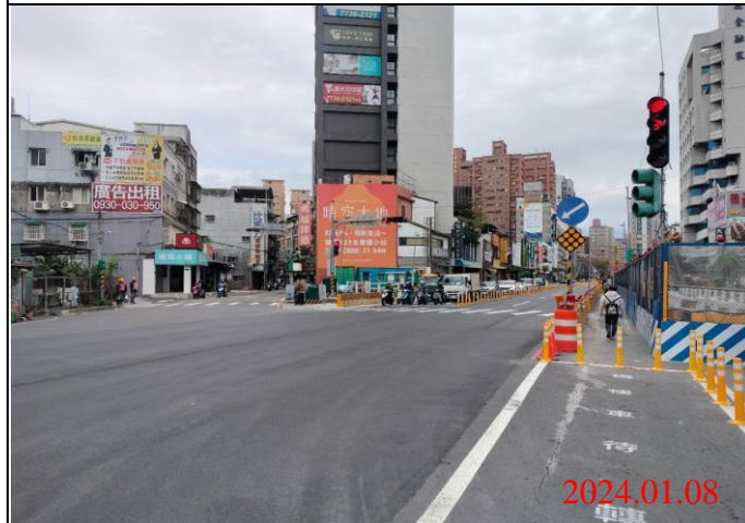
巡查日期地點：113.01.08/ Y21車站 照片說明：路面狀況