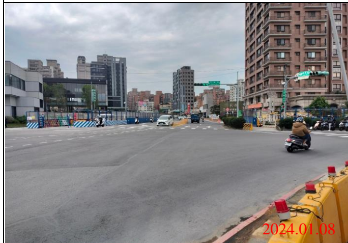
巡查日期地點：113.01.08/ Y22車站 照片說明：路面狀況