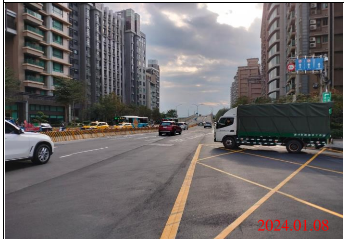
巡查日期地點：113.01.08/ Y23車站 照片說明：路面狀況