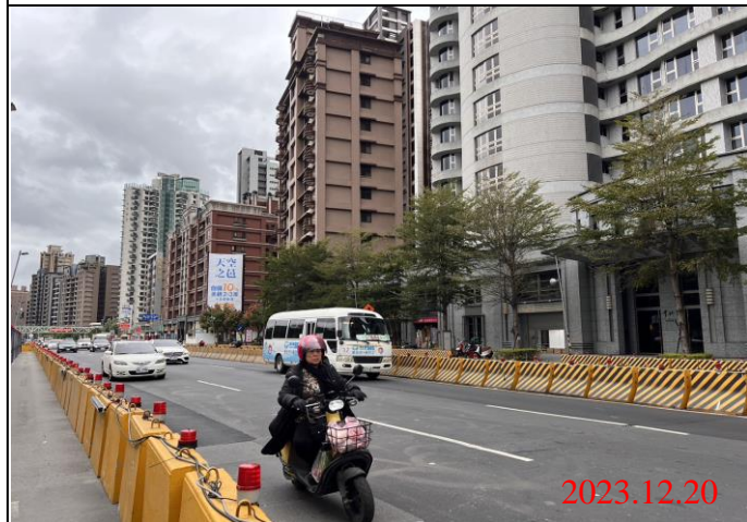
巡查日期地點：112.12.20/ Y23車站 照片說明：路面狀況