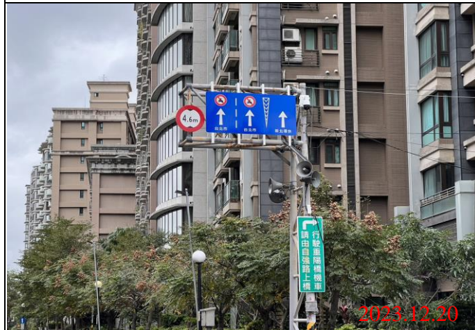
巡查日期地點：112.12.20/ Y23車站 照片說明：牌面設置狀況