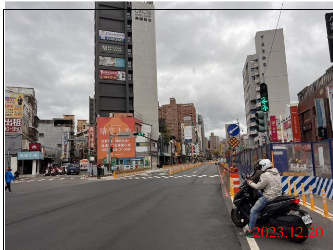
巡查日期地點：112.12.20/ Y21車站 照片說明：路面狀況