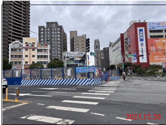
巡查日期地點：112.12.20/ Y22車站 照片說明：路面狀況