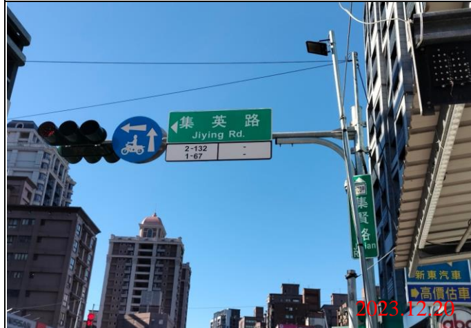
巡查日期地點：112.12.20/ Y22車站 照片說明：牌面設置狀況