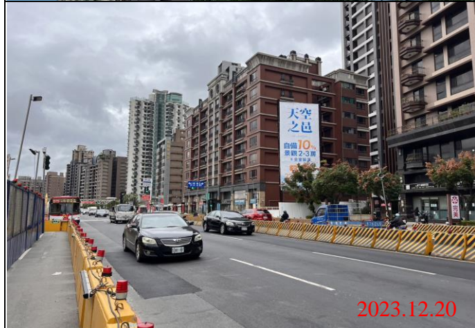
巡查日期地點：112.12.20/ Y23車站 照片說明：路面狀況