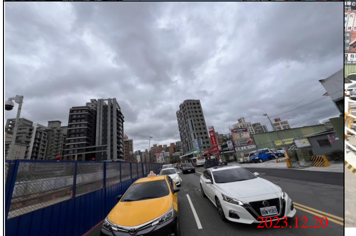
巡查日期地點：112.12.20/ Y22車站 照片說明：路面狀況