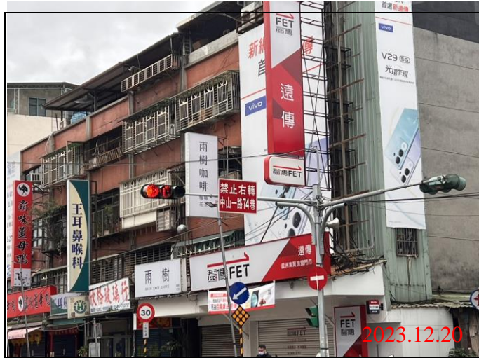
巡查日期地點：112.12.20/ Y21車站 照片說明：牌面設置狀況