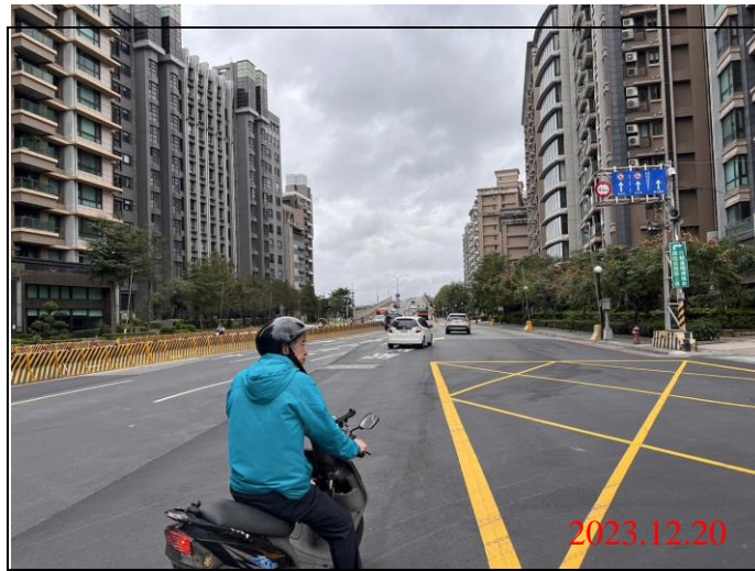
巡查日期地點：112.12.20/ Y23車站 照片說明：路面狀況