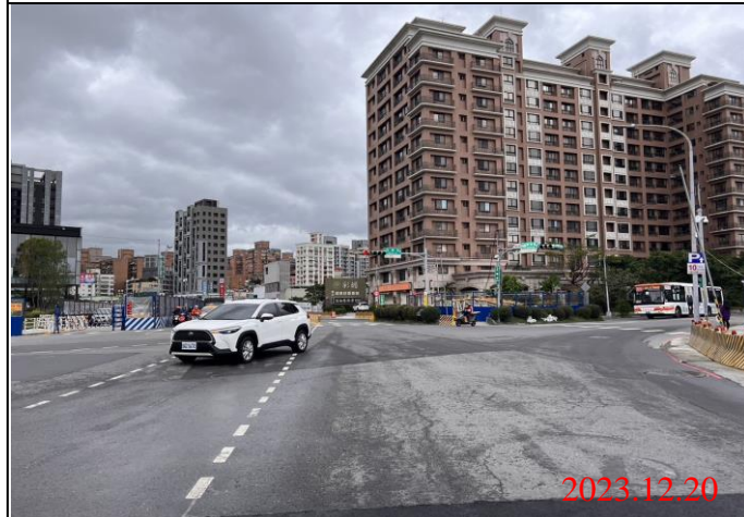
巡查日期地點：112.12.20/ Y22車站 照片說明：路面狀況