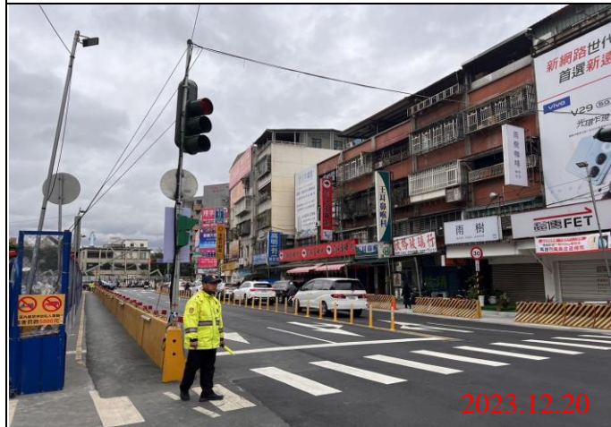
巡查日期地點：112.12.20/ Y21車站 照片說明：路面狀況