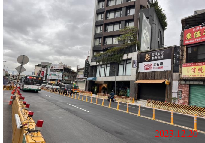
巡查日期地點：112.12.20/ Y21車站 照片說明：路面狀況