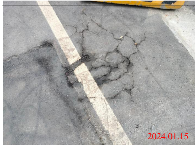
巡查日期地點：113.01.15/ Y23車站 照片說明：路面龜裂狀況