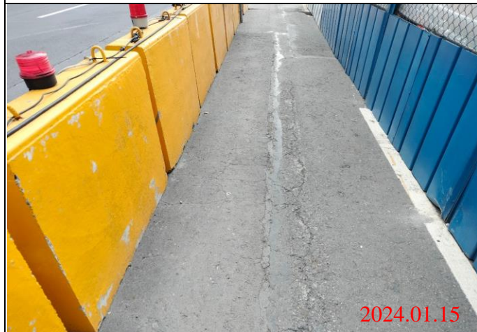
巡查日期地點：113.01.15/ Y23車站 照片說明：路面龜裂狀況