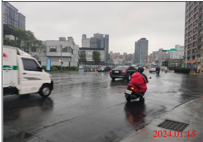
巡查日期地點：113.01.15/ Y22車站 照片說明：路面狀況