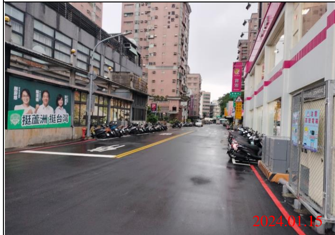
巡查日期地點：113.01.15/ Y21車站 照片說明：路面狀況