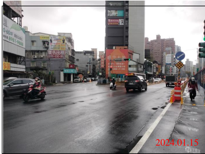
巡查日期地點：113.01.15/ Y21車站 照片說明：路面狀況