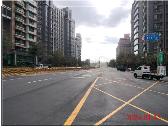
巡查日期地點：113.01.15/ Y23車站 照片說明：路面狀況