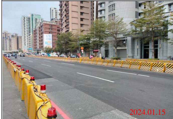
巡查日期地點：113.01.15/ Y23車站 照片說明：路面狀況