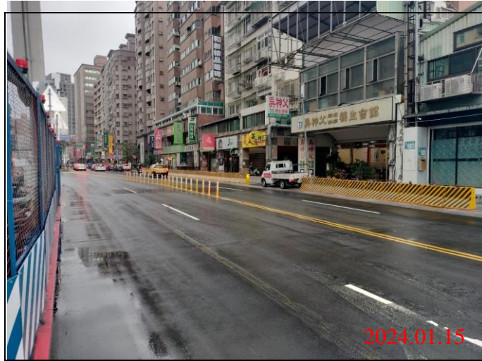
巡查日期地點：113.01.15/ Y22車站 照片說明：路面狀況