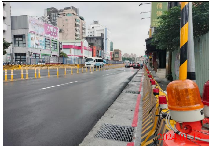
巡查日期地點：113.01.15/ Y21車站 照片說明：路面狀況