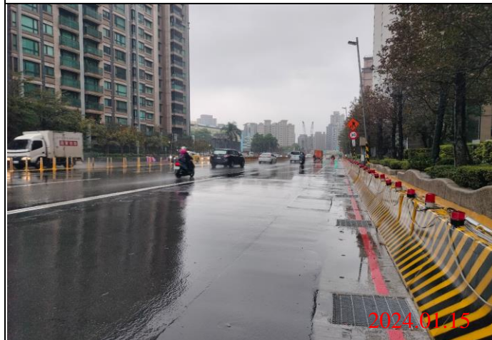
巡查日期地點：113.01.15/ Y23車站 照片說明：路面狀況