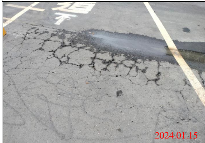
巡查日期地點：113.01.15/ Y23車站 照片說明：路面龜裂狀況