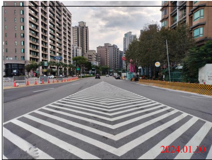
巡查日期地點：113.01.10/ Y22車站 照片說明：路面狀況