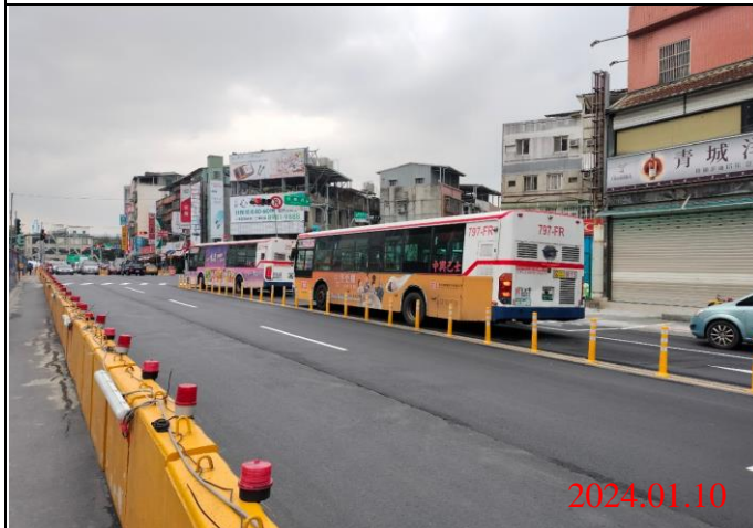
巡查日期地點：113.01.10/ Y21車站 照片說明：路面狀況