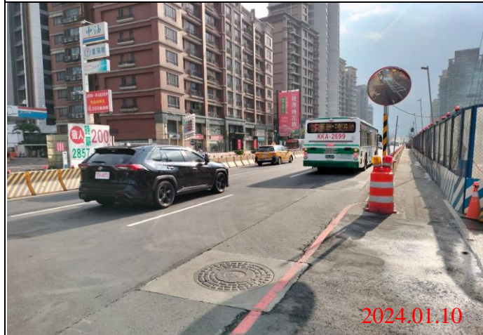
巡查日期地點：113.01.10/ Y23車站 照片說明：路面狀況