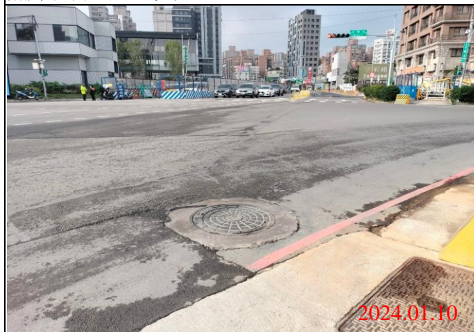
巡查日期地點：113.01.10/ Y22車站 照片說明：路面狀況