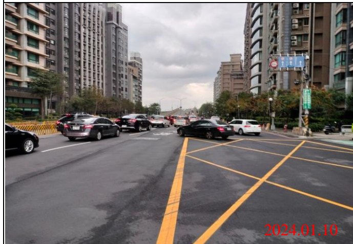
巡查日期地點：113.01.10/ Y23車站 照片說明：路面狀況