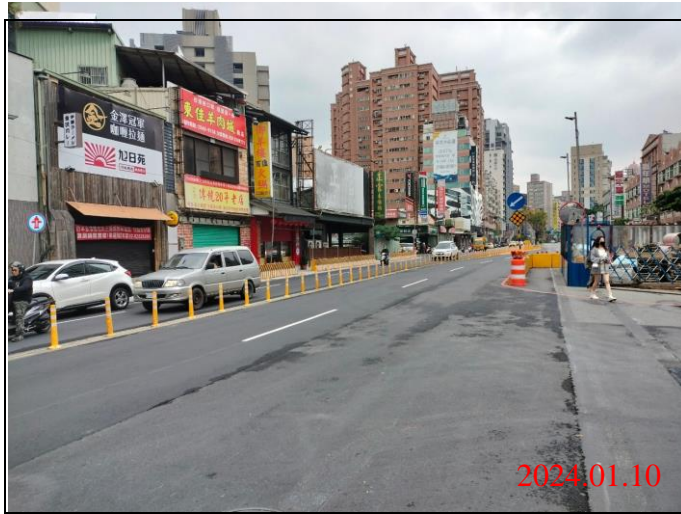
巡查日期地點：113.01.10/ Y21車站 照片說明：路面狀況