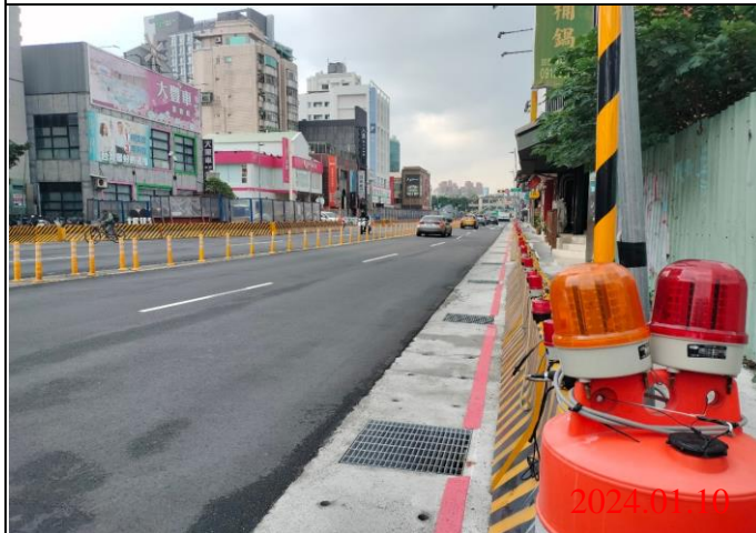
巡查日期地點：113.01.10/ Y21車站 照片說明：路面狀況