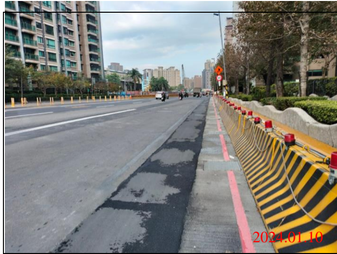
巡查日期地點：113.01.10/ Y23車站 照片說明：路面狀況