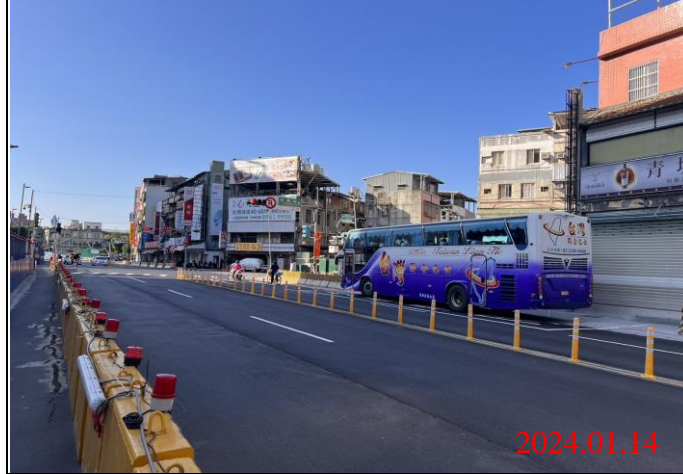
巡查日期地點：113.01.14/ Y21車站 照片說明：路面狀況