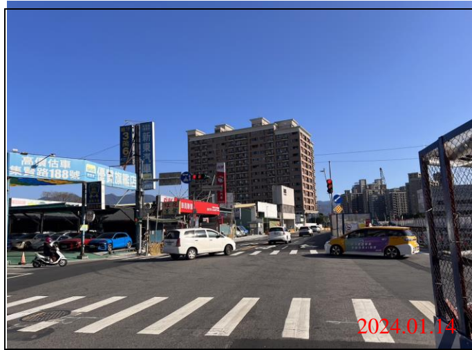
巡查日期地點：113.01.14/ Y22車站 照片說明：路面狀況