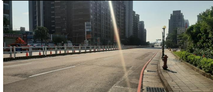
巡查日期地點：113.01.14/ Y23車站 照片說明：路面狀況