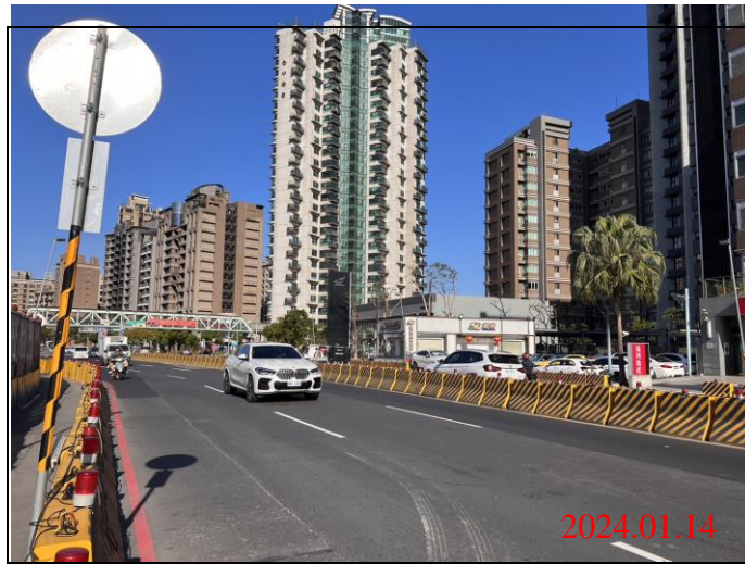
巡查日期地點：113.01.14/ Y23車站 照片說明：路面狀況