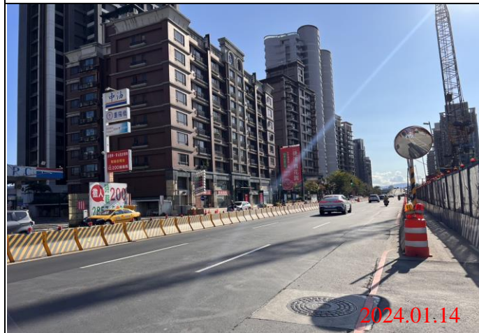
巡查日期地點：113.01.14/ Y23車站 照片說明：路面狀況