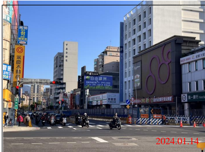
巡查日期地點：113.01.14/ Y21車站 照片說明：路面狀況