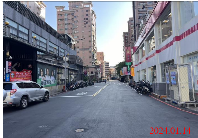
巡查日期地點：113.01.14/ Y21車站 照片說明：路面狀況