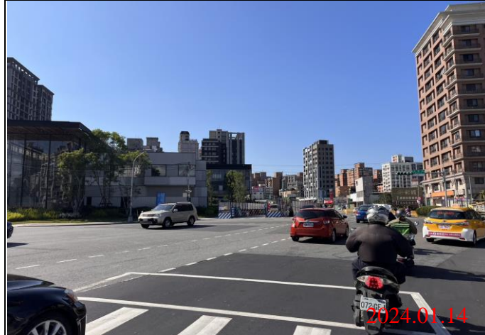
巡查日期地點：113.01.14/ Y22車站 照片說明：路面狀況