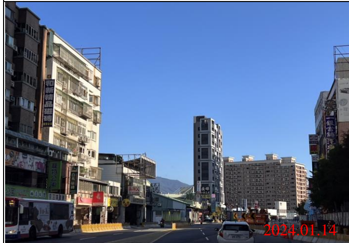
巡查日期地點：113.01.14/ Y22車站 照片說明：路面狀況