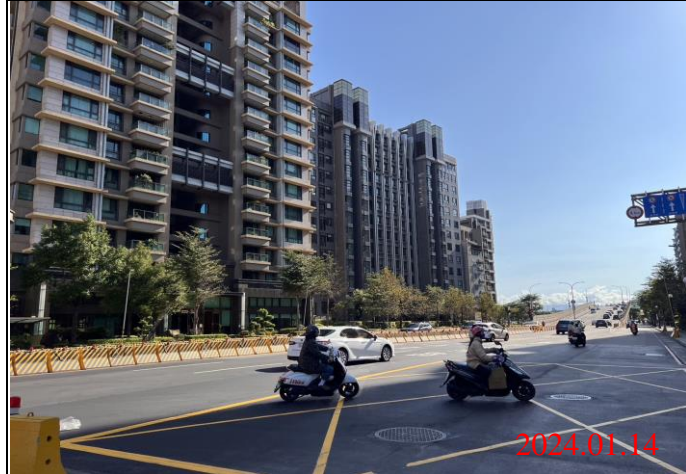
巡查日期地點：113.01.14/ Y23車站 照片說明：路面狀況