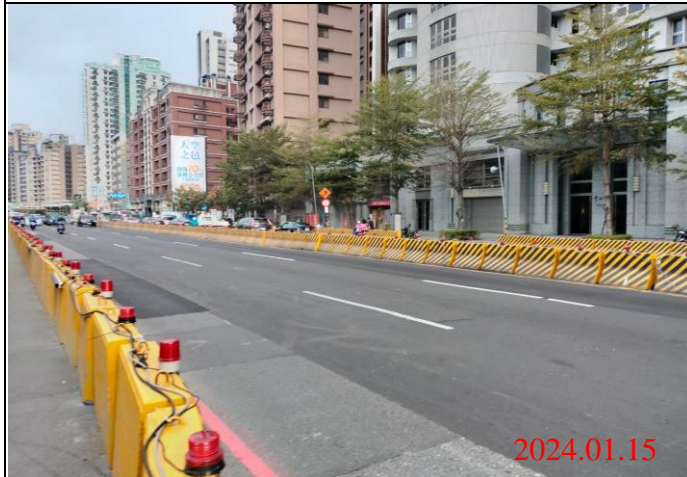
巡查日期地點：113.01.15/ Y23車站 照片說明：路面狀況