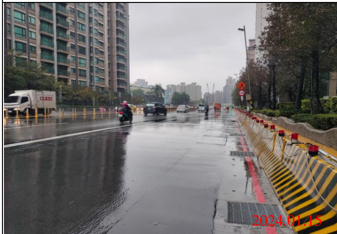
巡查日期地點：113.01.15/ Y23車站 照片說明：路面狀況