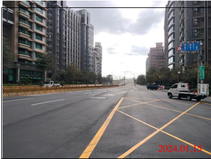
巡查日期地點：113.01.15/ Y23車站 照片說明：路面狀況