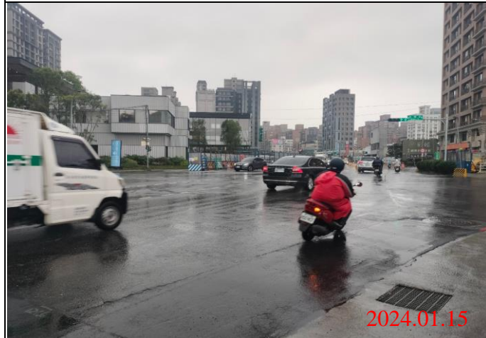
巡查日期地點：113.01.15/ Y22車站 照片說明：路面狀況