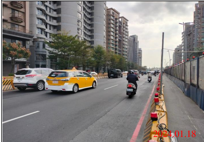
巡查日期地點：113.01.18/ Y23車站 照片說明：路面狀況