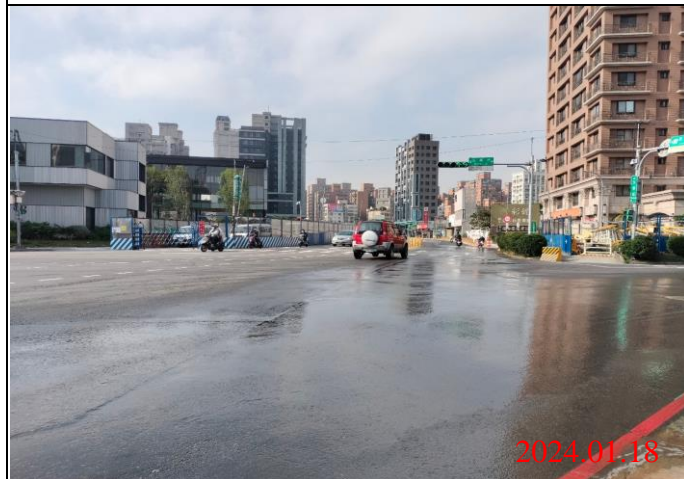
巡查日期地點：113.01.18/ Y22車站 照片說明：路面狀況