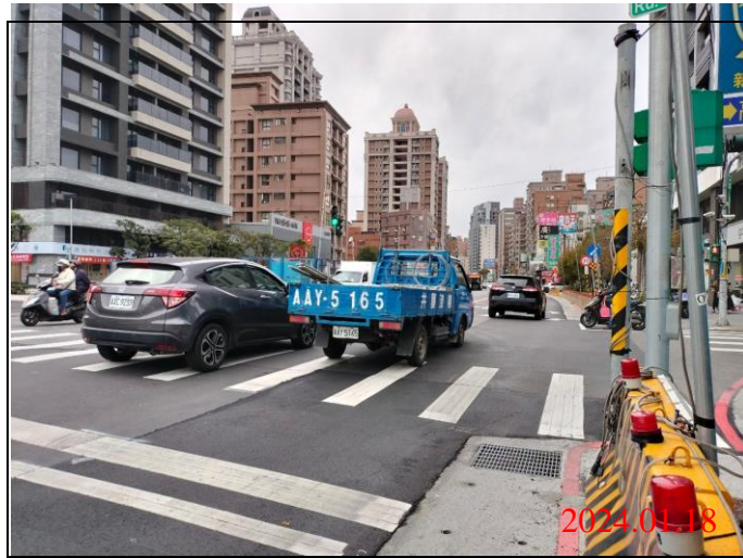
巡查日期地點：113.01.18/ Y22車站 照片說明：路面狀況