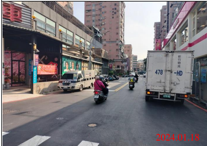
巡查日期地點：113.01.18/ Y21車站 照片說明：路面狀況