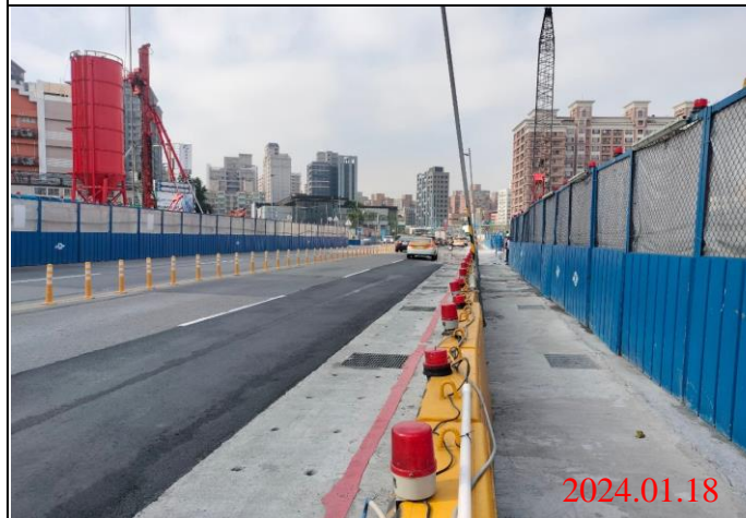
巡查日期地點：113.01.18/ Y22車站 照片說明：路面狀況