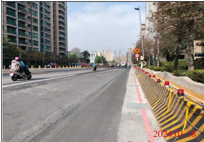
巡查日期地點：113.01.18/ Y23車站 照片說明：路面狀況