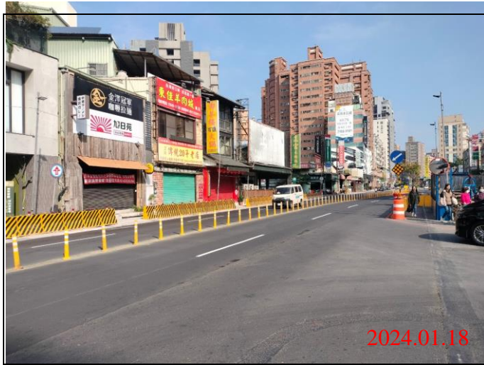
巡查日期地點：113.01.18/ Y21車站 照片說明：路面狀況