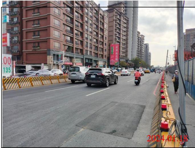
巡查日期地點：113.01.18/ Y23車站 照片說明：路面狀況