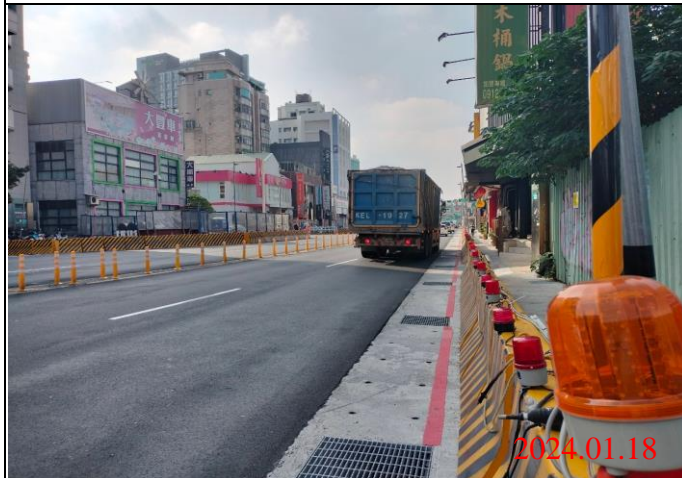
巡查日期地點：113.01.18/ Y21車站 照片說明：路面狀況