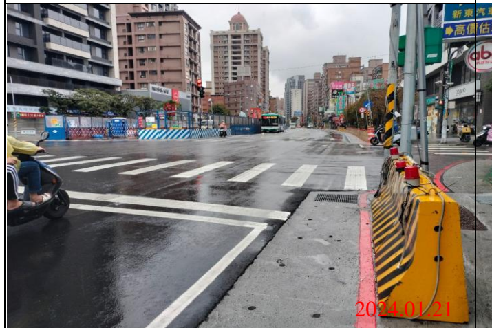
巡查日期地點：113.01.21/ Y22車站 照片說明：路面狀況