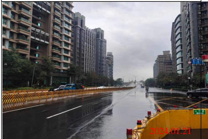
巡查日期地點：113.01.21/ Y23車站 照片說明：路面狀況