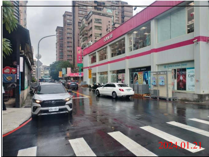
巡查日期地點：113.01.21/ Y21車站 照片說明：路面狀況