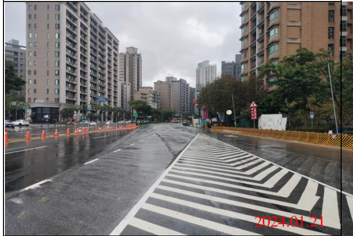
巡查日期地點：113.01.21/ Y22車站 照片說明：路面狀況