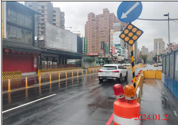
巡查日期地點：113.01.21/ Y21車站 照片說明：路面狀況