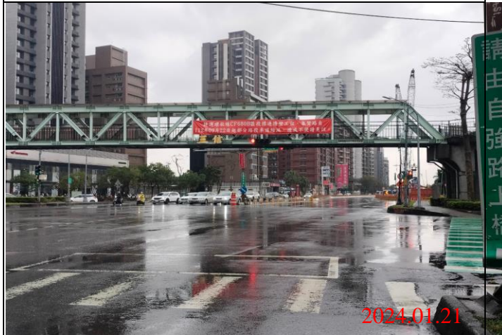
巡查日期地點：113.01.21/ Y23車站 照片說明：路面狀況