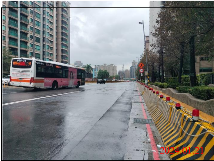
巡查日期地點：113.01.21/ Y23車站 照片說明：路面狀況