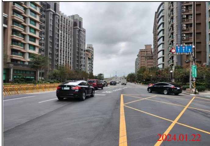
巡查日期地點：113.01.22/ Y23車站 照片說明：路面狀況