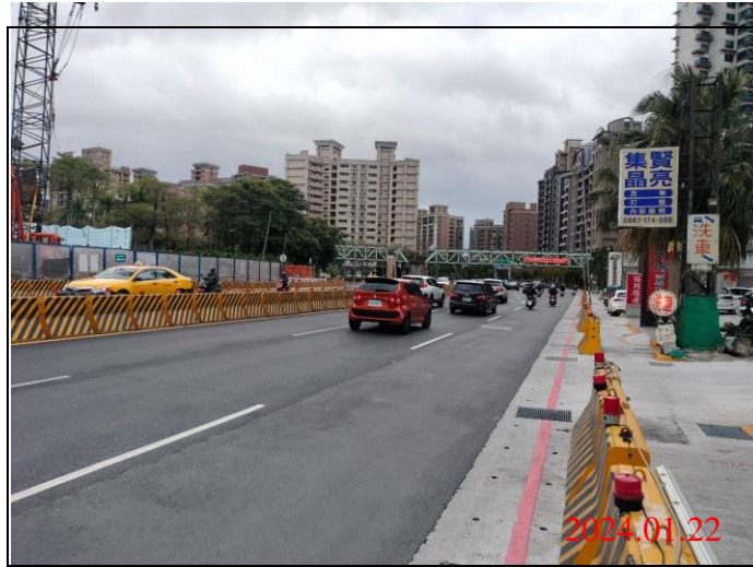
巡查日期地點：113.01.22/ Y23車站 照片說明：路面狀況