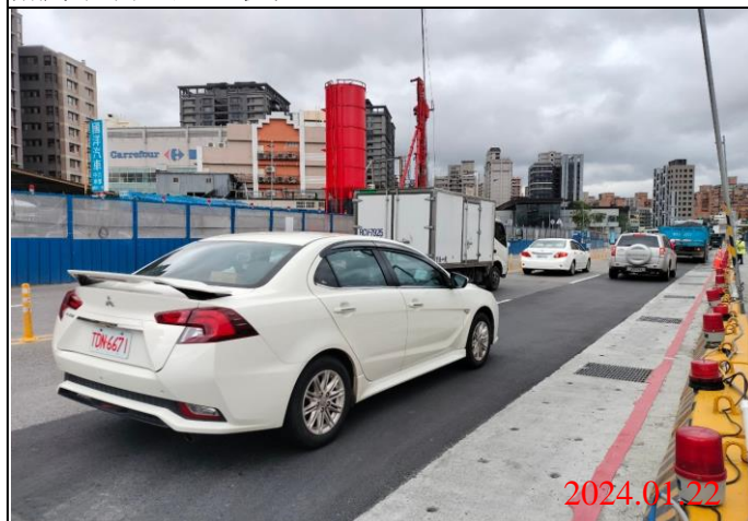
巡查日期地點：113.01.22/ Y22車站 照片說明：路面狀況