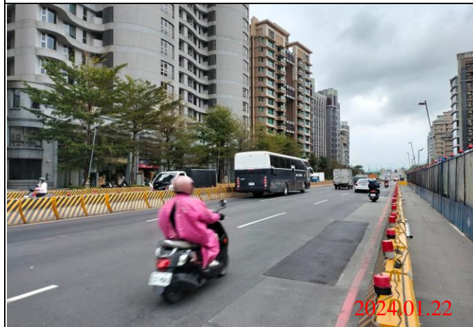
巡查日期地點：113.01.22/ Y23車站 照片說明：路面狀況