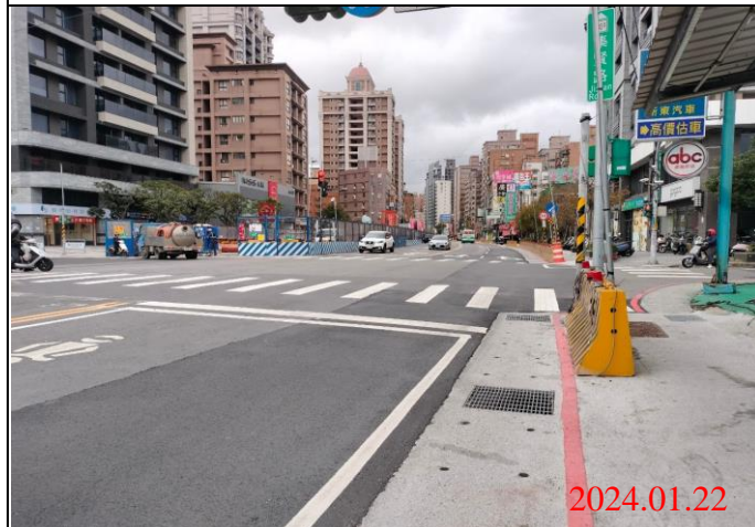
巡查日期地點：113.01.22/ Y22車站 照片說明：路面狀況