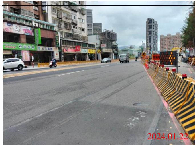
巡查日期地點：113.01.22/ Y22車站 照片說明：路面狀況