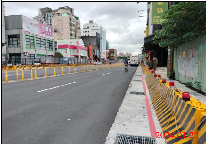
巡查日期地點：113.01.22/ Y21車站 照片說明：路面狀況