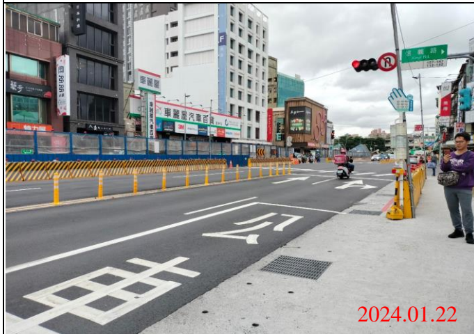
巡查日期地點：113.01.22/ Y21車站 照片說明：路面狀況