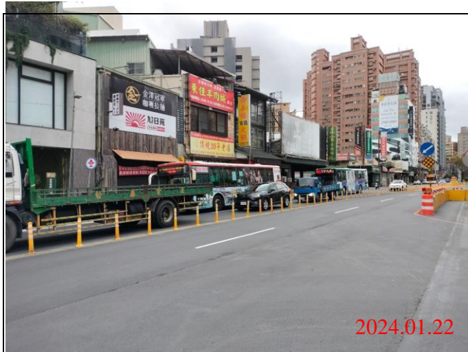
巡查日期地點：113.01.22/ Y21車站 照片說明：路面狀況