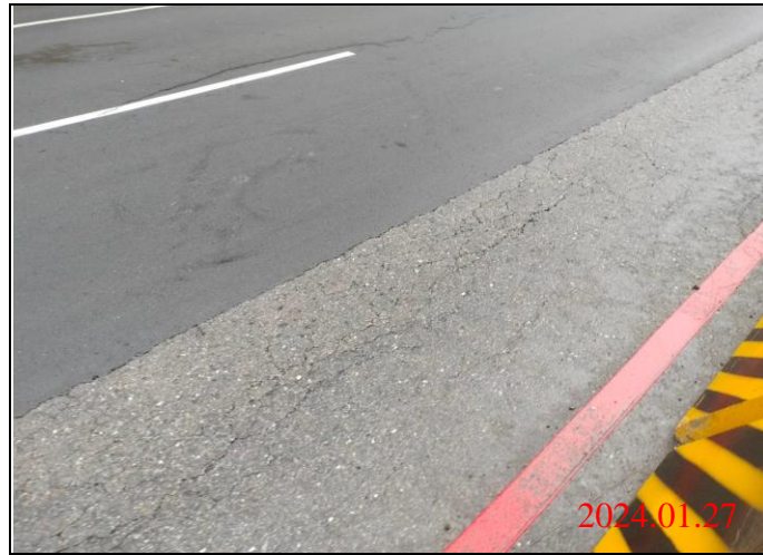
巡查日期地點：113.01.27/ Y23車站 照片說明：路面龜裂狀況