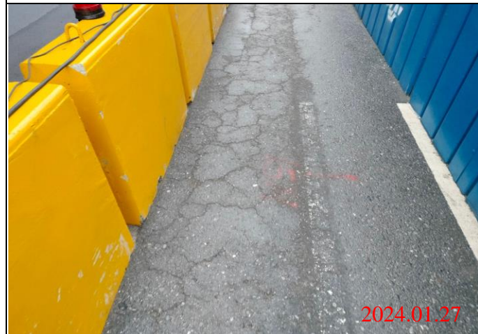
巡查日期地點：113.01.27/ Y23車站 照片說明：路面龜裂狀況