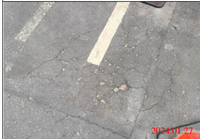
巡查日期地點：113.01.27/ Y23車站 照片說明：路面龜裂狀況