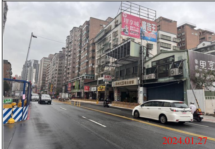
巡查日期地點：113.01.27/ Y22車站 照片說明：路面狀況