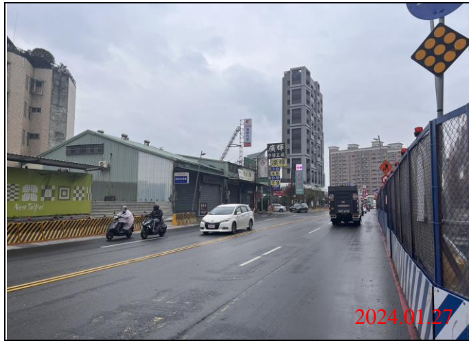
巡查日期地點：113.01.27/ Y22車站 照片說明：路面狀況