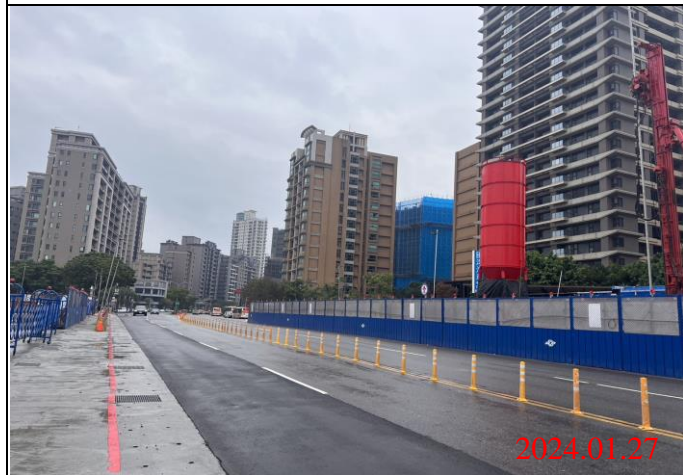
巡查日期地點：113.01.27/ Y22車站 照片說明：路面狀況