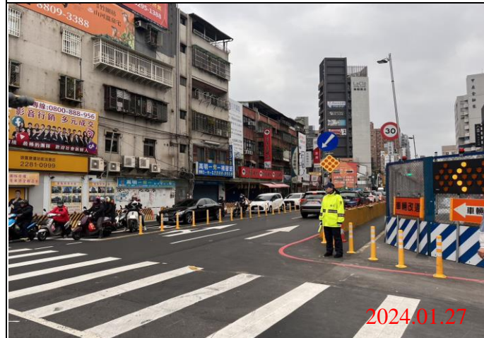
巡查日期地點：113.01.27/ Y21車站 照片說明：路面狀況