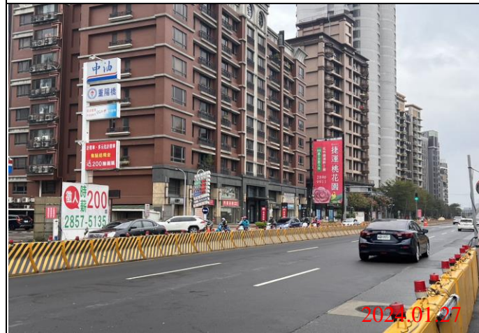
巡查日期地點：113.01.27/ Y23車站 照片說明：路面狀況