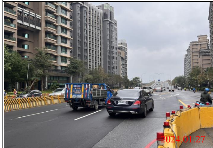
巡查日期地點：113.01.27/ Y23車站 照片說明：路面狀況