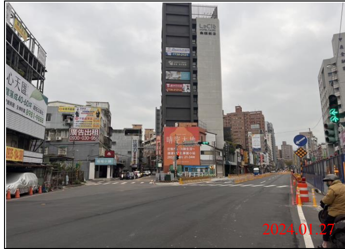
巡查日期地點：113.01.27/ Y21車站 照片說明：路面狀況