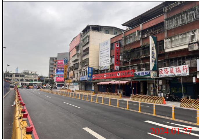
巡查日期地點：113.01.27/ Y21車站 照片說明：路面狀況