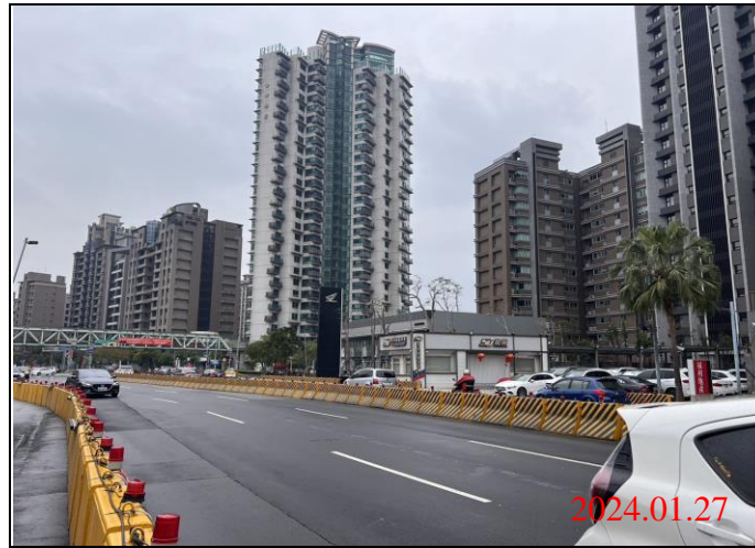
巡查日期地點：113.01.27/ Y23車站 照片說明：路面狀況