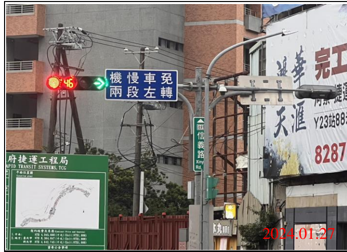
巡查日期地點：113.01.27/ Y21車站 照片說明：牌面設置狀況