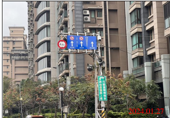
巡查日期地點：113.01.27/ Y23車站 照片說明：牌面設置狀況