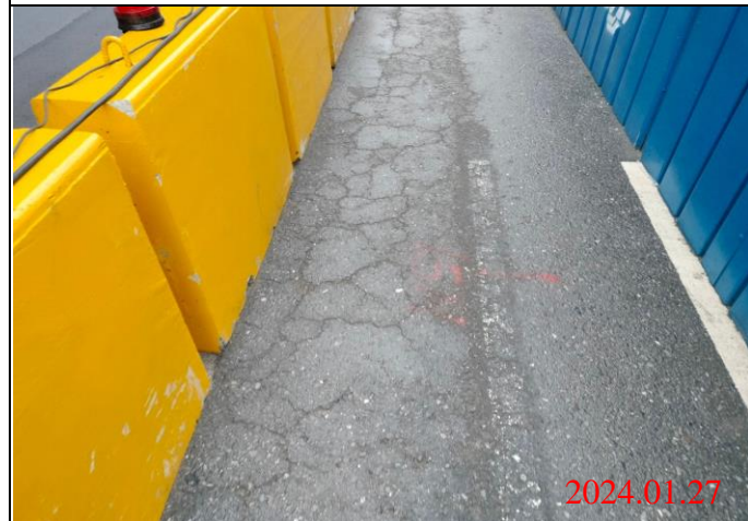
巡查日期地點：113.01.27/ Y23車站 照片說明：路面龜裂狀況