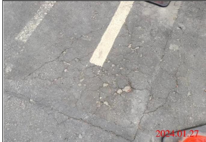
巡查日期地點：113.01.27/ Y23車站 照片說明：路面龜裂狀況