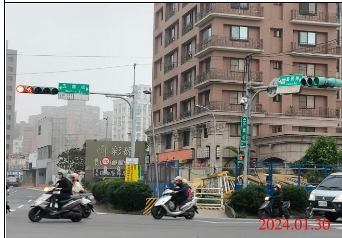
巡查日期地點：113.01.30/ Y22車站 照片說明：牌面設置狀況