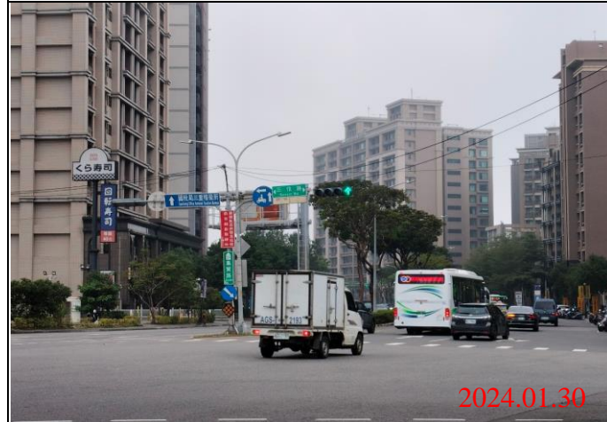
巡查日期地點：113.01.30/ Y23車站 照片說明：牌面設置狀況