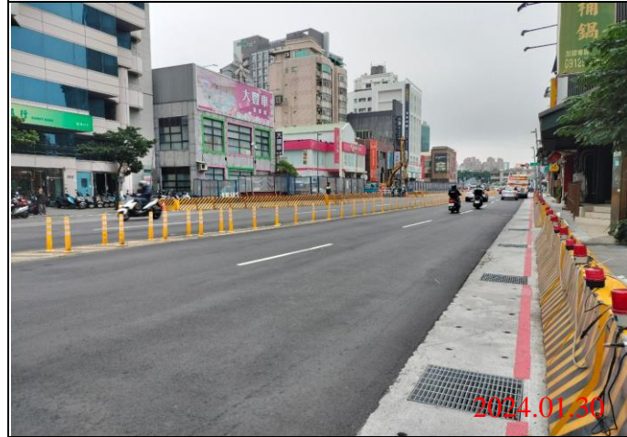
巡查日期地點：113.01.30/ Y21車站 照片說明：路面狀況