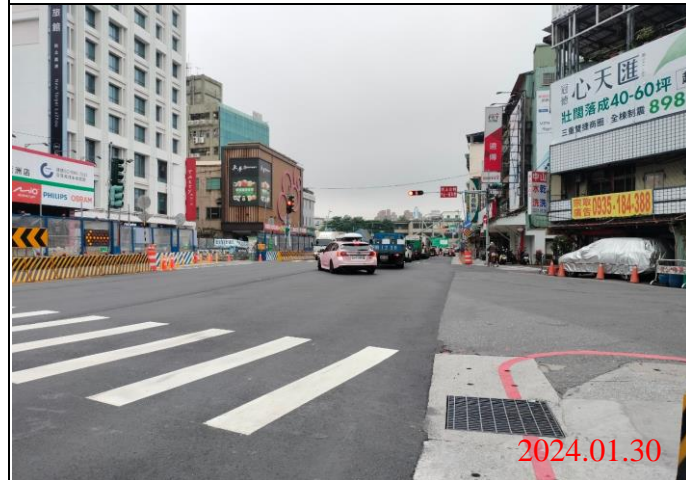
巡查日期地點：113.01.30/ Y21車站 照片說明：路面狀況