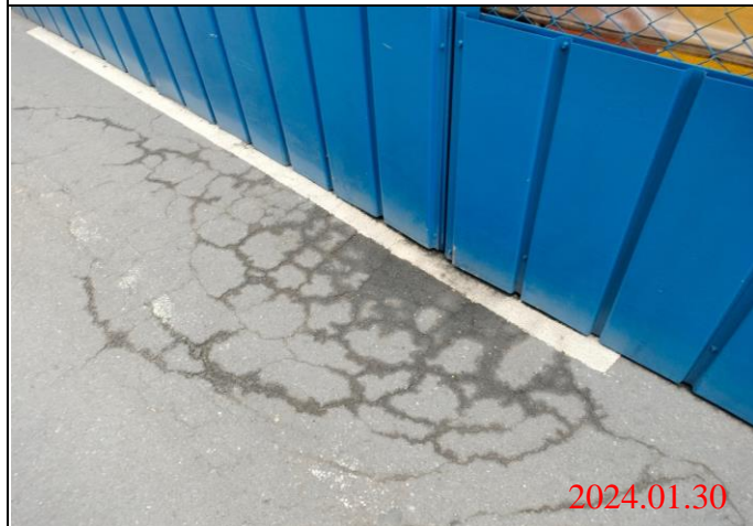
巡查日期地點：113.01.30/ Y23車站 照片說明：路面龜裂狀況