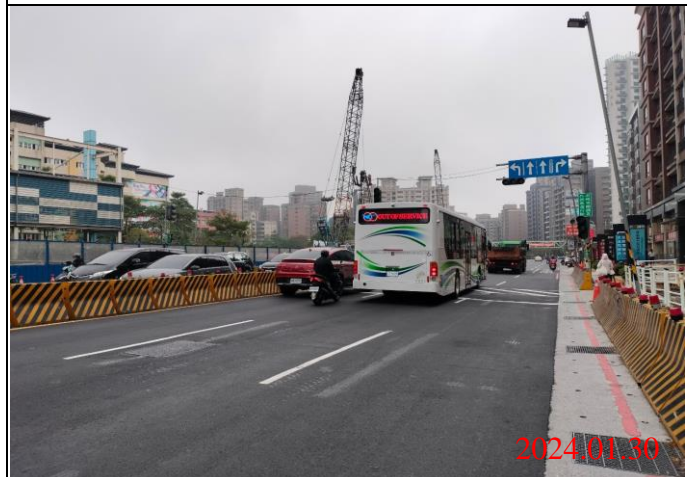
巡查日期地點：113.01.30/ Y23車站 照片說明：路面狀況