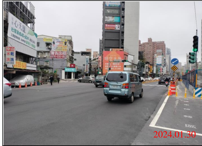
巡查日期地點：113.01.30/ Y21車站 照片說明：路面狀況