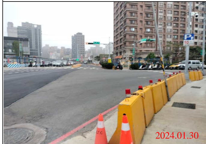
巡查日期地點：113.01.30/ Y22車站 照片說明：路面狀況