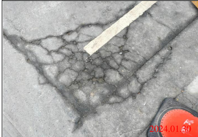
巡查日期地點：113.01.30/ Y23車站 照片說明：路面龜裂狀況