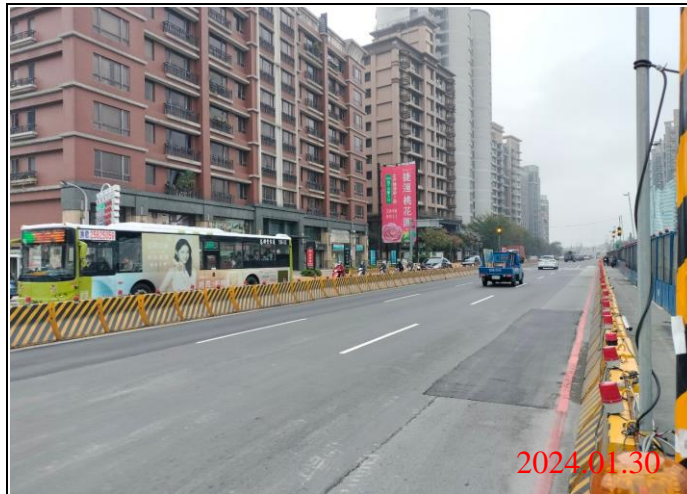
巡查日期地點：113.01.30/ Y23車站 照片說明：路面狀況