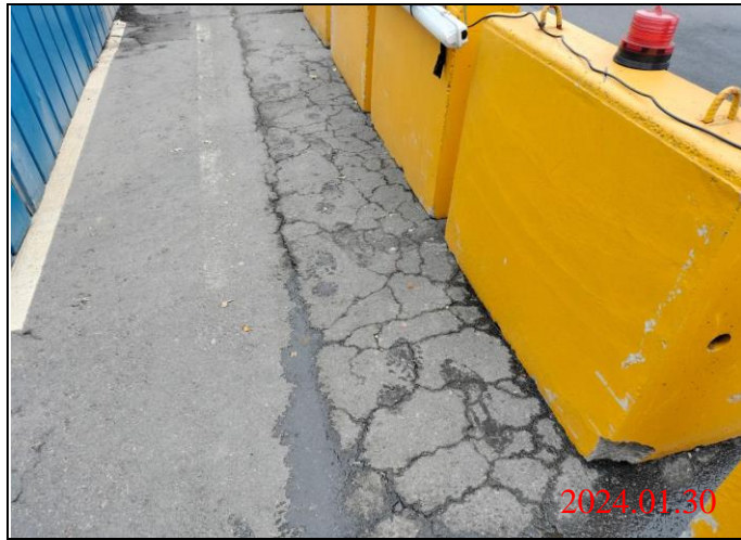
巡查日期地點：113.01.30/ Y23車站 照片說明：路面龜裂狀況