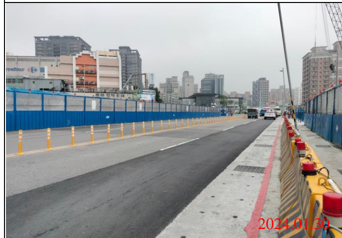
巡查日期地點：113.01.30/ Y22車站 照片說明：路面狀況