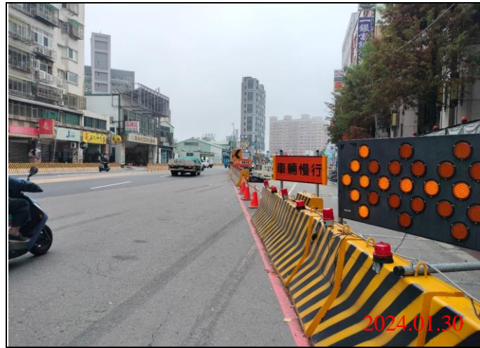
巡查日期地點：113.01.30/ Y22車站 照片說明：路面狀況