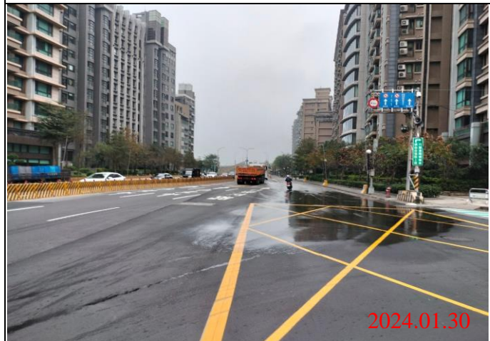
巡查日期地點：113.01.30/ Y23車站 照片說明：路面狀況