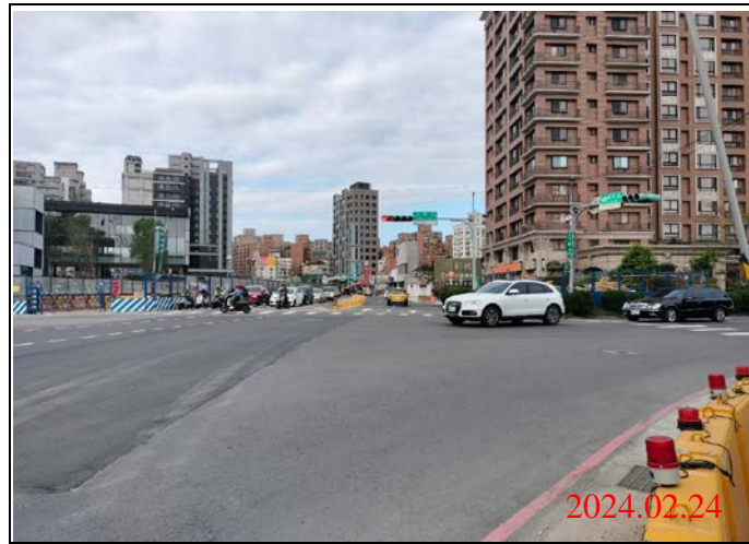
巡查日期地點：113.02.24/ Y22車站 照片說明：路面狀況