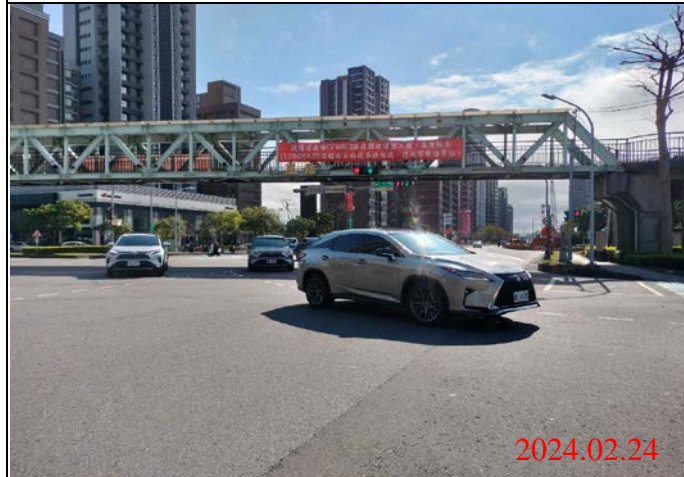
巡查日期地點：113.02.24/ Y23車站 照片說明：路面狀況