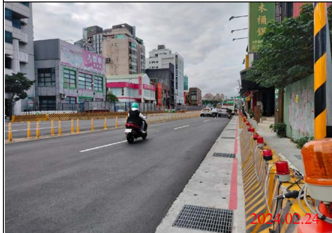
巡查日期地點：113.02.24/ Y21車站 照片說明：路面狀況