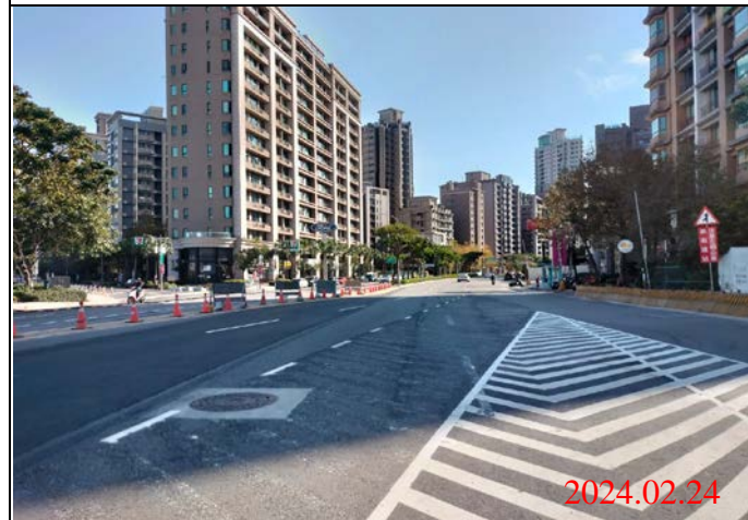
巡查日期地點：113.02.24/ Y22車站 照片說明：路面狀況