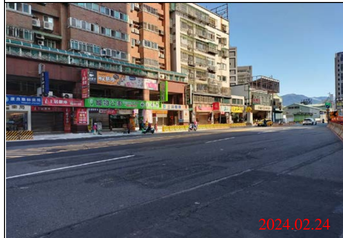
巡查日期地點：113.02.24/ Y22車站 照片說明：路面狀況