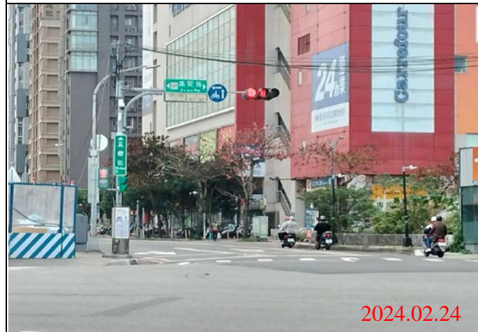
巡查日期地點：113.02.24/ Y22車站 照片說明：牌面設置狀況