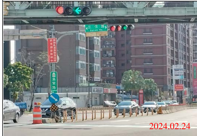
巡查日期地點：113.02.24/ Y23車站 照片說明：牌面設置狀況