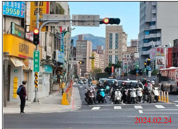
巡查日期地點：113.02.24/ Y21車站 照片說明：牌面設置狀況