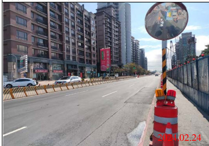
巡查日期地點：113.02.24/ Y23車站 照片說明：路面狀況