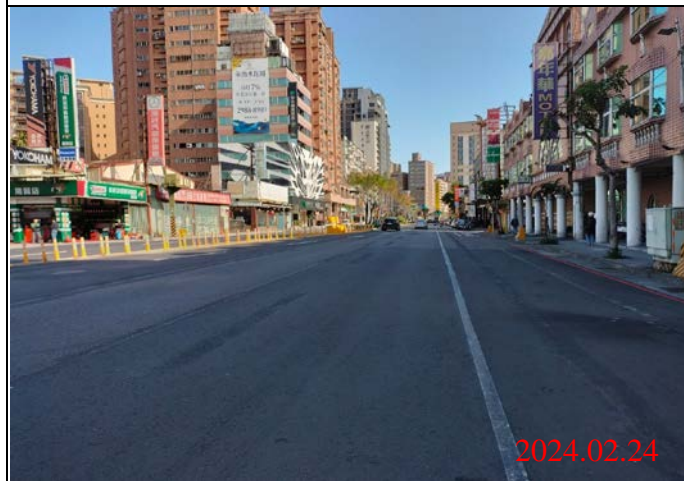
巡查日期地點：113.02.24/ Y21車站 照片說明：路面狀況