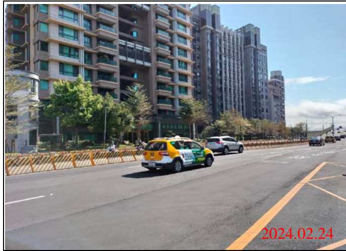
巡查日期地點：113.02.24/ Y23車站 照片說明：路面狀況