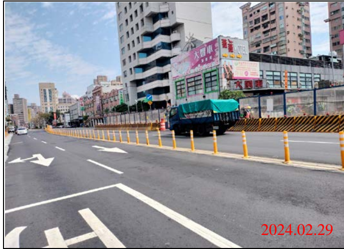
巡查日期地點：113.02.29/ Y21車站 照片說明：路面狀況