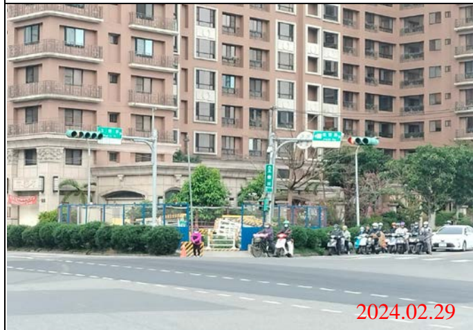
巡查日期地點：113.02.29/ Y22車站 照片說明：牌面設置狀況