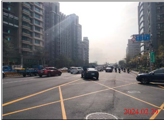
巡查日期地點：113.02.29/ Y23車站 照片說明：路面狀況