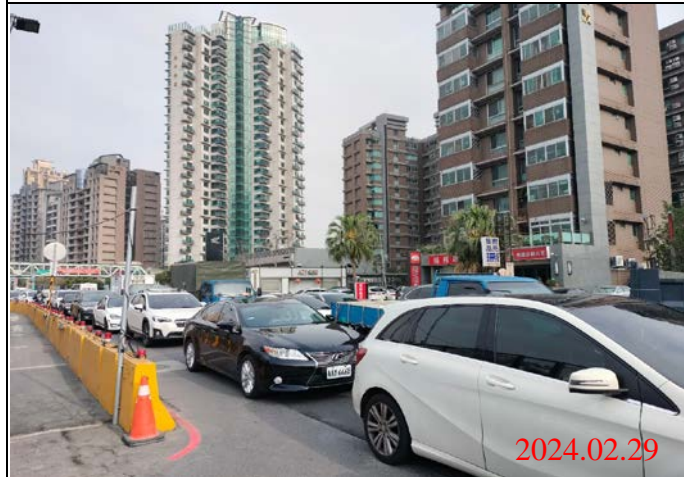
巡查日期地點：113.02.29/ Y23車站 照片說明：路面狀況