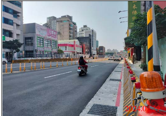
巡查日期地點：113.02.29/ Y21車站 照片說明：路面狀況