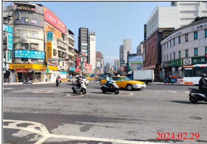
巡查日期地點：113.02.29/ Y21車站 照片說明：路面狀況