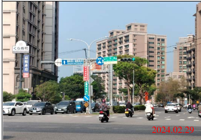
巡查日期地點：113.02.29/ Y23車站 照片說明：牌面設置狀況