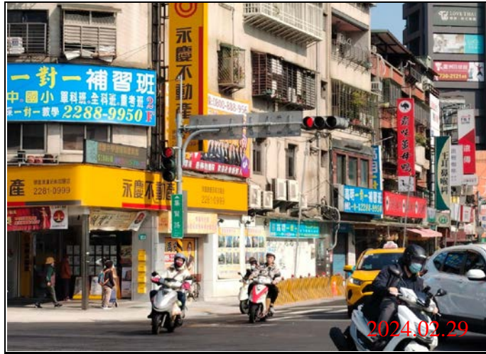
巡查日期地點：113.02.29/ Y21車站 照片說明：牌面設置狀況