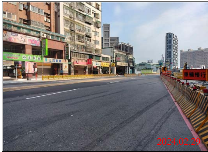
巡查日期地點：113.02.29/ Y22車站 照片說明：路面狀況