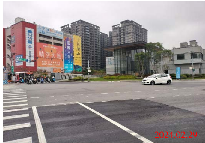
巡查日期地點：113.02.29/ Y22車站 照片說明：路面狀況