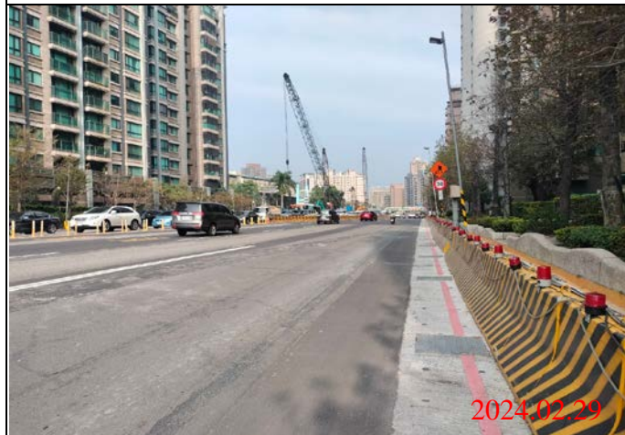
巡查日期地點：113.02.29/ Y23車站 照片說明：路面狀況