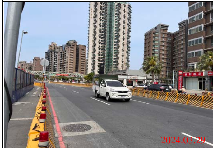
巡查日期地點：113.03.29/ Y23車站 照片說明：路面狀況