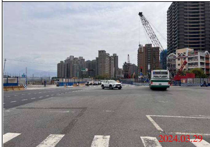
巡查日期地點：113.03.29/ Y22車站 照片說明：路面狀況