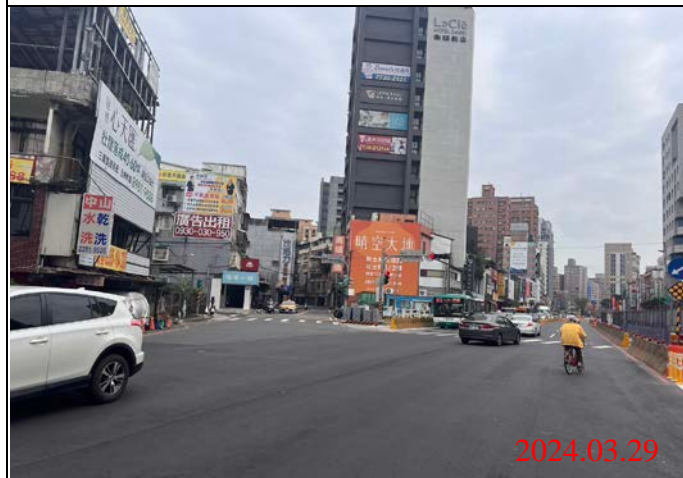
巡查日期地點：113.03.29/ Y21車站 照片說明：路面狀況