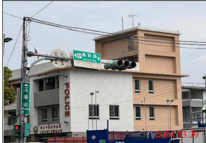
巡查日期地點：113.03.29/ Y22車站 照片說明：牌面設置狀況