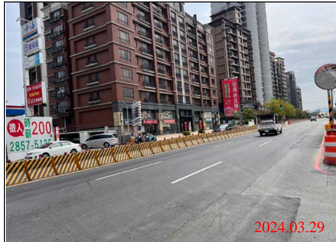
巡查日期地點：113.03.29/ Y23車站 照片說明：路面狀況