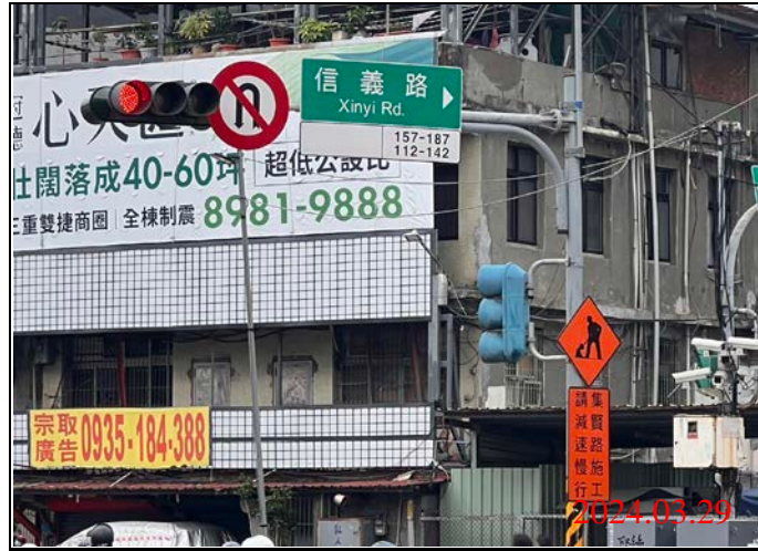
巡查日期地點：113.03.29/ Y21車站 照片說明：牌面設置狀況