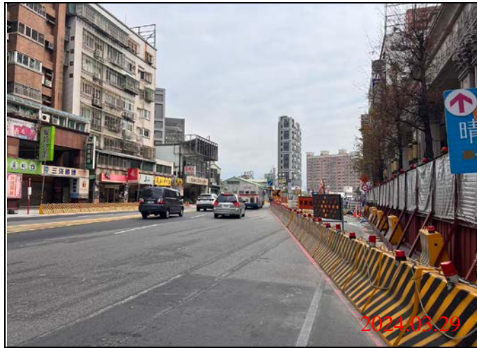
巡查日期地點：113.03.29/ Y22車站 照片說明：路面狀況