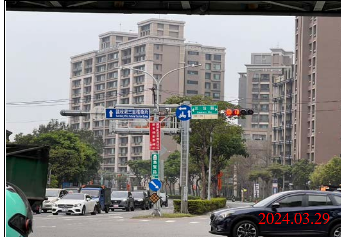
巡查日期地點：113.03.29/ Y23車站 照片說明：牌面設置狀況