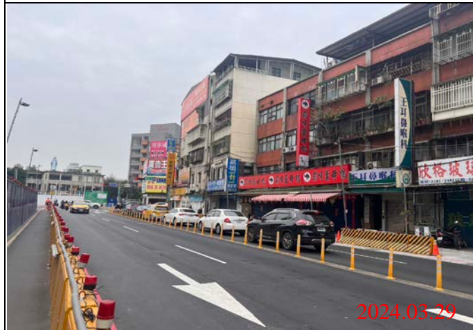
巡查日期地點：113.03.29/ Y21車站 照片說明：路面狀況