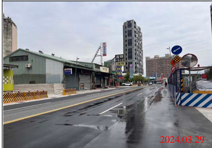
巡查日期地點：113.03.29/ Y22車站 照片說明：路面狀況