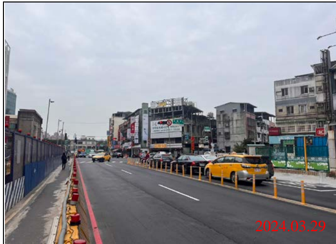
巡查日期地點：113.03.29/ Y21車站 照片說明：路面狀況