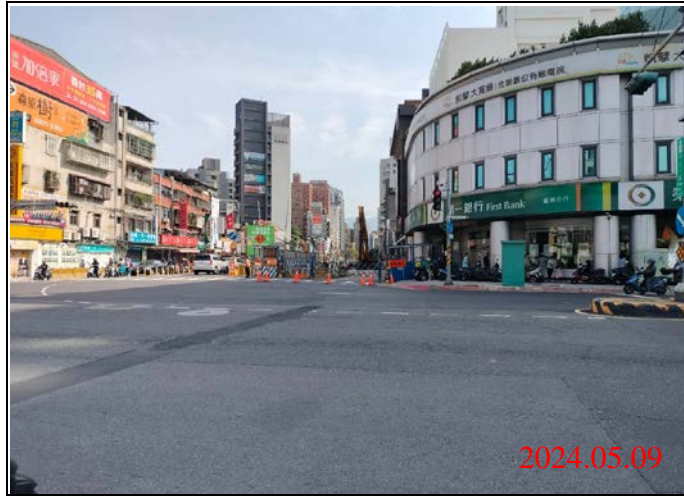
巡查日期地點：113.05.09/ Y21車站 照片說明：路面狀況