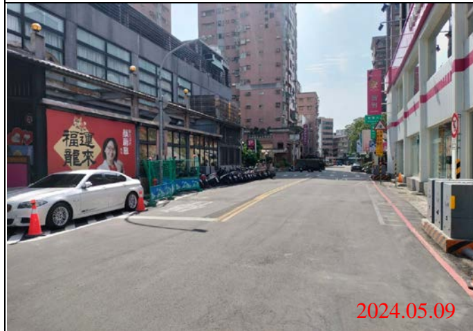
巡查日期地點：113.05.09/ Y21車站 照片說明：路面狀況