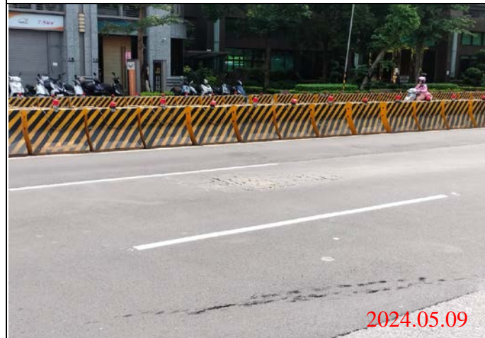
巡查日期地點：113.05.09/ Y23車站 照片說明：道路坑洞