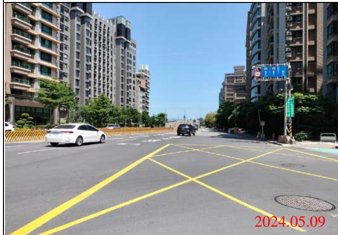
巡查日期地點：113.05.09/ Y23車站 照片說明：路面狀況