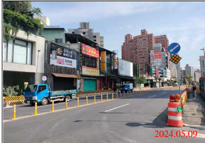
巡查日期地點：113.05.09/ Y21車站 照片說明：路面狀況