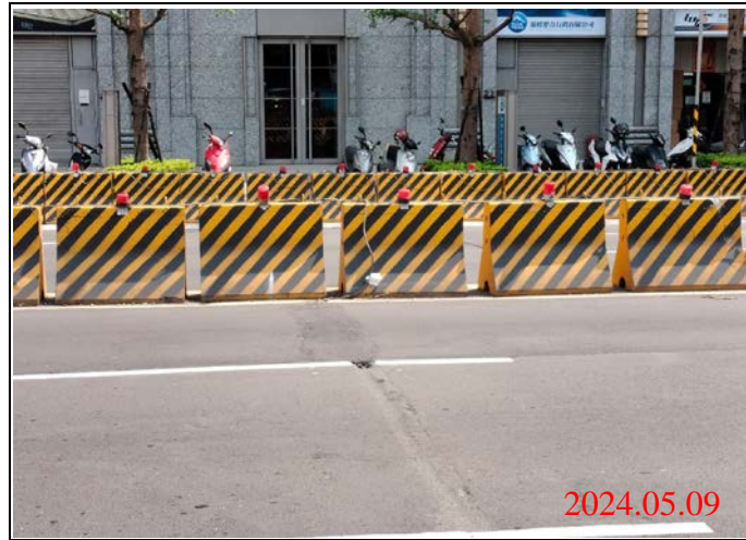
巡查日期地點：113.05.09/ Y23車站 照片說明：道路龜裂