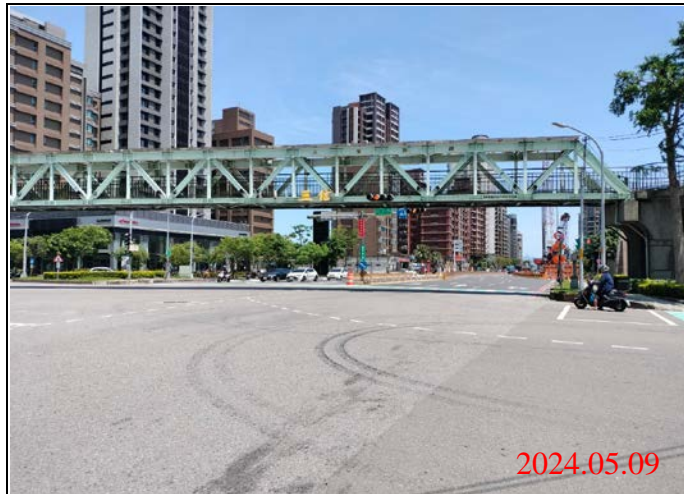
巡查日期地點：113.05.09/ Y23車站 照片說明：路面狀況