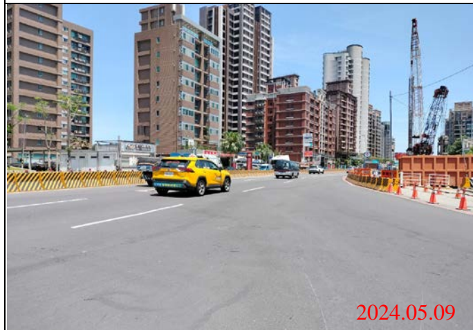
巡查日期地點：113.05.09/ Y23車站 照片說明：路面狀況