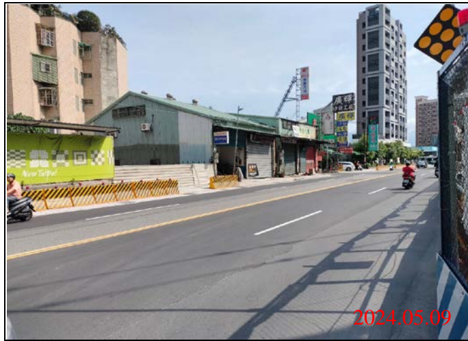
巡查日期地點：113.05.09/ Y22車站 照片說明：路面狀況