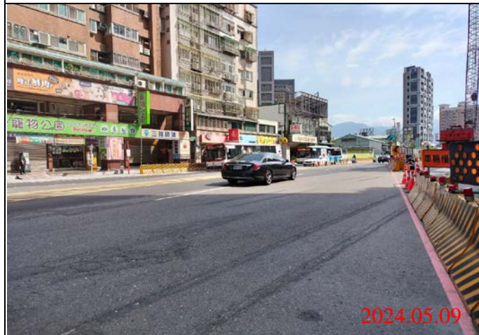
巡查日期地點：113.05.09/ Y22車站 照片說明：路面狀況