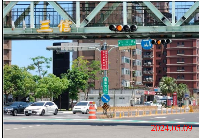
巡查日期地點：113.05.09/ Y23車站 照片說明：牌面設置狀況