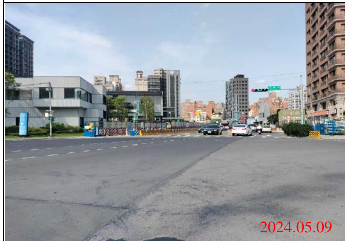
巡查日期地點：113.05.09/ Y22車站 照片說明：路面狀況