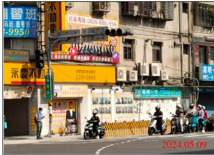
巡查日期地點：113.05.09/ Y21車站 照片說明：牌面設置狀況