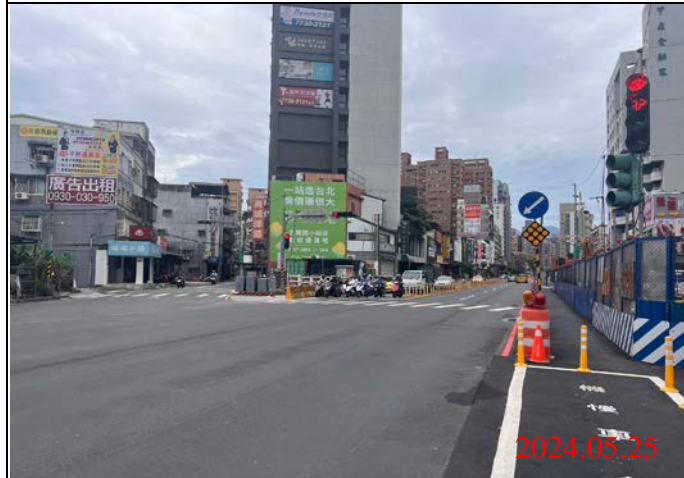
巡查日期地點：113.05.25/ Y21車站 照片說明：路面狀況