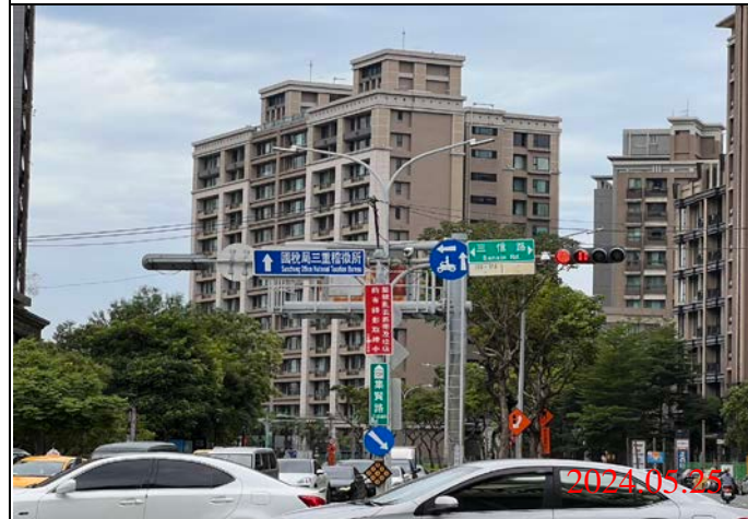
巡查日期地點：113.05.25/ Y23車站 照片說明：牌面設置狀況