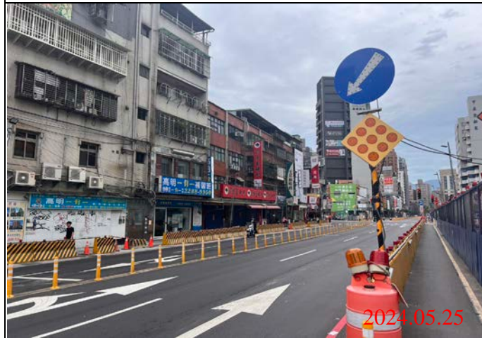
巡查日期地點：113.05.25/ Y21車站 照片說明：路面狀況