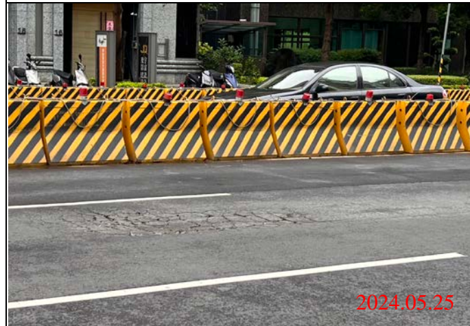
巡查日期地點：113.05.25/ Y23車站 照片說明：南側道路坑洞