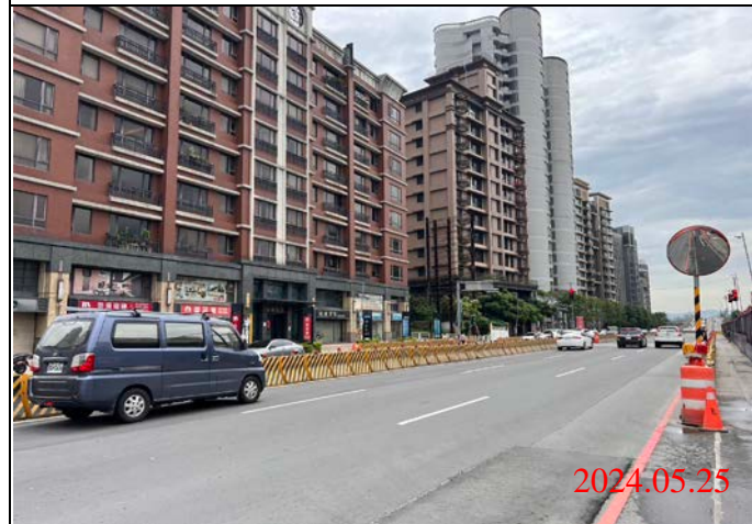
巡查日期地點：113.05.25/ Y23車站 照片說明：路面狀況