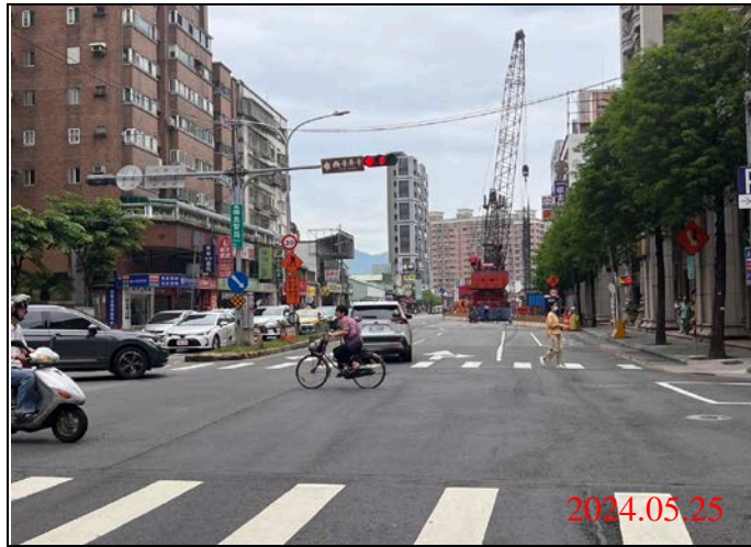
巡查日期地點：113.05.25/ Y22車站 照片說明：路面狀況