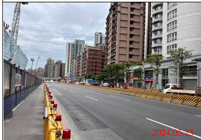
巡查日期地點：113.05.25/ Y23車站 照片說明：路面狀況