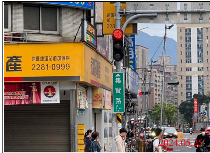
巡查日期地點：113.05.25/ Y21車站 照片說明：牌面設置狀況