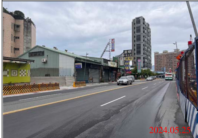
巡查日期地點：113.05.25/ Y22車站 照片說明：路面狀況