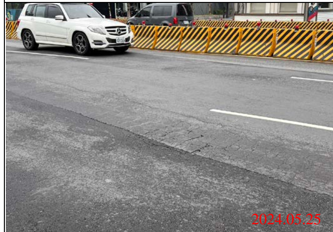
巡查日期地點：113.05.25/ Y23車站 照片說明：南側道路龜裂