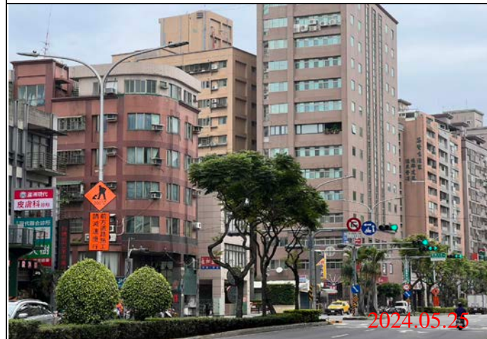
巡查日期地點：113.05.25/ Y22車站 照片說明：牌面設置狀況