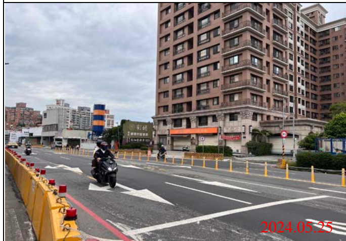
巡查日期地點：113.05.25/ Y22車站 照片說明：路面狀況