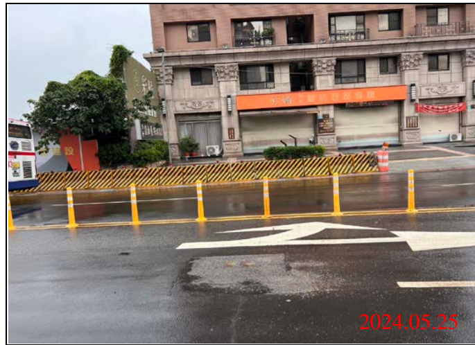
巡查日期地點：113.05.25/ Y22車站 照片說明：南側道路龜裂