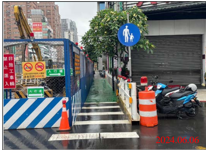
巡查日期地點：113.06.06/ Y21車站 照片說明：牌面設置狀況