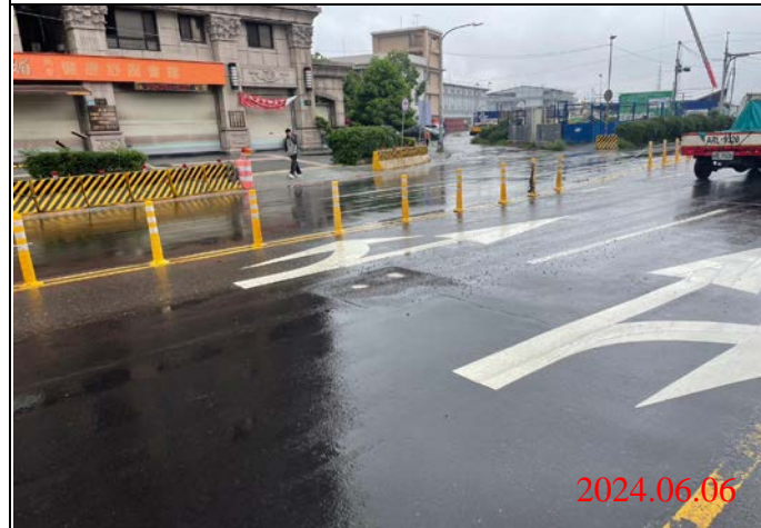
巡查日期地點：113.06.06/ Y22車站 照片說明：路面損壞情況