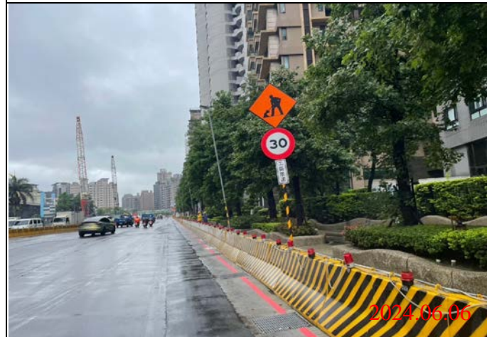
巡查日期地點：113.06.06/ Y23車站 照片說明：牌面設置狀況