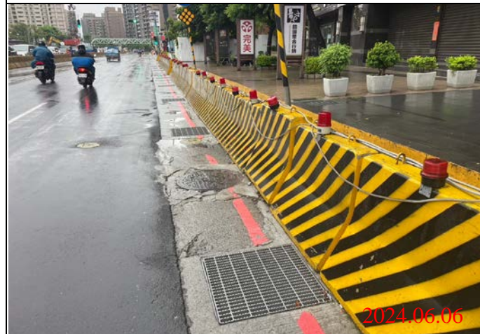
巡查日期地點：113.06.06/ Y23車站 照片說明：路面損壞情況