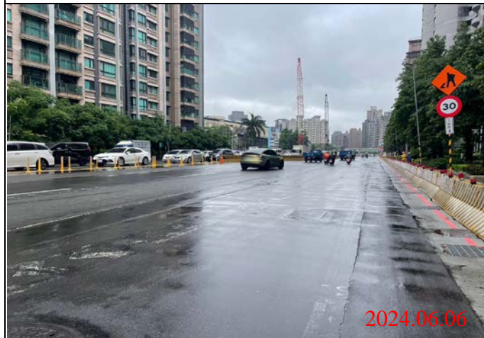
巡查日期地點：113.06.06/ Y23車站 照片說明：路面狀況