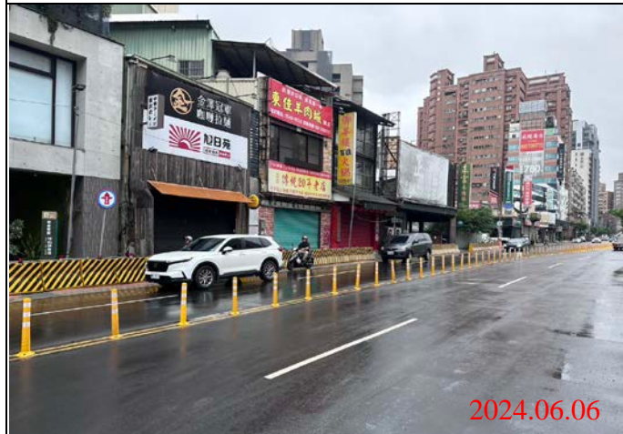
巡查日期地點：113.06.06/ Y21車站 照片說明：路面狀況