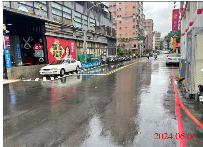
巡查日期地點：113.06.06/ Y21車站 照片說明：路面狀況