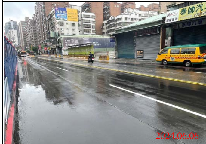
巡查日期地點：113.06.06/ Y22車站 照片說明：路面狀況