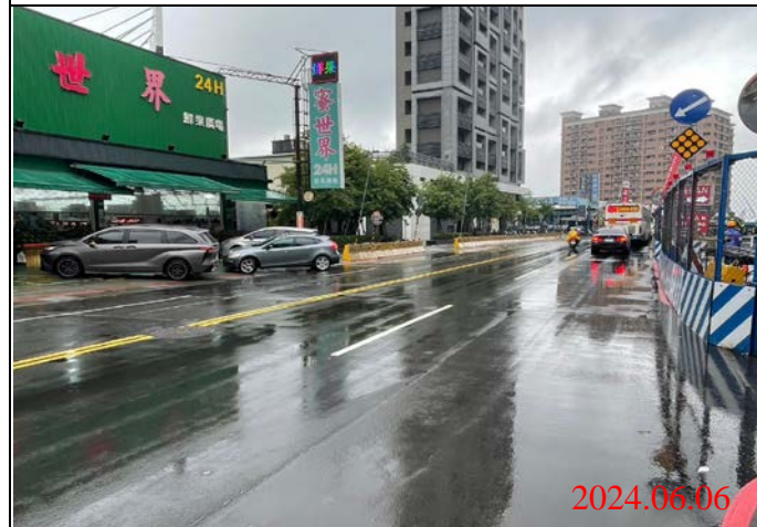
巡查日期地點：113.06.06/ Y22車站 照片說明：牌面設置狀況