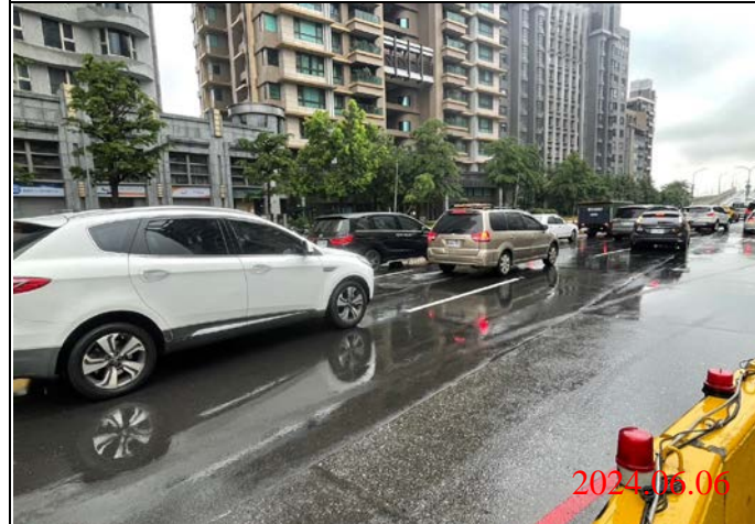
巡查日期地點：113.06.06/ Y23車站 照片說明：路面損壞情況