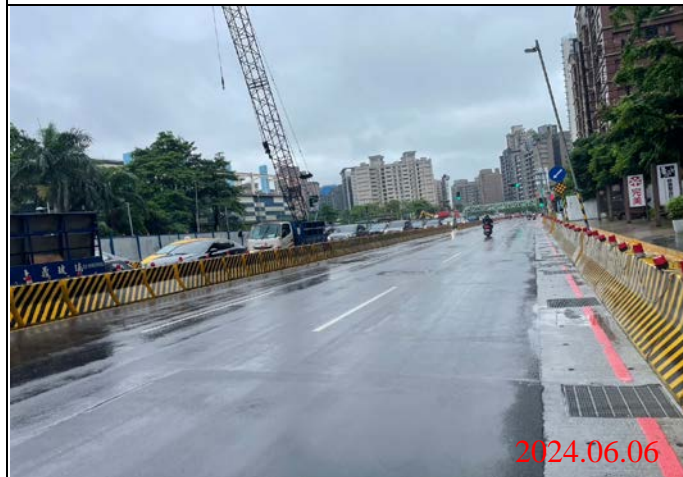
巡查日期地點：113.06.06/ Y23車站 照片說明：路面狀況