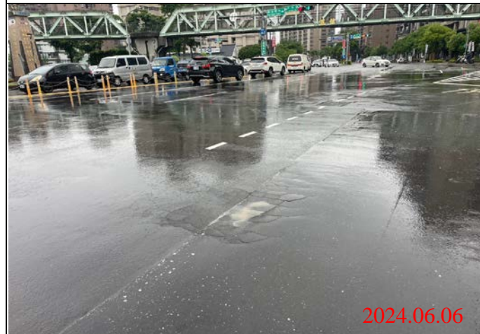
巡查日期地點：113.06.06/ Y23車站 照片說明：路面損壞情況