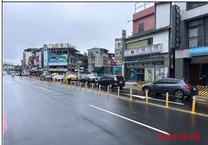
巡查日期地點：113.06.06/ Y21車站 照片說明：路面狀況