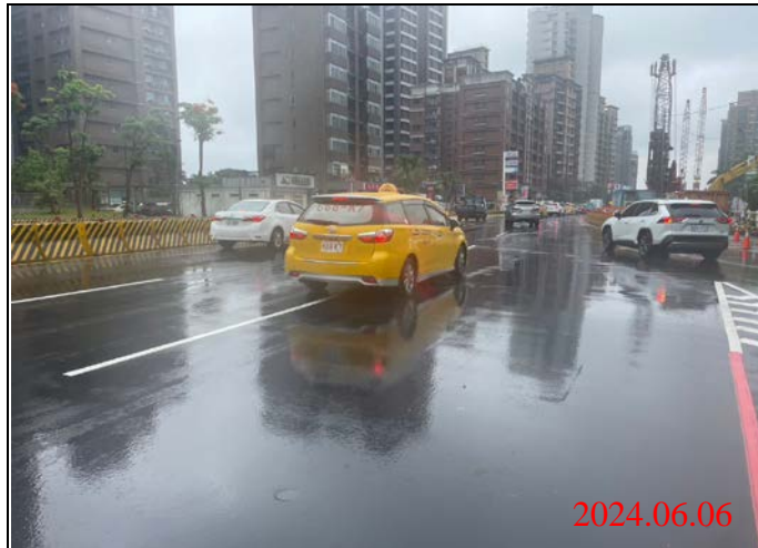
巡查日期地點：113.06.06/ Y23車站 照片說明：路面狀況