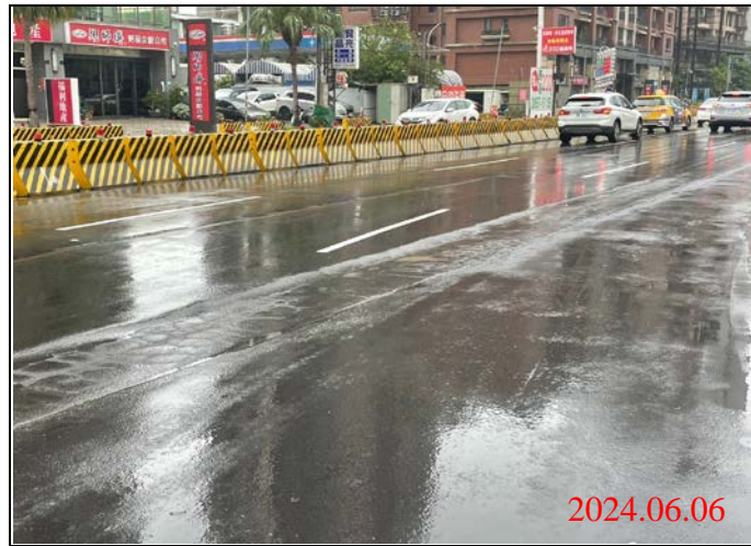
巡查日期地點：113.06.06/ Y32車站 照片說明：路面損壞情況