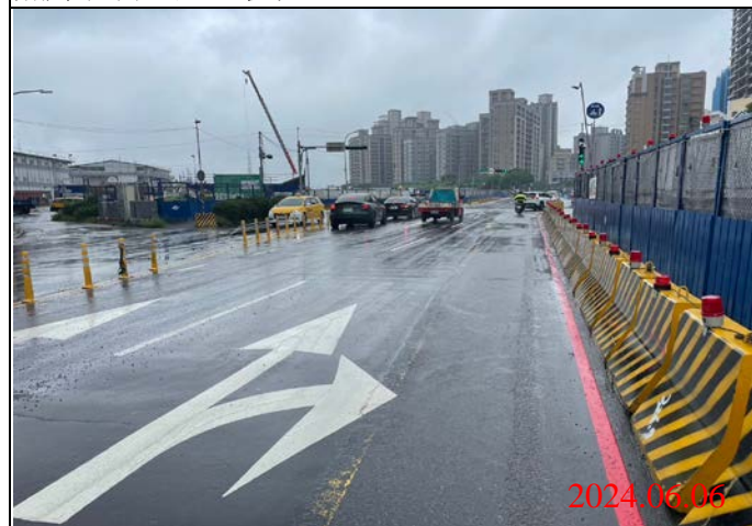
巡查日期地點：113.06.06/ Y22車站 照片說明：路面狀況