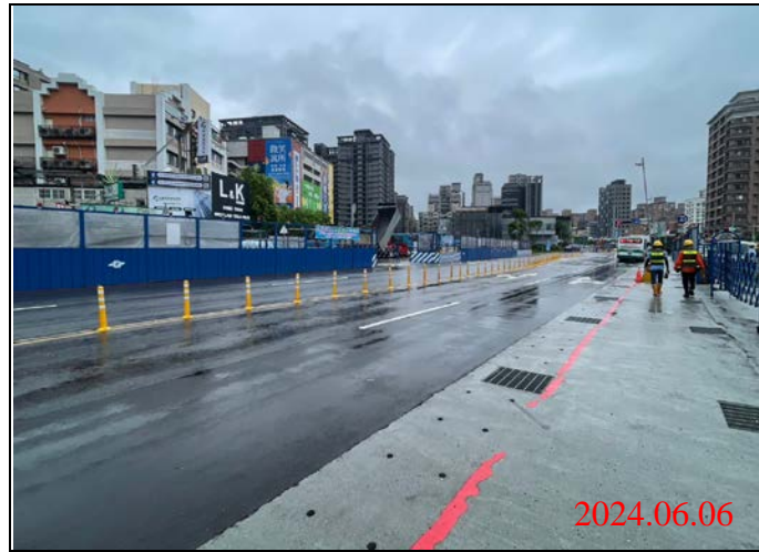
巡查日期地點：113.06.06/ Y22車站 照片說明：路面狀況