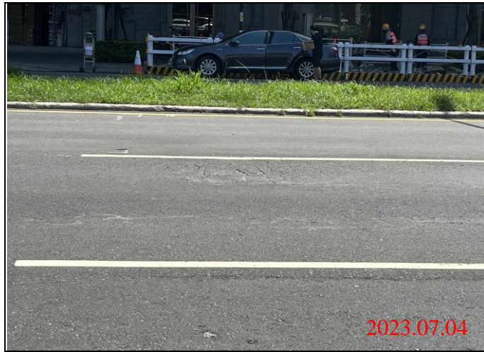
巡查日期地點：112.07.04/ Y23車站 照片說明：路面龜裂狀況