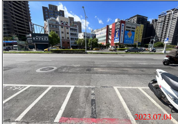
巡查日期地點：112.07.04/ Y22車站 照片說明：路面龜裂狀況