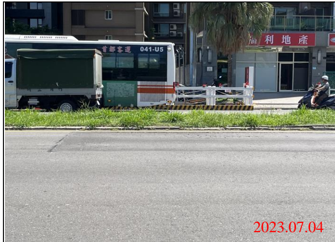
巡查日期地點：112.07.04/ Y23車站 照片說明：路面龜裂狀況