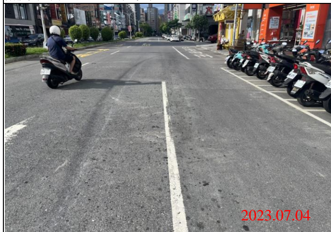
巡查日期地點：112.07.04/ Y21車站 照片說明：路面龜裂狀況