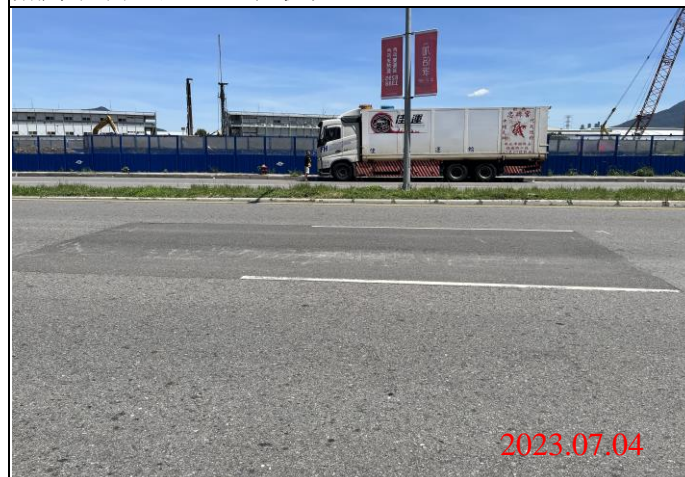
巡查日期地點：112.07.04/ Y2車站 照片說明：路面龜裂狀況