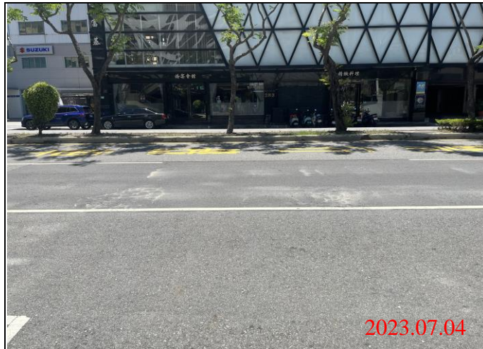
巡查日期地點：112.07.04/ Y21車站 照片說明：路面龜裂狀況