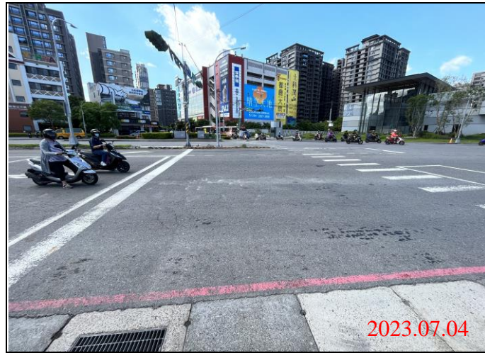
巡查日期地點：112.07.04/ Y22車站 照片說明：路面龜裂狀況