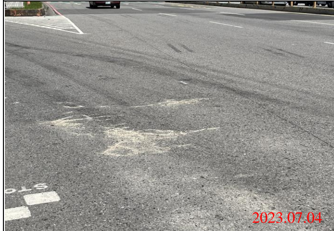
巡查日期地點：112.07.04/ Y23車站 照片說明：路面龜裂狀況