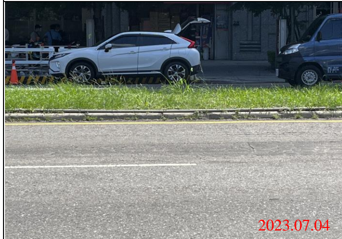
巡查日期地點：112.07.04/ Y23車站 照片說明：路面龜裂狀況