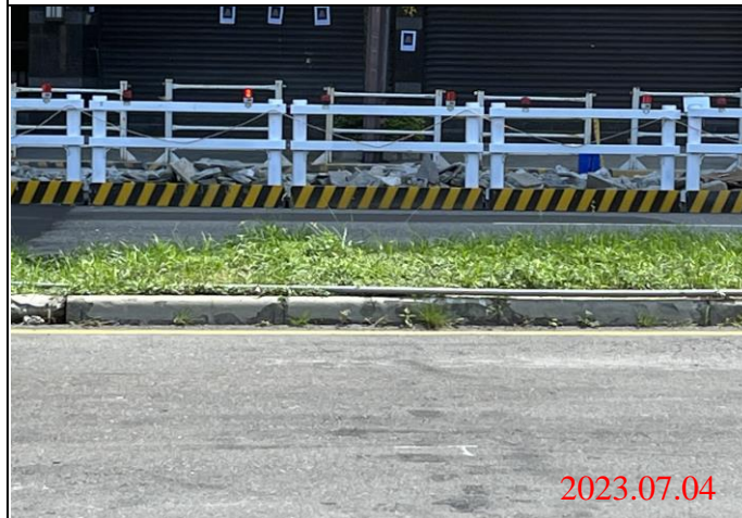
巡查日期地點：112.07.04/ Y23車站 照片說明：路面龜裂狀況