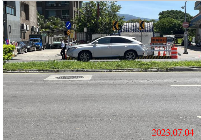
巡查日期地點：112.07.04/ Y23車站 照片說明：路面龜裂狀況