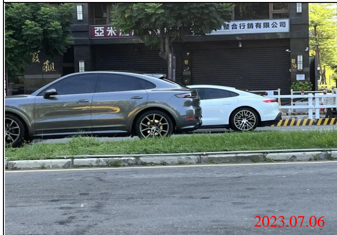
巡查日期地點：112.07.06/ Y23車站 照片說明：路面龜裂狀況