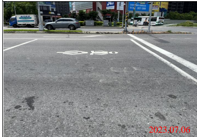
巡查日期地點：112.07.06/ Y22車站 照片說明：路面龜裂狀況