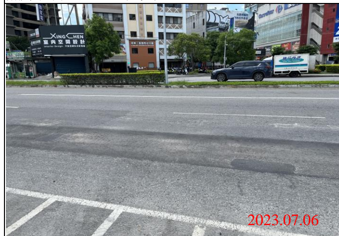
巡查日期地點：112.07.06/ Y2車站 照片說明：路面龜裂狀況