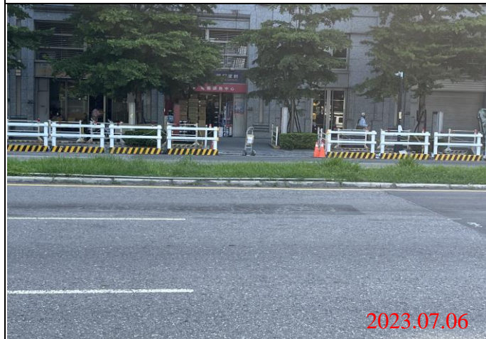
巡查日期地點：112.07.06/ Y23車站 照片說明：路面龜裂狀況