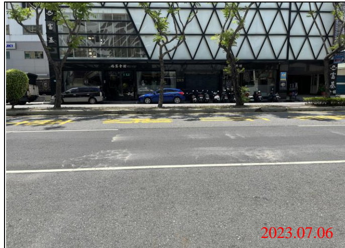
巡查日期地點：112.07.06/ Y21車站 照片說明：路面龜裂狀況