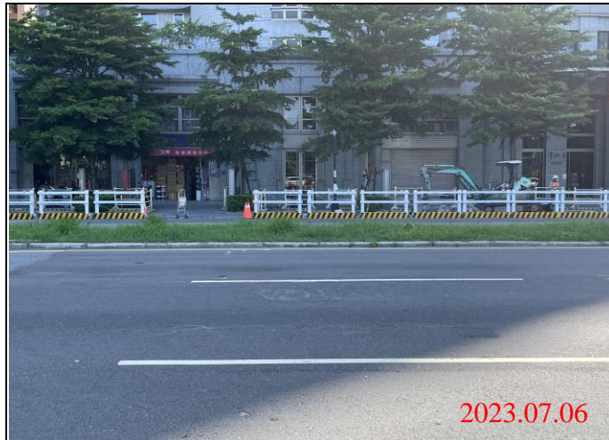
巡查日期地點：112.07.06/ Y23車站 照片說明：路面龜裂狀況