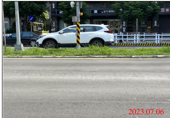
巡查日期地點：112.07.06/ Y23車站 照片說明：路面龜裂狀況