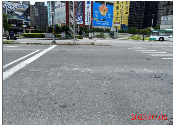
巡查日期地點：112.07.06/ Y22車站 照片說明：路面龜裂狀況