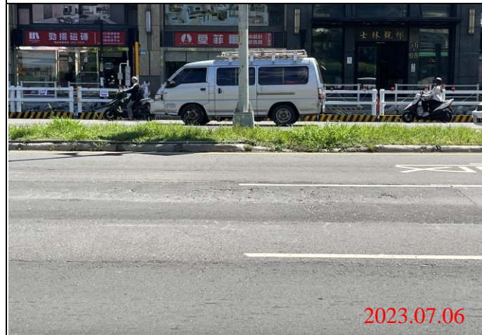
巡查日期地點：112.07.06/ Y23車站 照片說明：路面龜裂狀況