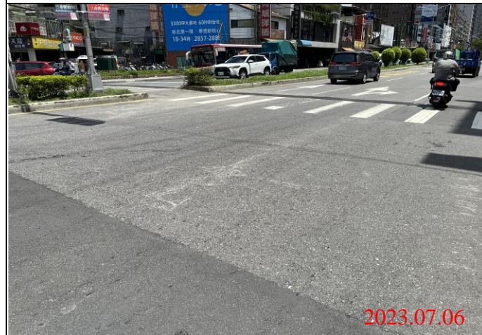
巡查日期地點：112.07.06/ Y21車站 照片說明：路面龜裂狀況