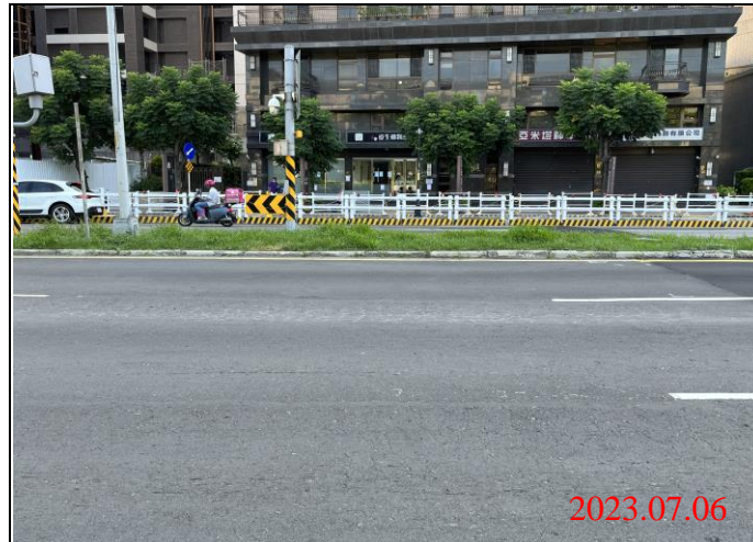
巡查日期地點：112.07.06/ Y23車站 照片說明：路面龜裂狀況