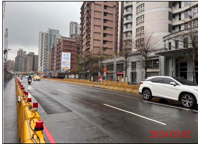
巡查日期地點：113.03.02/ Y23車站 照片說明：路面狀況