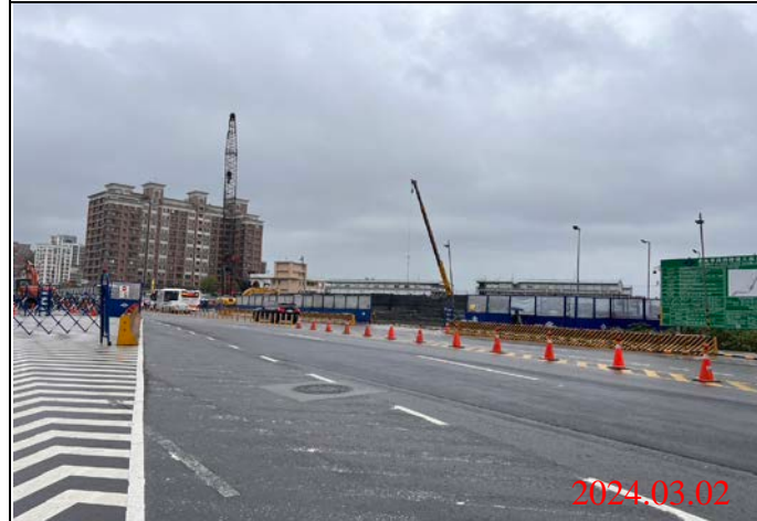
巡查日期地點：113.03.02/ Y22車站 照片說明：路面狀況