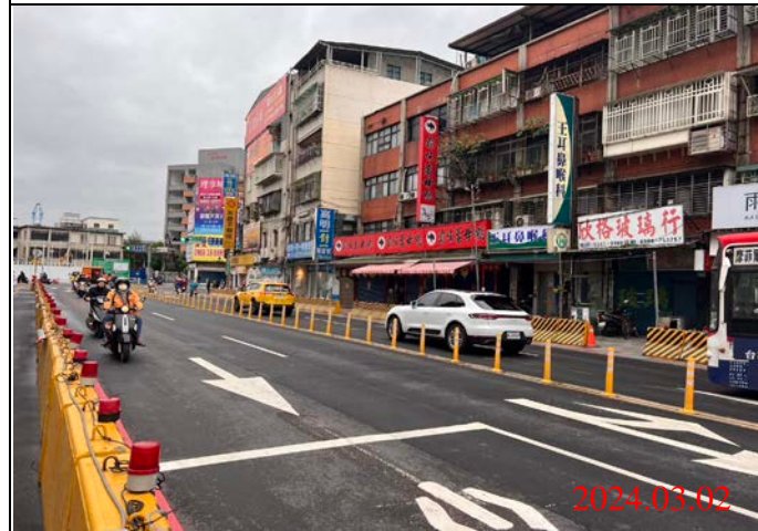
巡查日期地點：113.03.02/ Y21車站 照片說明：路面狀況