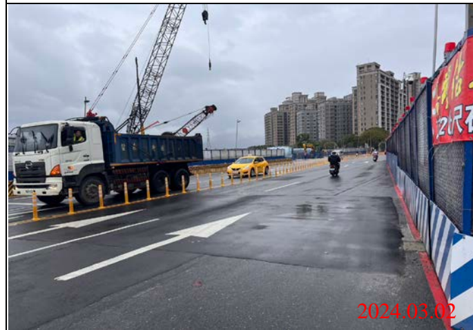
巡查日期地點：113.03.02/ Y22車站 照片說明：路面狀況