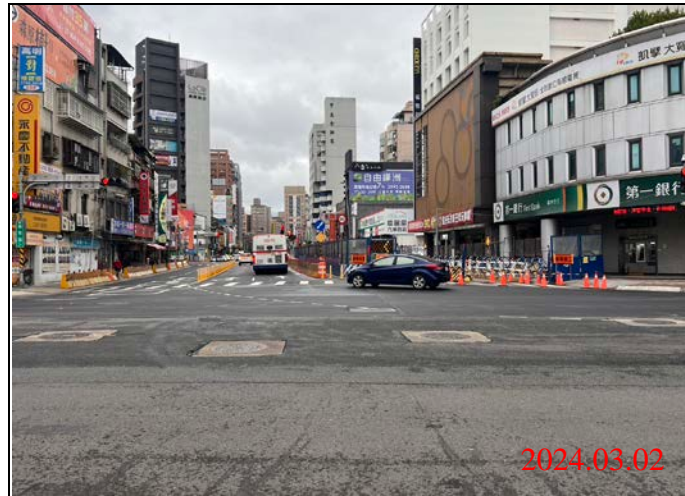
巡查日期地點：113.03.02/ Y21車站 照片說明：路面狀況