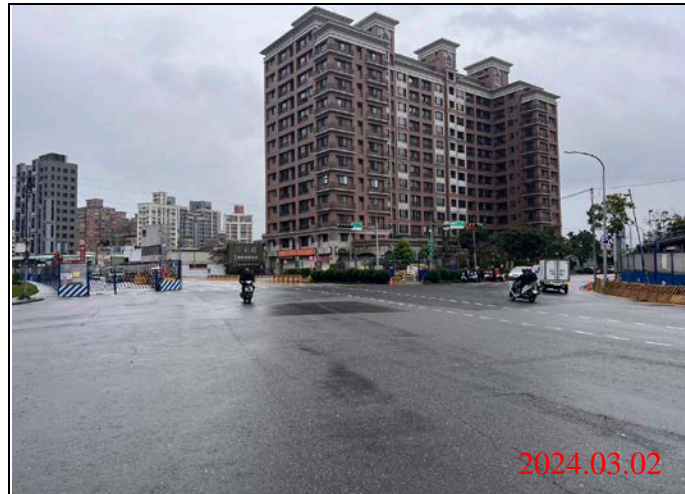
巡查日期地點：113.03.02/ Y22車站 照片說明：路面狀況