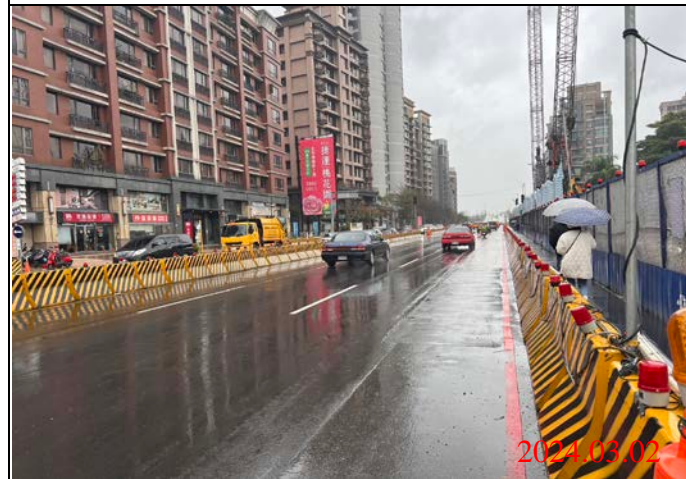
巡查日期地點：113.03.02/ Y23車站 照片說明：路面狀況