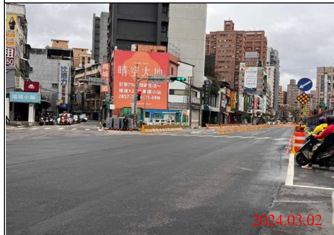
巡查日期地點：113.03.02/ Y21車站 照片說明：路面狀況