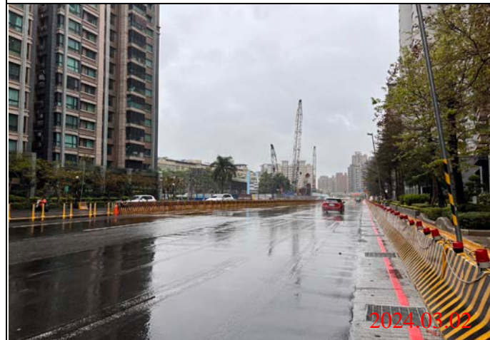
巡查日期地點：113.03.02/ Y23車站 照片說明：路面狀況