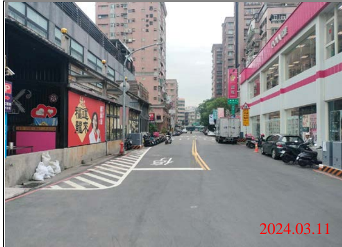
巡查日期地點：113.03.11/ Y21車站 照片說明：路面狀況