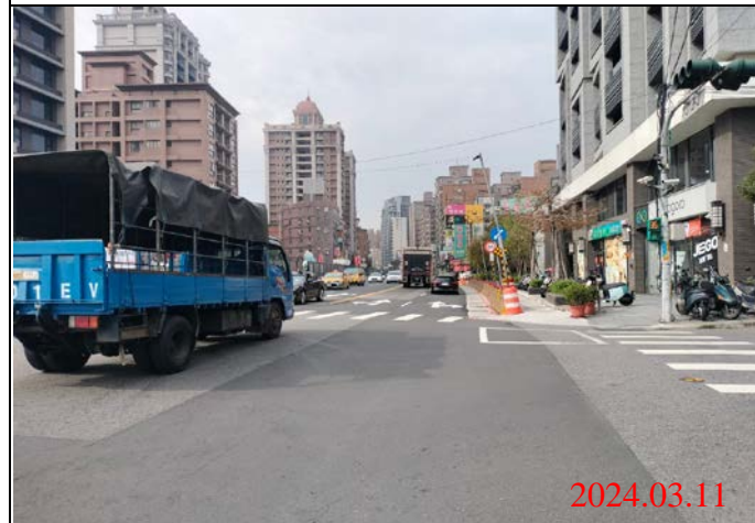
巡查日期地點：113.03.11/ Y22車站 照片說明：路面狀況