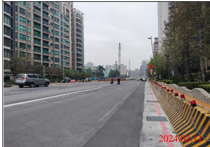
巡查日期地點：113.03.11/ Y23車站 照片說明：路面狀況