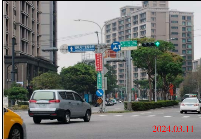
巡查日期地點：113.03.11/ Y23車站 照片說明：牌面設置狀況