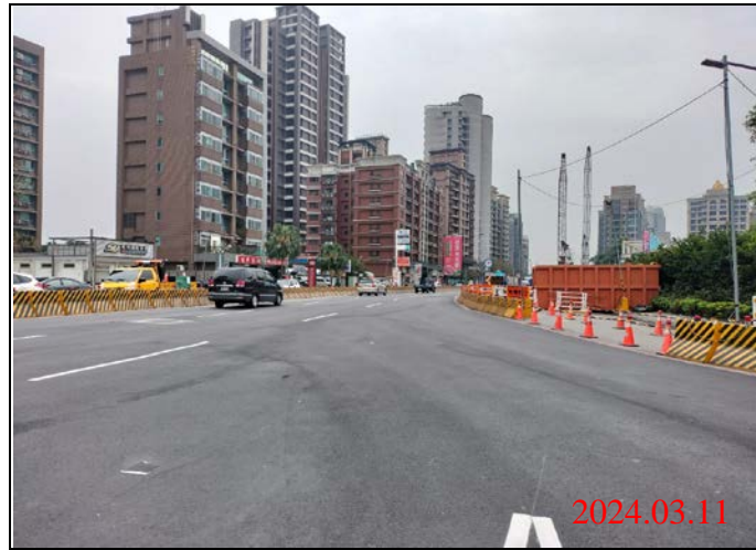
巡查日期地點：113.03.11/ Y23車站 照片說明：路面狀況