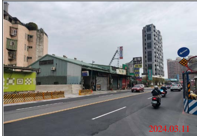
巡查日期地點：113.03.11/ Y22車站 照片說明：路面狀況