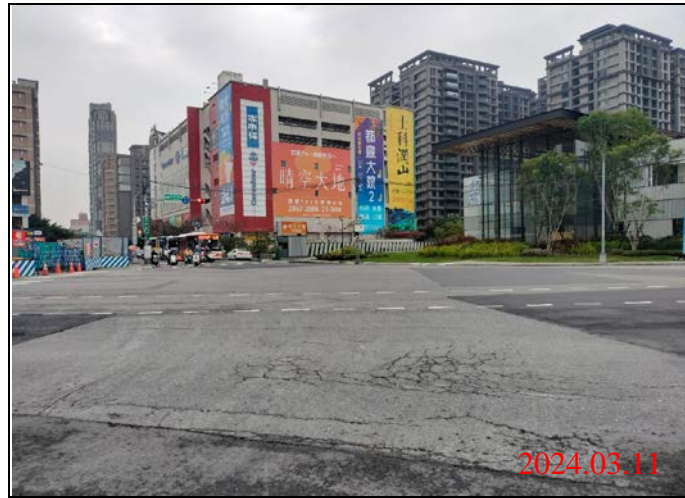
巡查日期地點：113.03.11/ Y22車站 照片說明：路面狀況