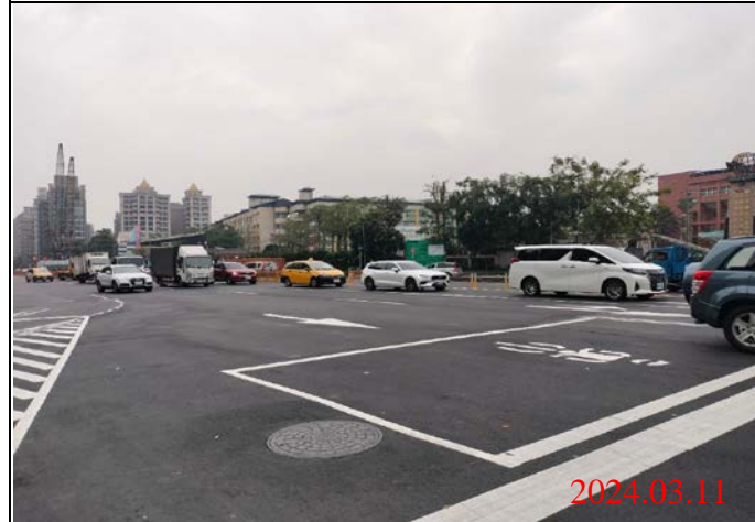
巡查日期地點：113.03.11/ Y23車站 照片說明：路面狀況