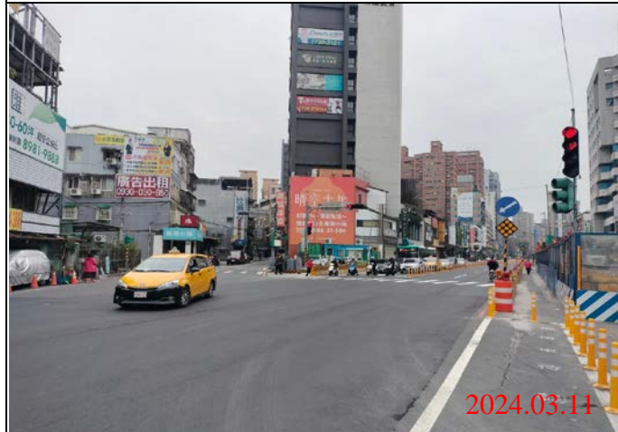
巡查日期地點：113.03.11/ Y21車站 照片說明：路面狀況