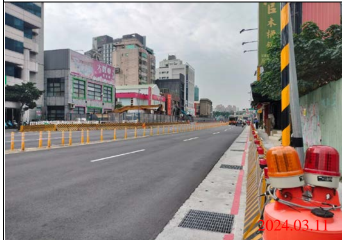
巡查日期地點：113.03.11/ Y21車站 照片說明：路面狀況