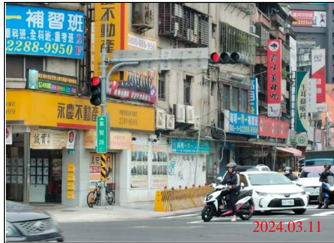
巡查日期地點：113.03.11/ Y21車站 照片說明：牌面設置狀況