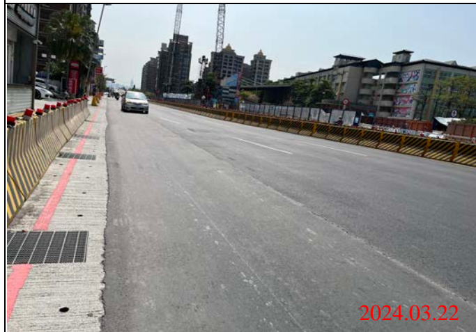
巡查日期地點：113.03.22/ Y23車站 照片說明：路面狀況