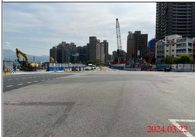
巡查日期地點：113.03.22/ Y22車站 照片說明：路面狀況