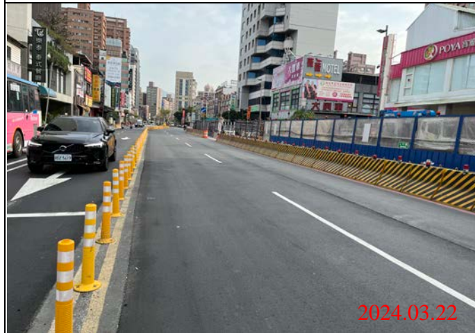
巡查日期地點：113.03.22/ Y21車站 照片說明：路面狀況