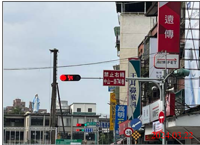
巡查日期地點：113.03.22/ Y21車站 照片說明：牌面設置狀況