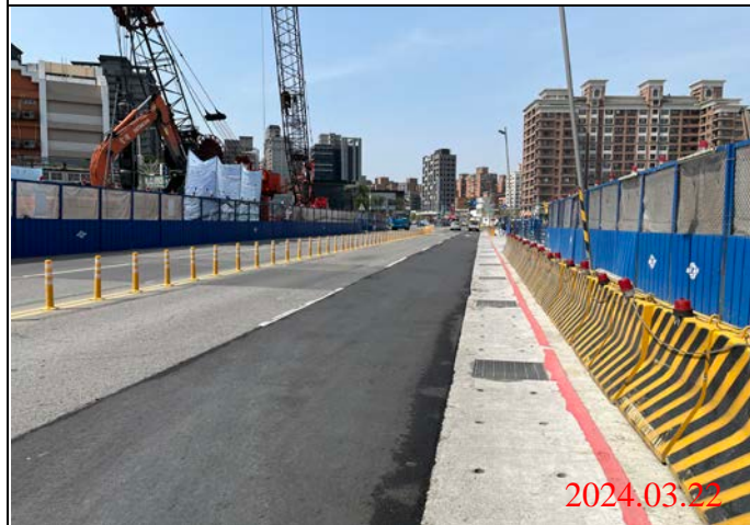
巡查日期地點：113.03.22/ Y22車站 照片說明：路面狀況