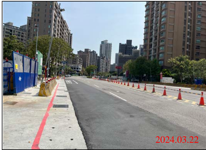
巡查日期地點：113.03.22/ Y22車站 照片說明：路面狀況