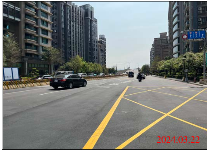
巡查日期地點：113.03.22/ Y23車站 照片說明：路面狀況