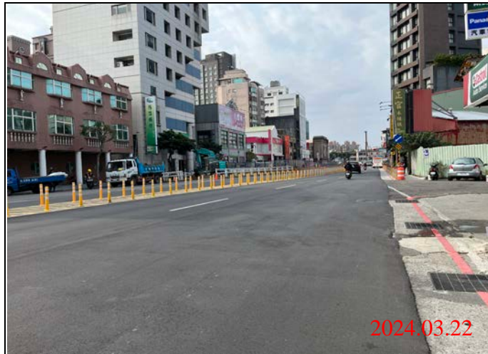
巡查日期地點：113.03.22/ Y21車站 照片說明：路面狀況