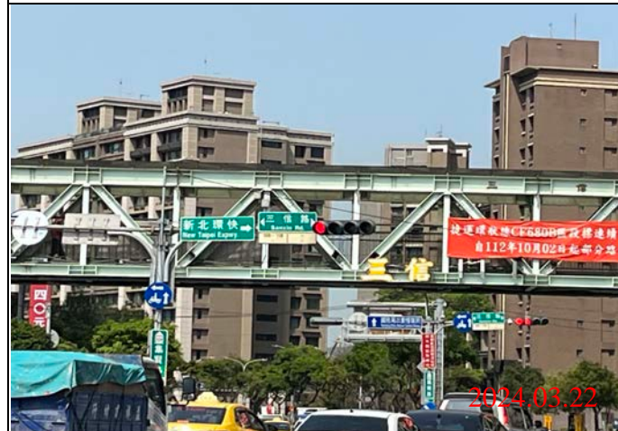
巡查日期地點：113.03.22/ Y23車站 照片說明：牌面設置狀況