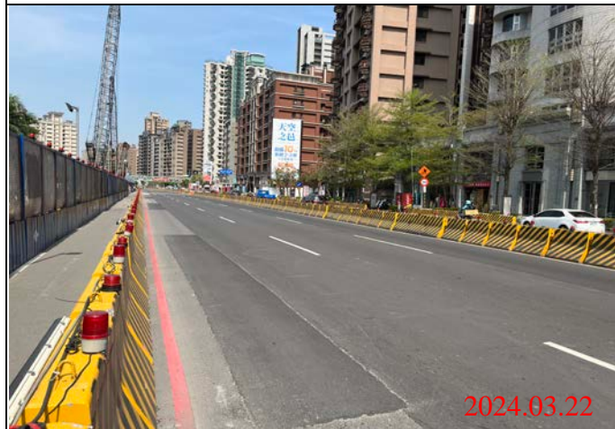
巡查日期地點：113.03.22/ Y23車站 照片說明：路面狀況