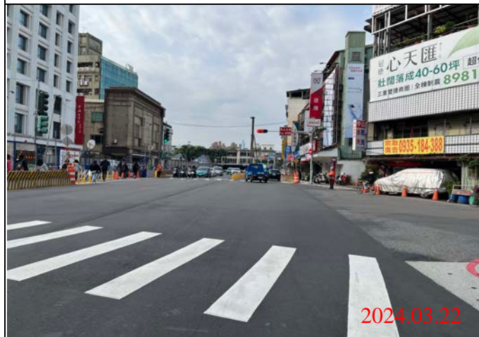
巡查日期地點：113.03.22/ Y21車站 照片說明：路面狀況