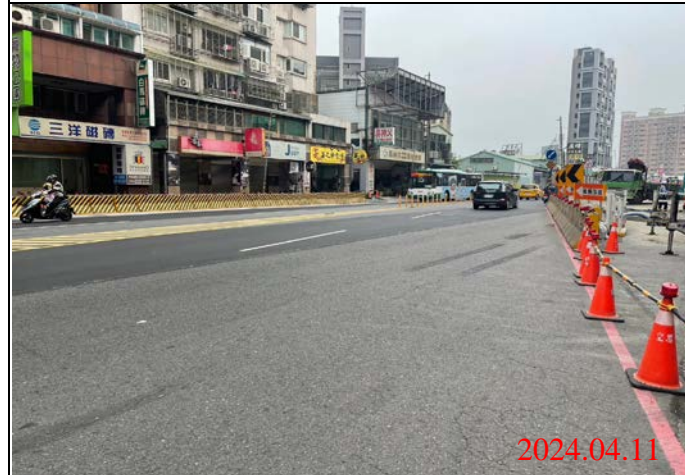
巡查日期地點：113.04.12/ Y22車站 照片說明：路面狀況