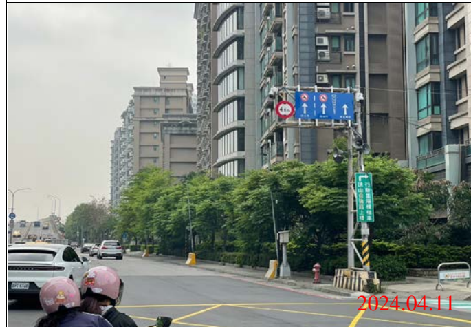
巡查日期地點：113.04.12/ Y23車站 照片說明：牌面設置狀況