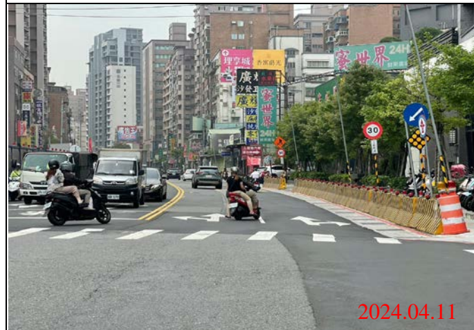
巡查日期地點：113.04.12/ Y22車站 照片說明：牌面設置狀況