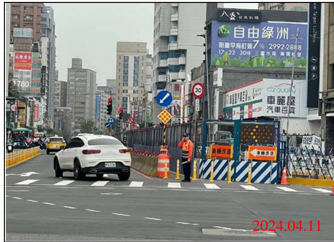
巡查日期地點：113.04.12/ Y21車站 照片說明：牌面設置狀況