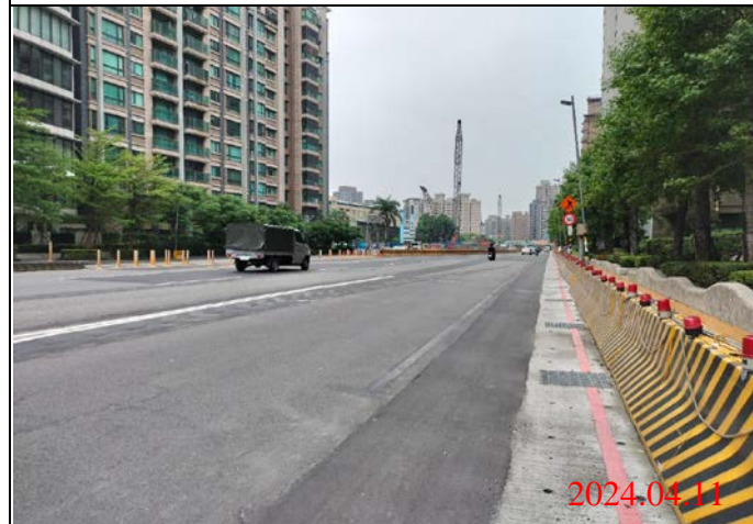
巡查日期地點：113.04.12/ Y23車站 照片說明：路面狀況