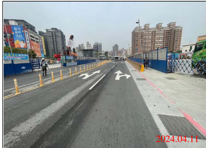
巡查日期地點：113.04.12/ Y22車站 照片說明：路面狀況