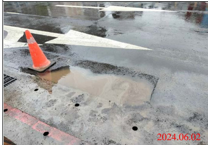
巡查日期地點：113.06.02/ Y22車站 照片說明：道路坑洞