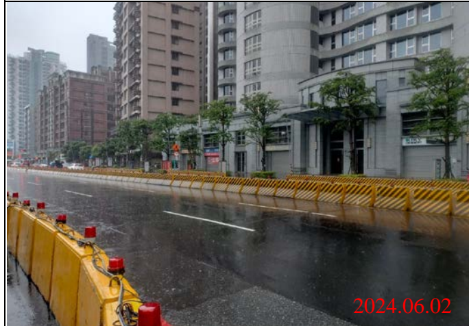
巡查日期地點：113.06.02/ Y23車站 照片說明：路面狀況