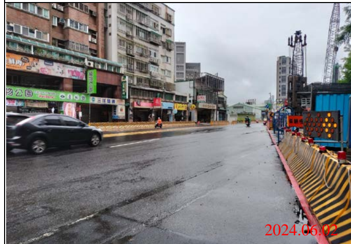
巡查日期地點：113.06.02/ Y22車站 照片說明：路面狀況