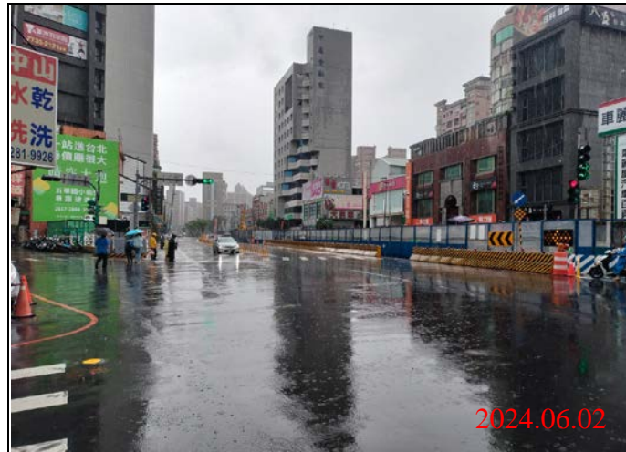
巡查日期地點：113.06.02/ Y21車站 照片說明：路面狀況