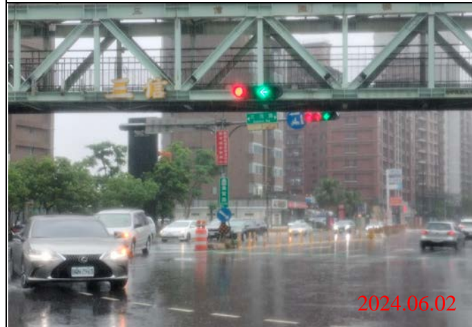
巡查日期地點：113.06.02/ Y23車站 照片說明：牌面設置狀況