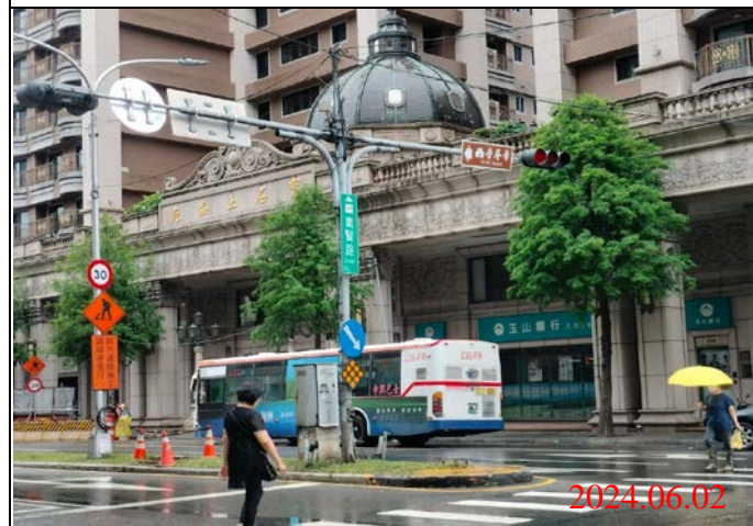
巡查日期地點：113.06.02/ Y22車站 照片說明：牌面設置狀況