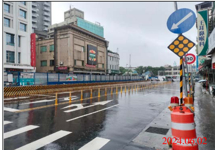
巡查日期地點：113.06.02/ Y21車站 照片說明：路面狀況