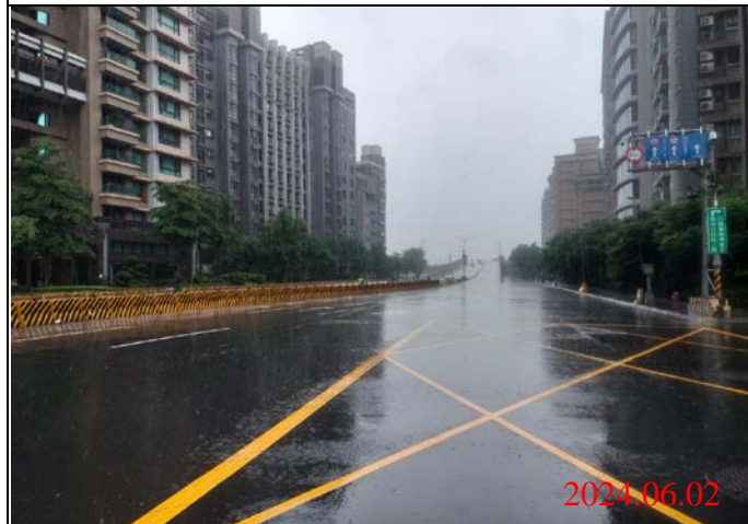
巡查日期地點：113.06.02/ Y23車站 照片說明：路面狀況