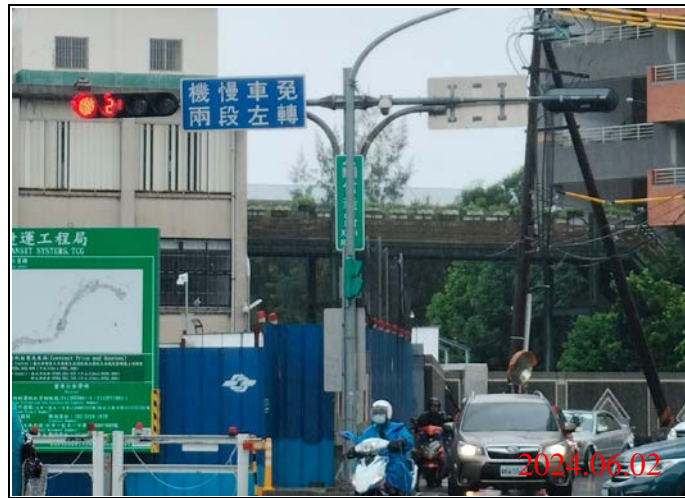
巡查日期地點：113.06.02/ Y21車站 照片說明：牌面設置狀況