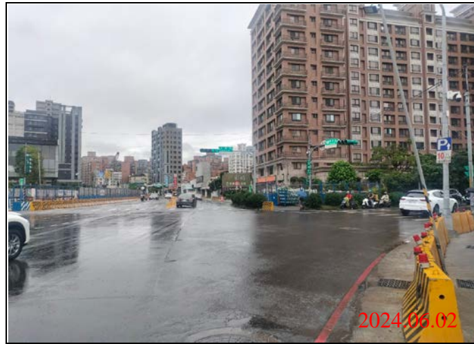
巡查日期地點：113.06.02/ Y22車站 照片說明：路面狀況