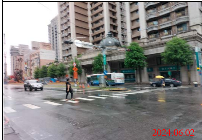
巡查日期地點：113.06.02/ Y22車站 照片說明：路面狀況