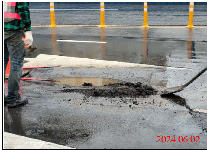
巡查日期地點：113.06.02/ Y22車站 照片說明：道路坑洞