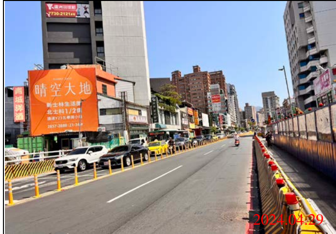
巡查日期地點：113.04.29/ Y21車站 照片說明：路面狀況