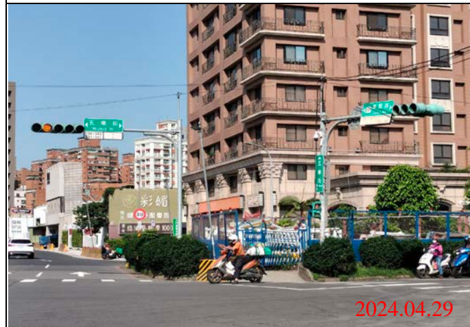
巡查日期地點：113.04.29/ Y22車站 照片說明：牌面設置狀況