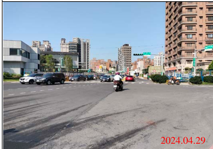
巡查日期地點：113.04.29/ Y22車站 照片說明：路面狀況