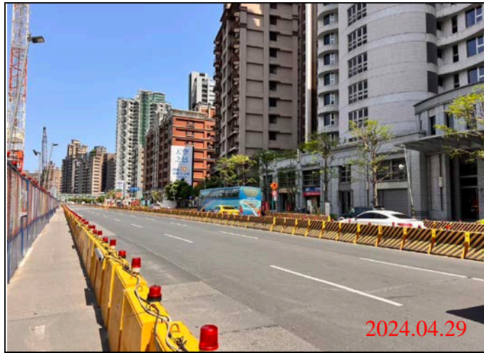
巡查日期地點：113.04.29/ Y23車站 照片說明：路面狀況