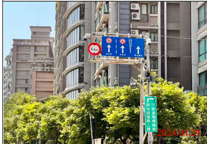
巡查日期地點：113.04.29/ Y23車站 照片說明：牌面設置狀況