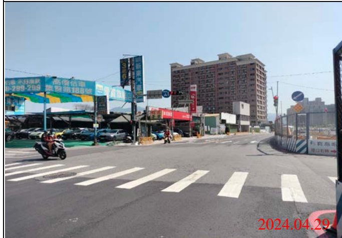
巡查日期地點：113.04.29/ Y22車站 照片說明：路面狀況