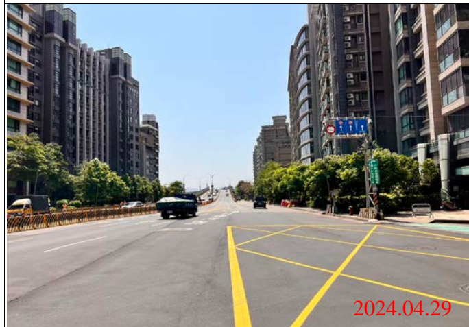
巡查日期地點：113.04.29/ Y23車站 照片說明：路面狀況