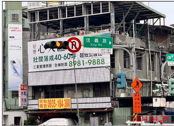
巡查日期地點：113.04.29/ Y21車站 照片說明：牌面設置狀況