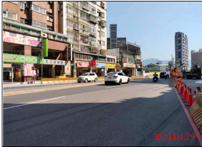
巡查日期地點：113.04.29/ Y22車站 照片說明：路面狀況