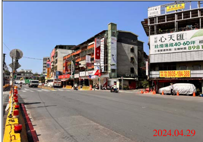
巡查日期地點：113.04.29/ Y21車站 照片說明：路面狀況