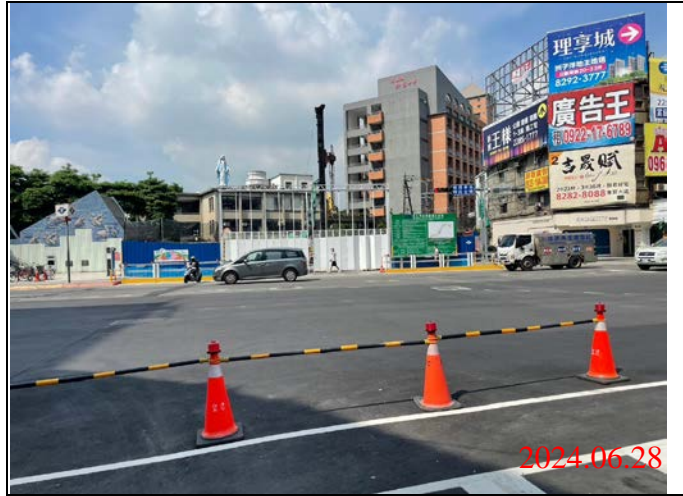
巡查日期地點：113.06.28/ Y21車站 照片說明：路面狀況