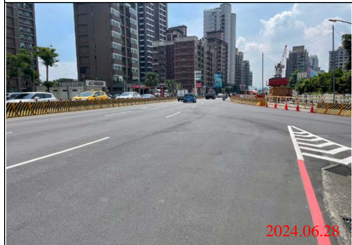
巡查日期地點：113.06.28/ Y23車站 照片說明：路面狀況