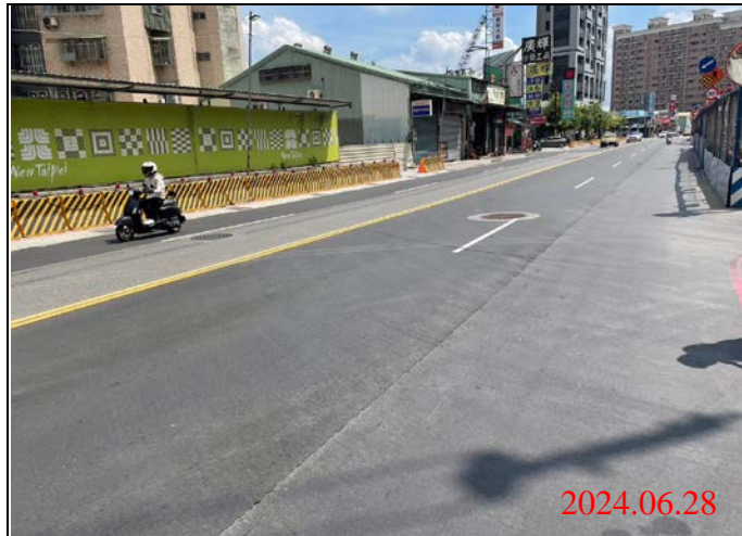
巡查日期地點：113.06.28/ Y22車站 照片說明：路面狀況