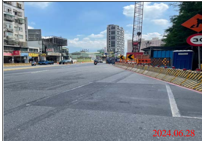
巡查日期地點：113.06.28/ Y22車站 照片說明：牌面設置狀況