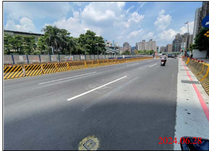
巡查日期地點：113.06.28/ Y23車站 照片說明：路面狀況