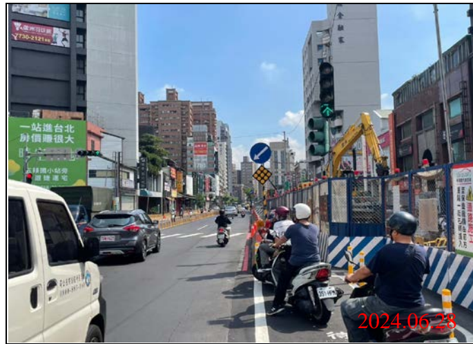
巡查日期地點：113.06.28/ Y21車站 照片說明：牌面設置狀況