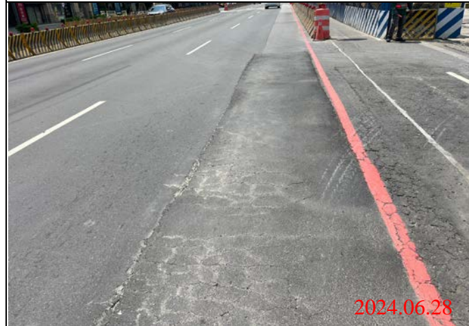
巡查日期地點：113.06.28/ Y23車站 照片說明：路面龜裂狀況