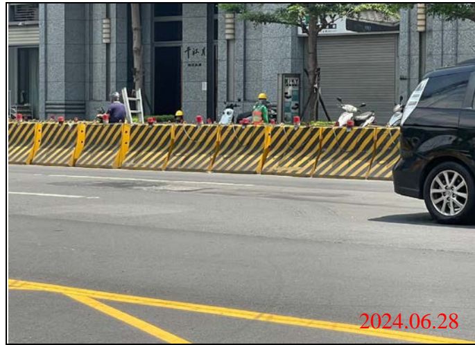
巡查日期地點：113.06.28/ Y23車站 照片說明：路面龜裂狀況