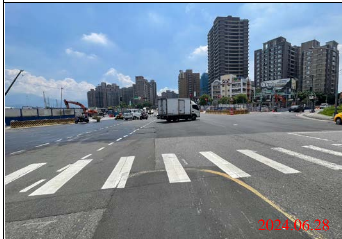
巡查日期地點：113.06.28/ Y22車站 照片說明：路面狀況