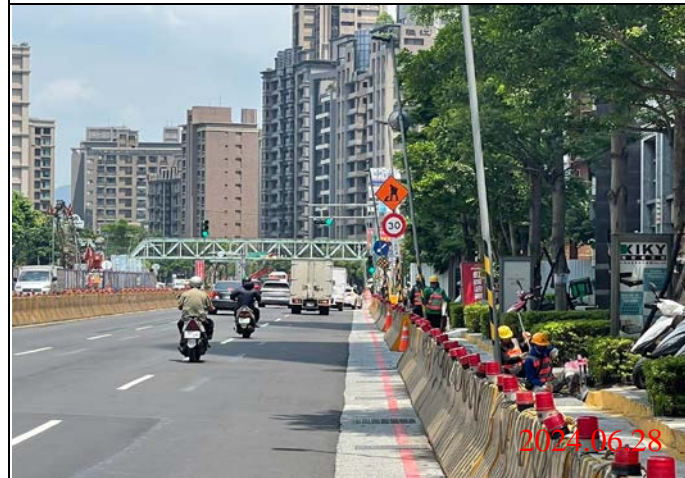
巡查日期地點：113.06.28/ Y23車站 照片說明：牌面設置狀況