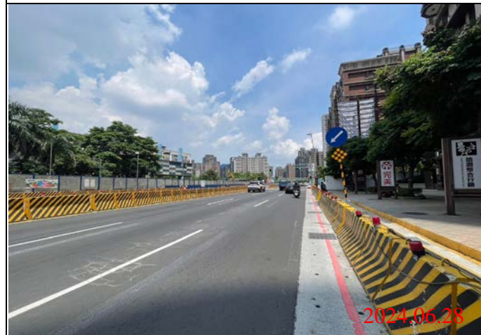
巡查日期地點：113.06.28/ Y23車站 照片說明：路面龜裂狀況