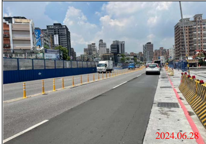
巡查日期地點：113.06.28/ Y22車站 照片說明：路面狀況