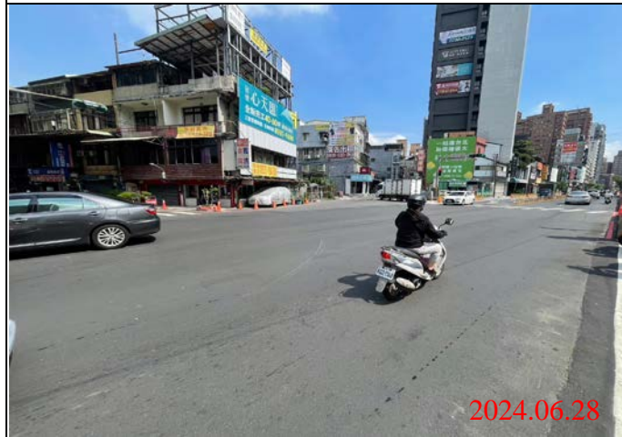
巡查日期地點：113.06.28/ Y21車站 照片說明：路面狀況