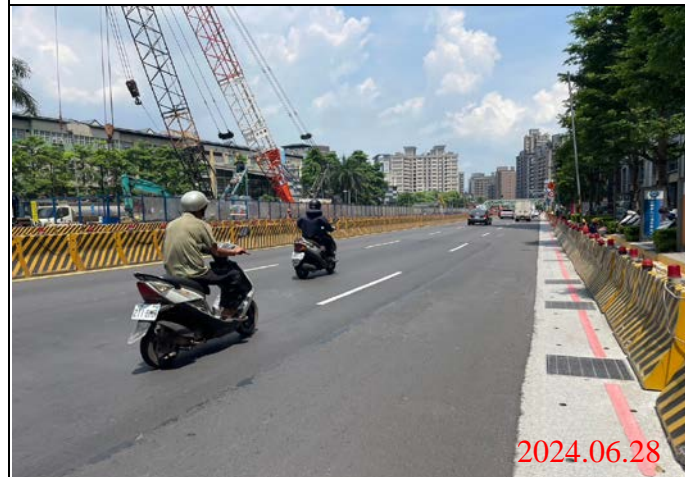
巡查日期地點：113.06.28/ Y23車站 照片說明：路面狀況