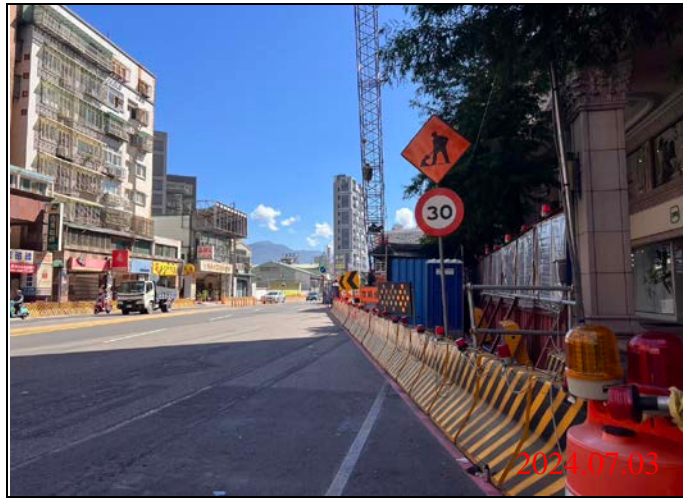
巡查日期地點：113.07.03/ Y22車站 照片說明：路面狀況