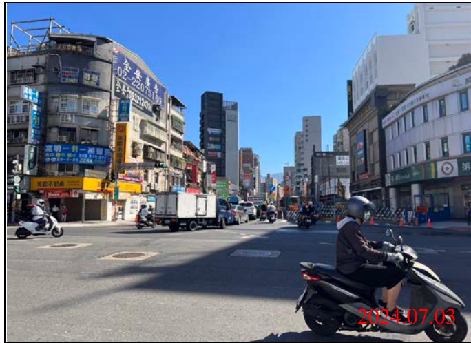
巡查日期地點：113.07.03/ Y21車站 照片說明：路面狀況