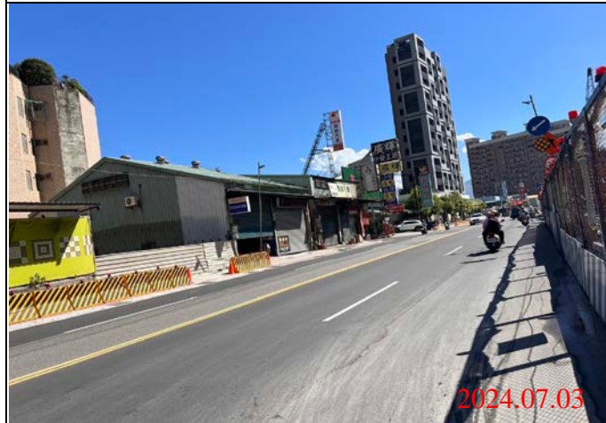
巡查日期地點：113.07.03/ Y22車站 照片說明：路面狀況