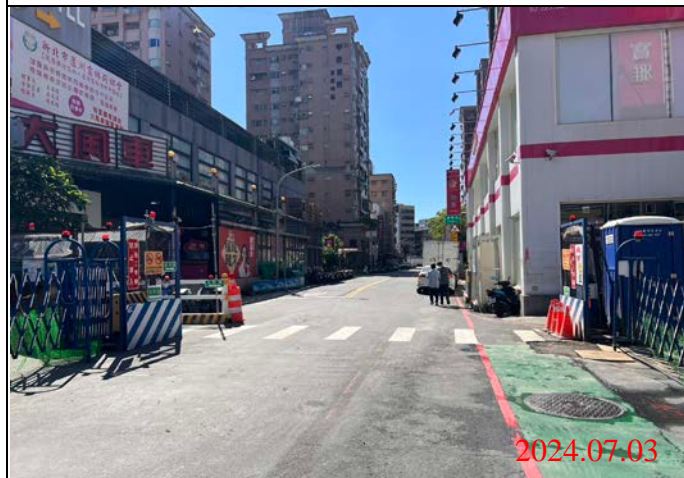
巡查日期地點：113.07.03/ Y21車站 照片說明：路面狀況