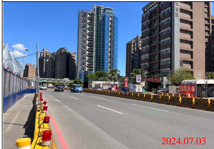
巡查日期地點：113.07.03/ Y23車站 照片說明：路面狀況