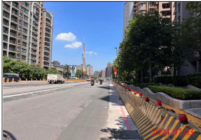
巡查日期地點：113.07.03/ Y23車站 照片說明：路面狀況