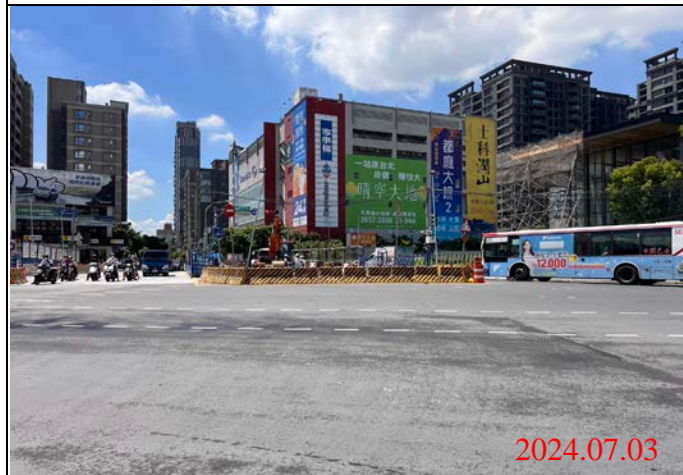
巡查日期地點：113.07.03/ Y22車站 照片說明：路面狀況