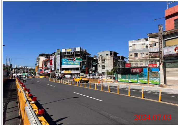
巡查日期地點：113.07.03/ Y21車站 照片說明：路面狀況