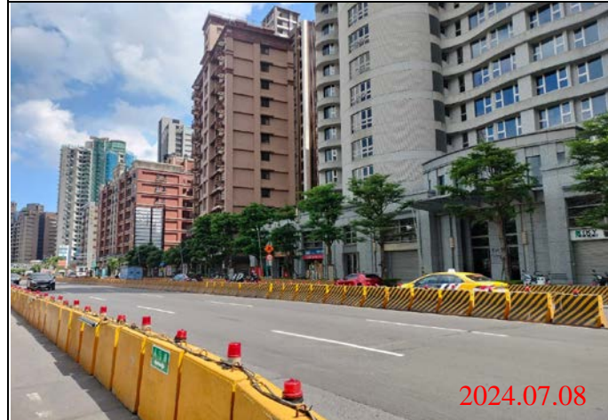
巡查日期地點：113.07.08/ Y23車站 照片說明：路面狀況