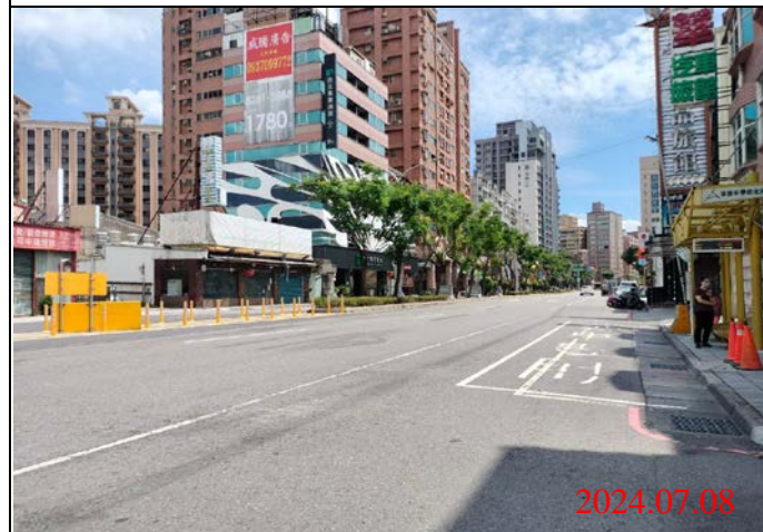
巡查日期地點：113.07.08/ Y21車站 照片說明：路面狀況