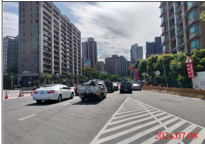
巡查日期地點：113.07.08/ Y22車站 照片說明：路面狀況