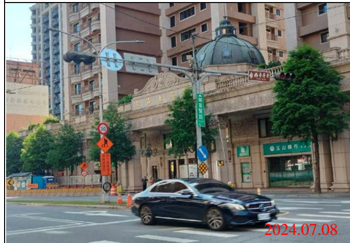
巡查日期地點：113.07.08/ Y22車站 照片說明：牌面設置狀況