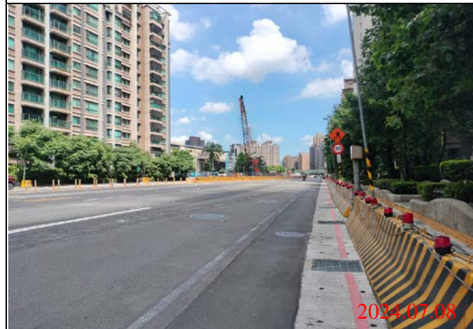
巡查日期地點：113.07.08/ Y23車站 照片說明：路面狀況