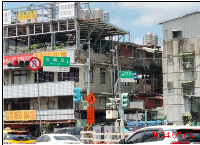
巡查日期地點：113.07.08/ Y21車站 照片說明：牌面設置狀況