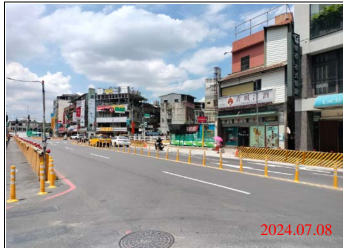
巡查日期地點：113.07.08/ Y21車站 照片說明：路面狀況