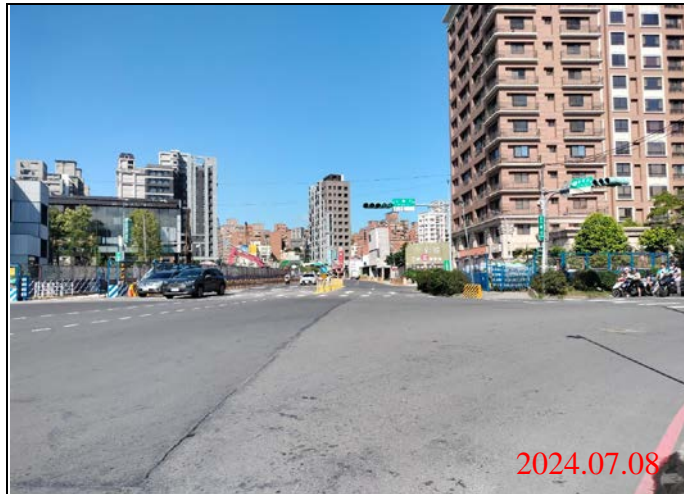
巡查日期地點：113.07.08/ Y22車站 照片說明：路面狀況