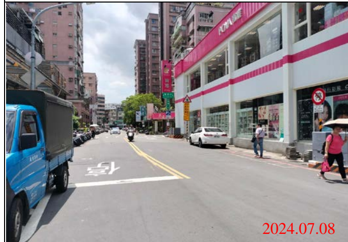
巡查日期地點：113.07.08/ Y21車站 照片說明：路面狀況