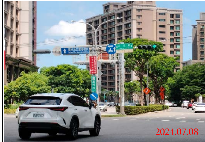
巡查日期地點：113.07.08/ Y23車站 照片說明：牌面設置狀況