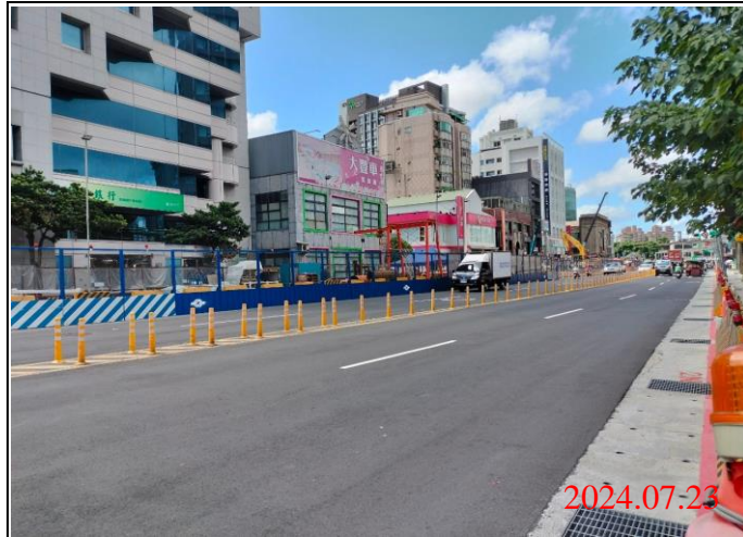
巡查日期地點：113.07.23/ Y21車站 照片說明：路面狀況