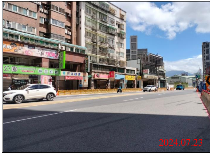
巡查日期地點：113.07.23/ Y22車站 照片說明：路面狀況