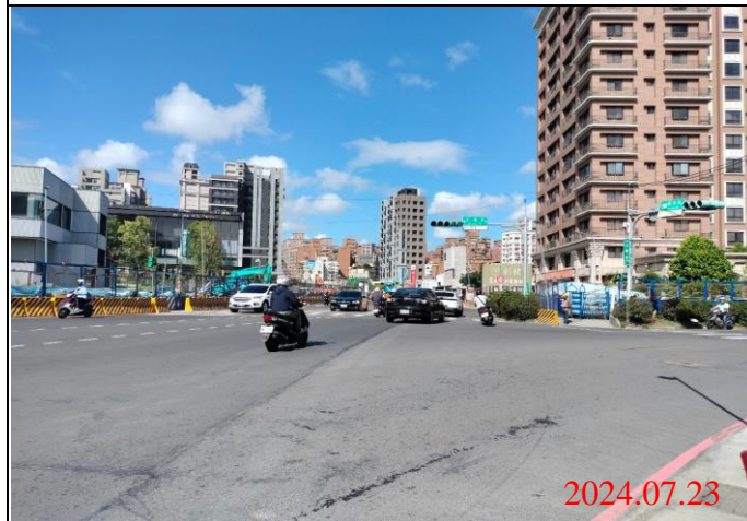
巡查日期地點：113.07.23/ Y22車站 照片說明：路面狀況