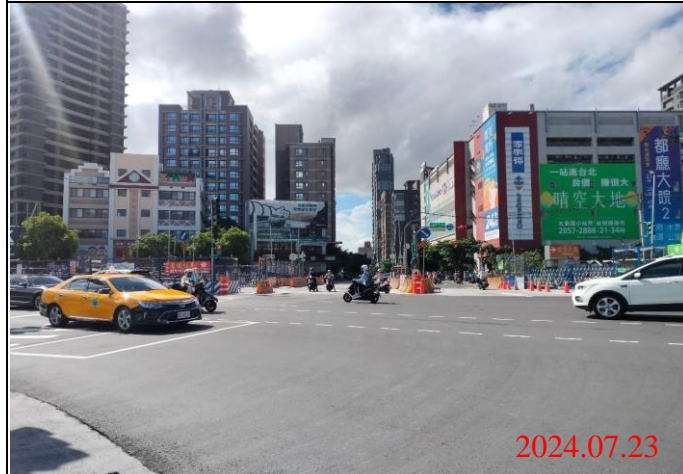
巡查日期地點：113.07.23/ Y22車站 照片說明：路面狀況