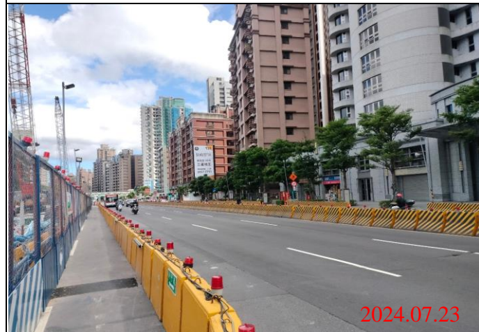
巡查日期地點：113.07.23/ Y23車站 照片說明：路面狀況