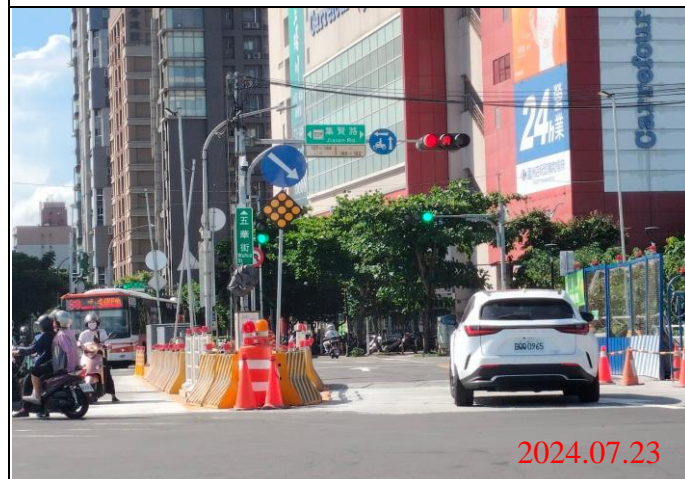
巡查日期地點：113.07.23/ Y22車站 照片說明：牌面設置狀況