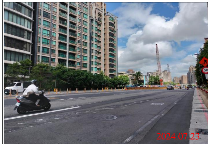
巡查日期地點：113.07.23/ Y23車站 照片說明：路面狀況