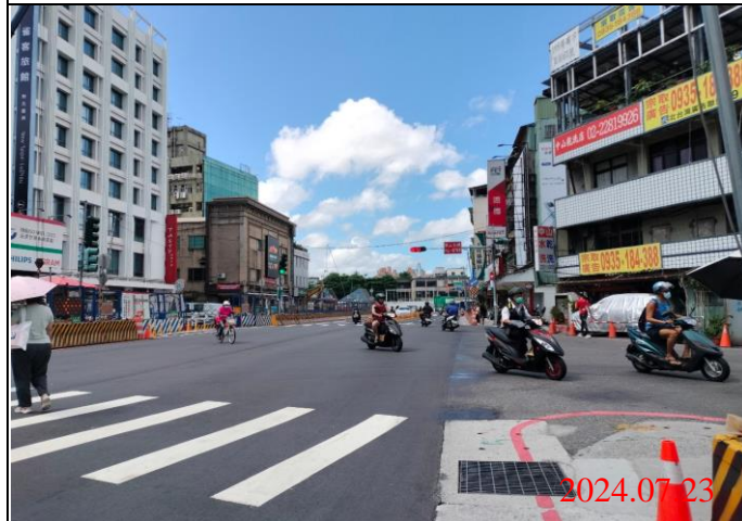
巡查日期地點：113.07.23/ Y21車站 照片說明：路面狀況