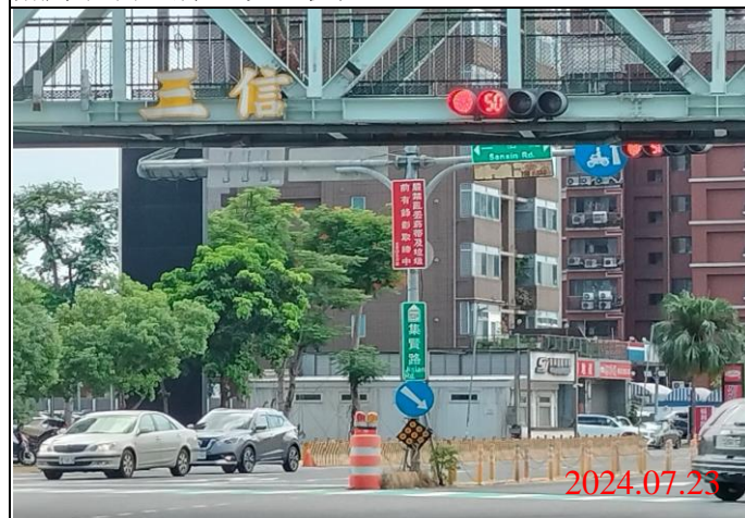
巡查日期地點：113.07.23/ Y23車站 照片說明：牌面設置狀況