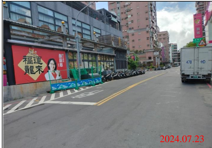
巡查日期地點：113.07.23/ Y21車站 照片說明：路面狀況